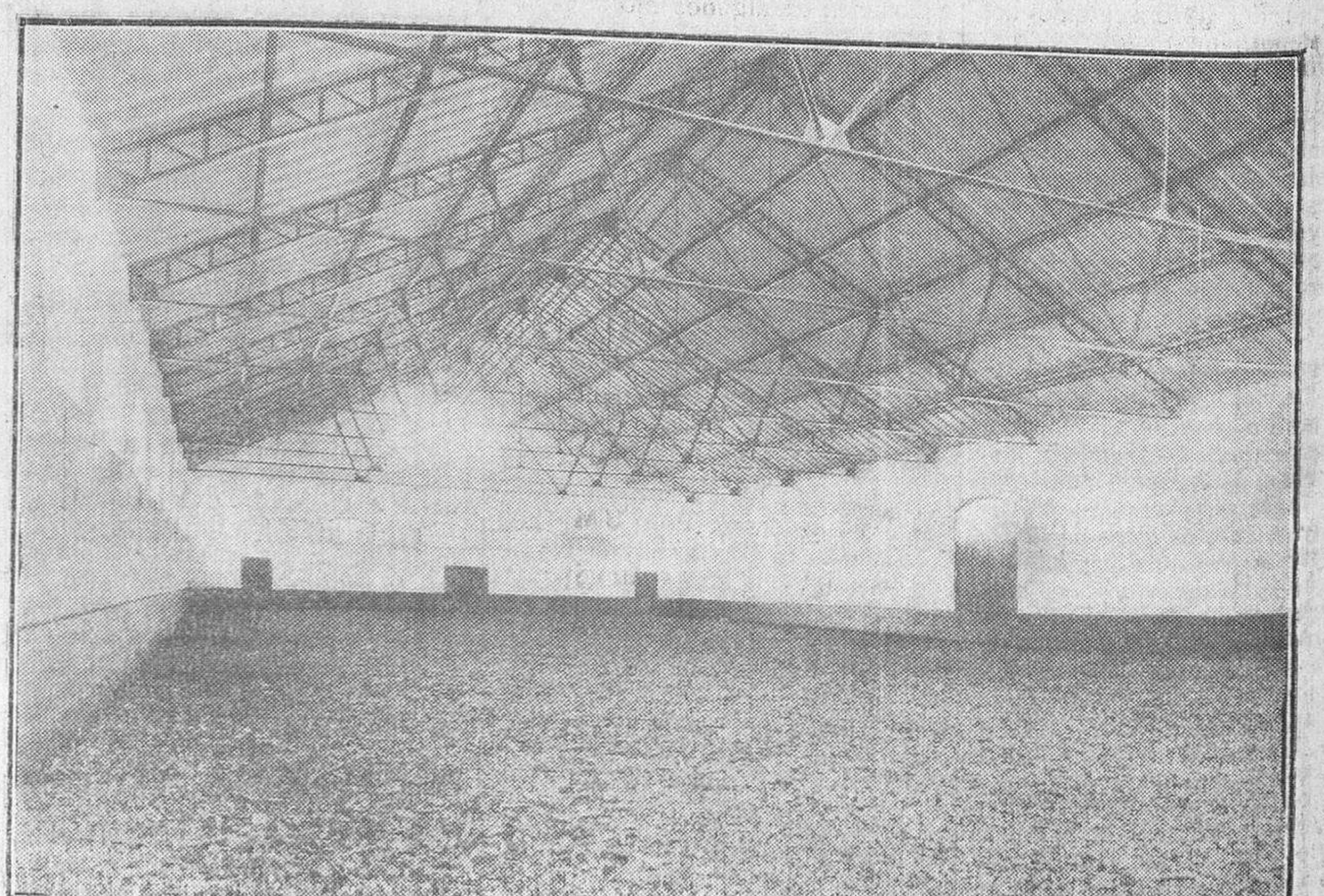
El amplio y admirable picadero cubierto, de aéreas y sólidas armaduras de hierro.