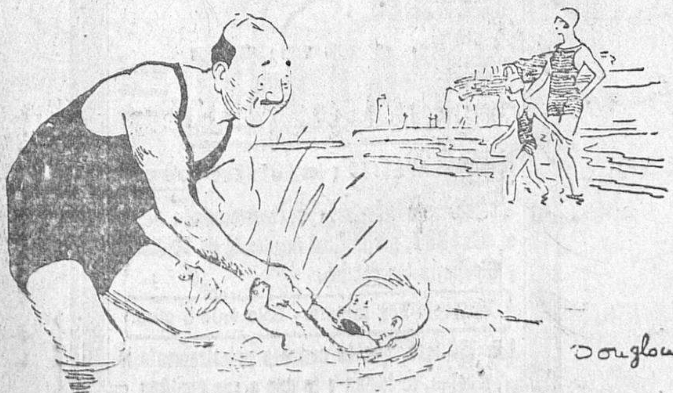
EL PEQUEÑO.—¡Sácame ya, papá, que no tengo más sed!