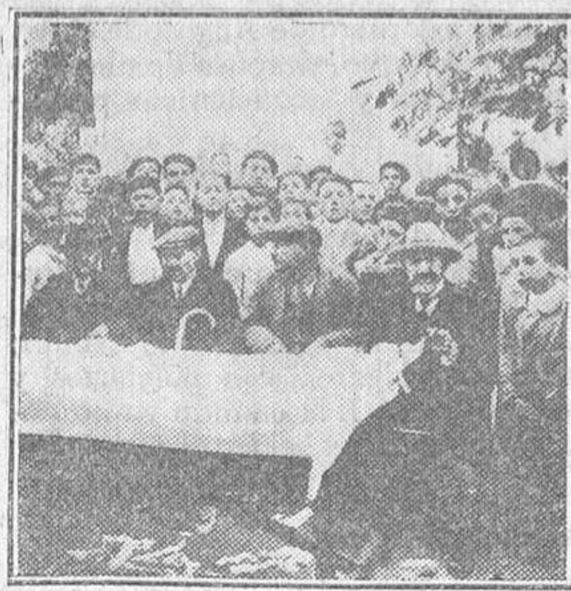
Arriba: La mesa presidencial.

Del sorteo de los rega- los de feria de EL ADE- LANTO a sus lectores.