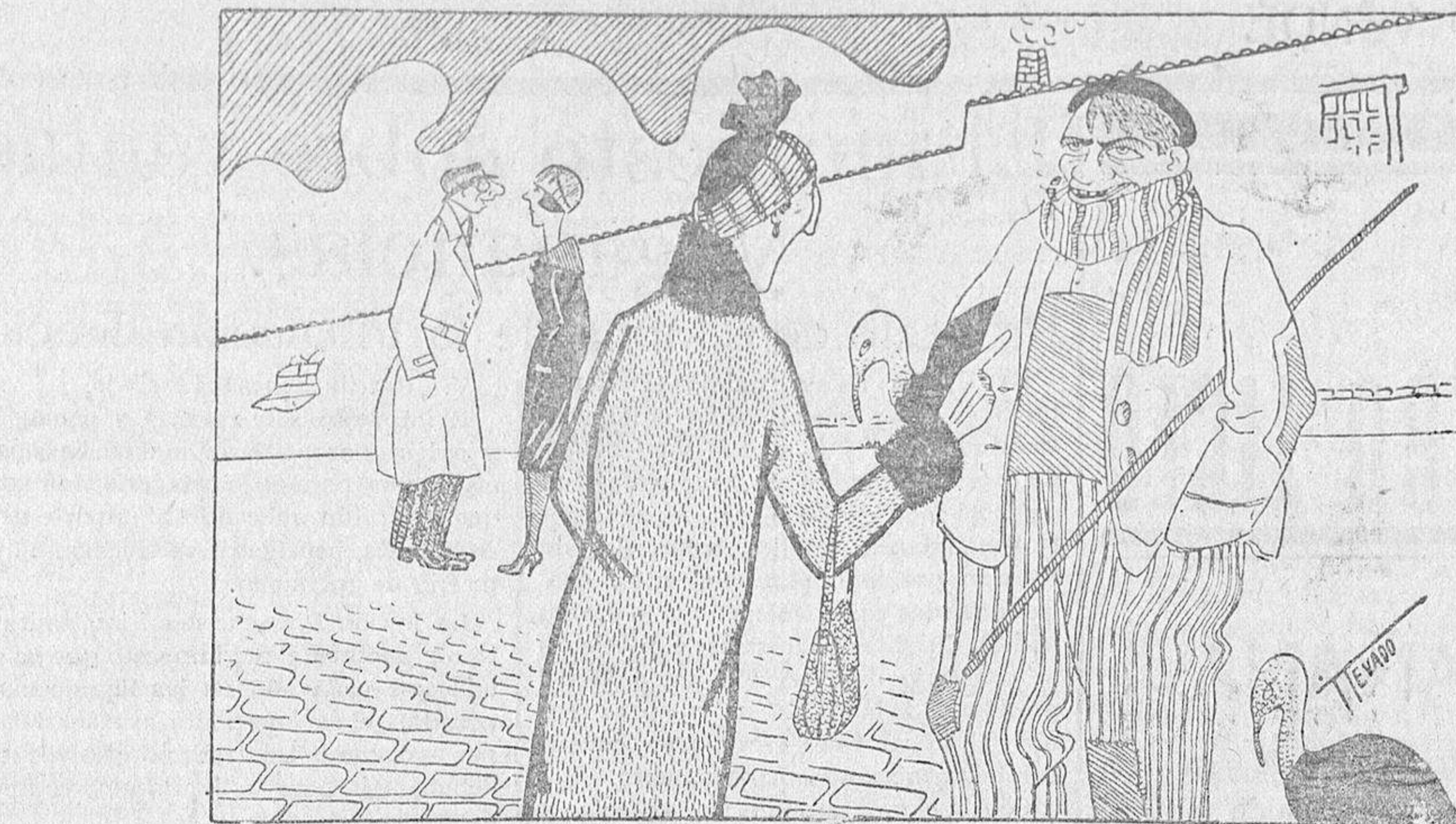
VISPERAS DE PASCUA

Actualmente, por la facilidad de comunicaciones y el intercambio intelectual creado después de la guerra europea, es sumamente fácil invitar a las eminencias mundiales como conferenciantes. Elin-