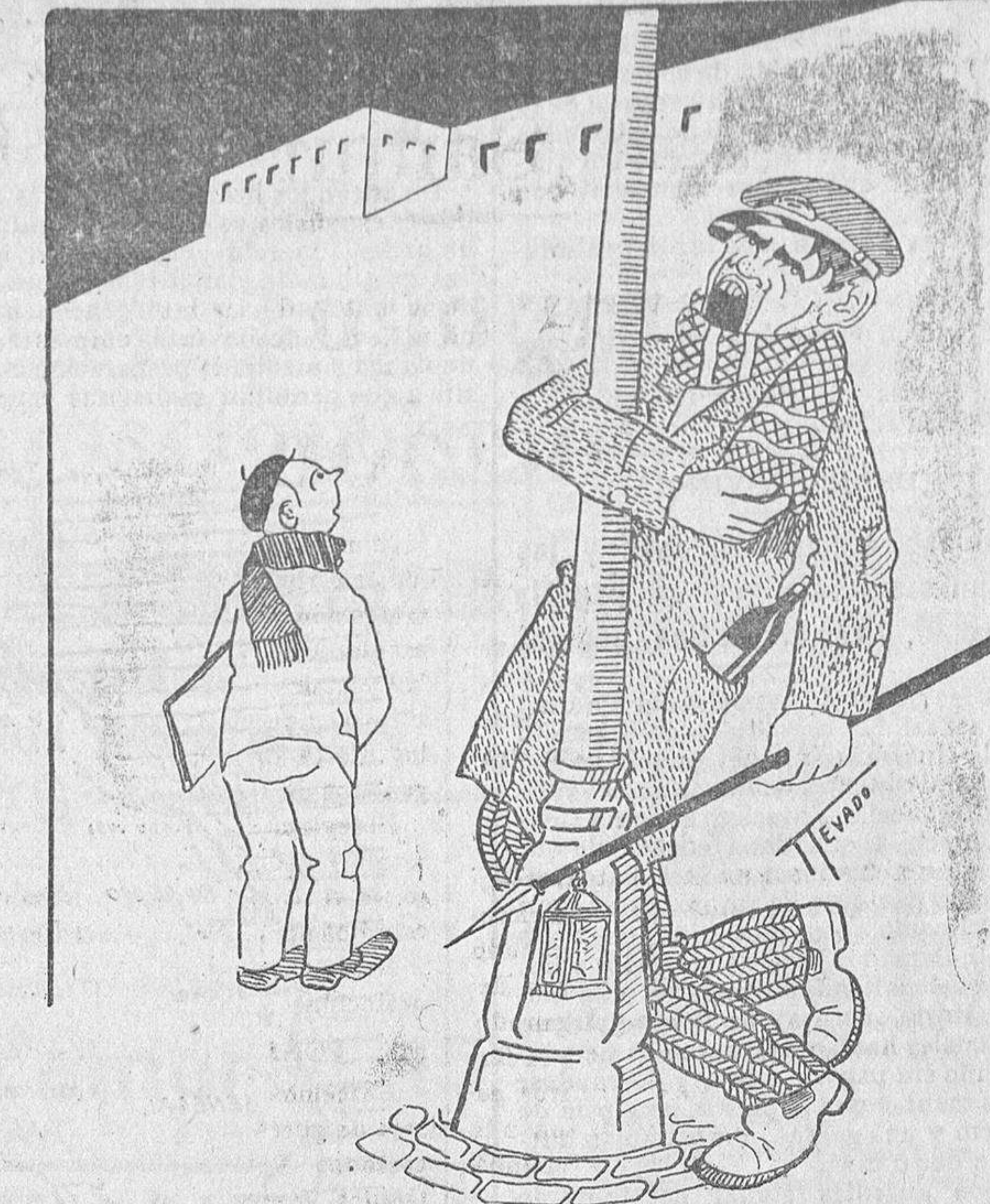
CANTARES EN ACCION

Al sereno de Encinares, honrado a carta cabal, cuanto haga falta, pedirle, pero no serenidad.