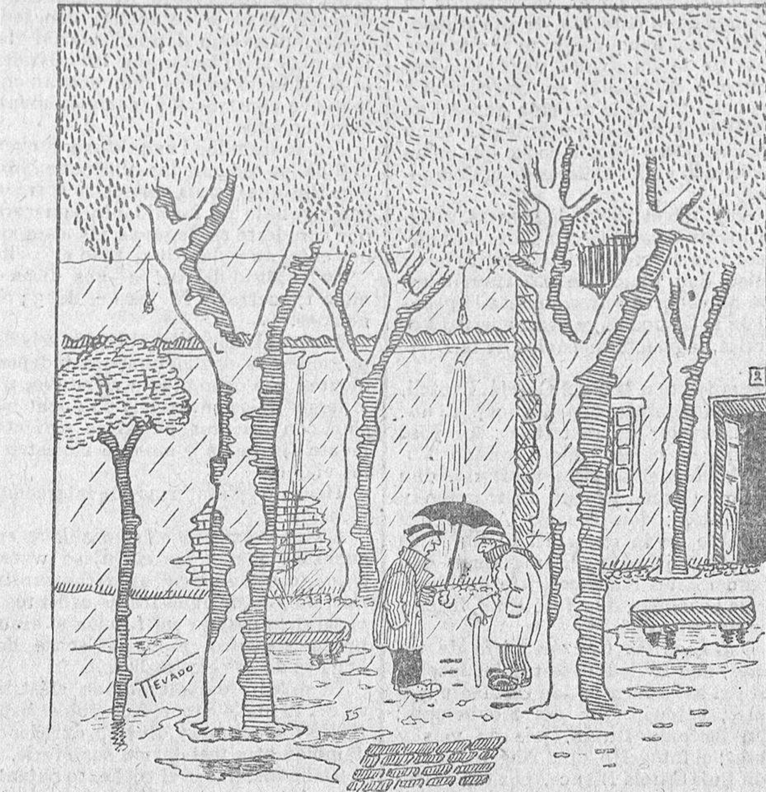
—¿Qué me dice usted de estas lluvias tan torrenciales, don Prudencio? —Que ahora es cuando creo que la navegación de alto bordo sobre el Tormentes, va a ser un hecho.

Primero, solicitar del excelentísimo señor Gobernador civil la constitución legal de la Federación Sanitaria Salmantina, sometiendo a su alta aprobación el reglamento por que ha de re-