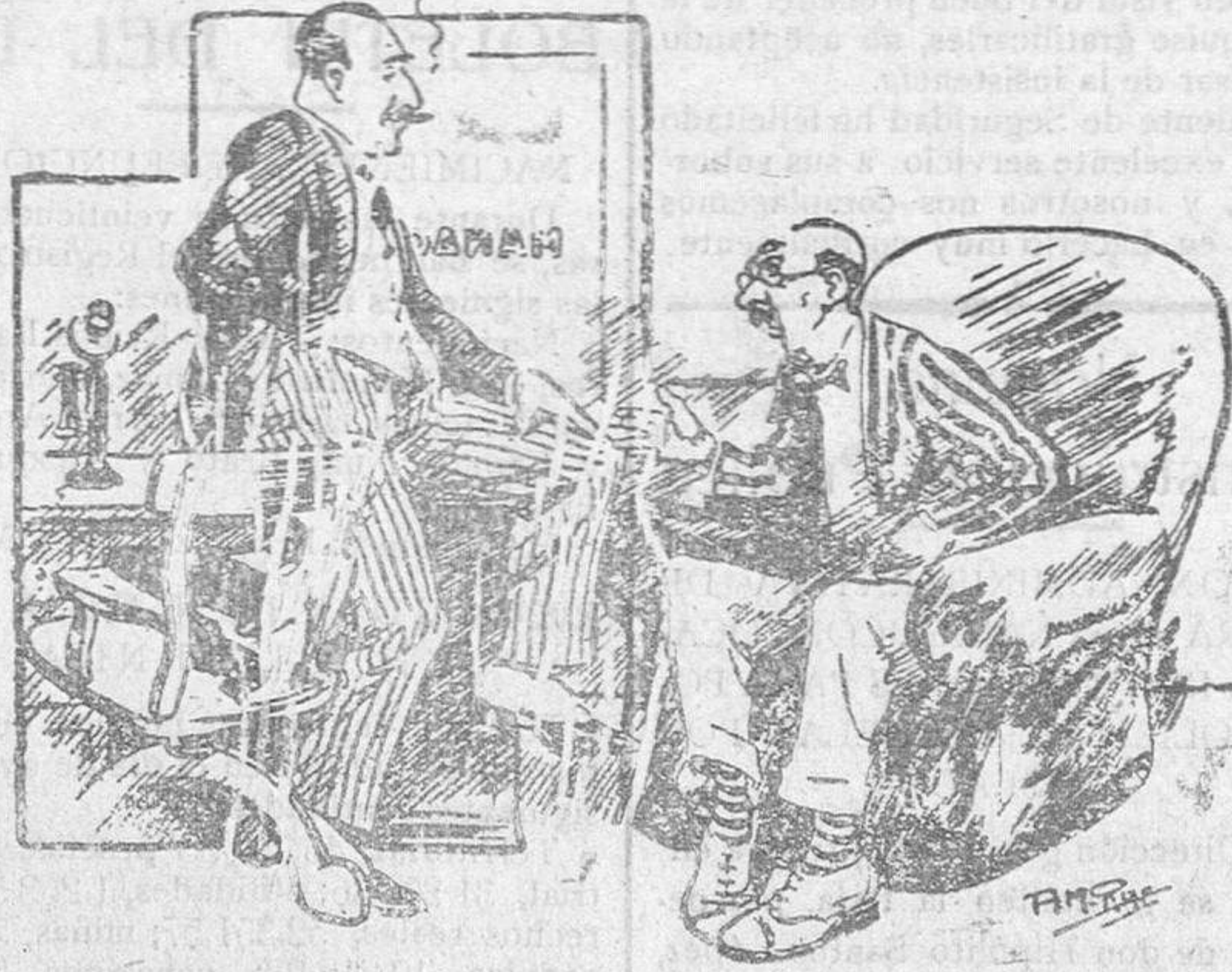
—El huesped.—¿No habría medio de evitar que la señora del cuarto número 30 siga haciendo tanto ruido por las noches? —El director del hotel.—¡Ah! ¿Es usted vecino del cuarto? —El huesped.—Soy... el marido de esa señora.

Seguidamente comenzó la distribución de vales entre los aislados, que los canjeaban por churros en un puesto establecido en los patios, y a continuación después de cantar preciosos villancicos,