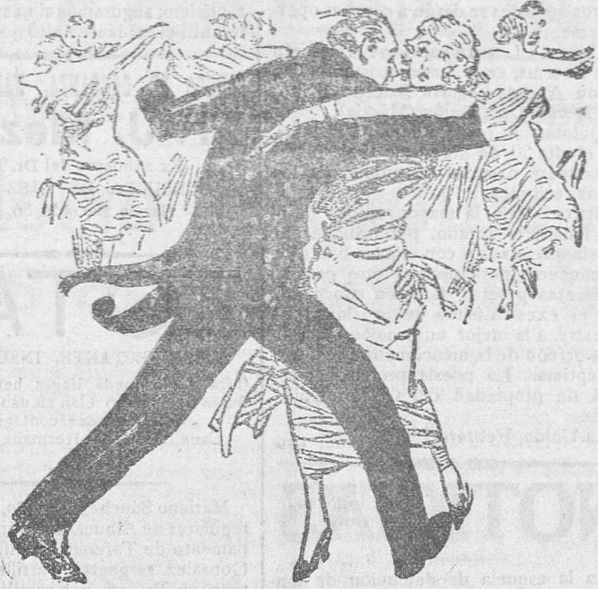
El.—Hasta esta noche, esto ha sido un desierto. Ella.—¡Así baila usted tan bien la danza del camello!

VARIAS La Asociación Primaria de Señoritas,