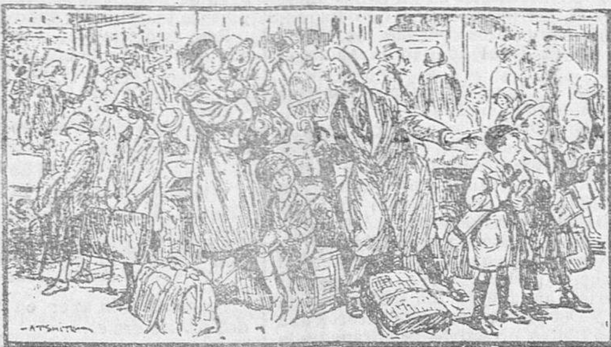
El padre (aturdido en el andén)—Uno, dos, tres, cuatro, cinco. Oye, Alicia, ¿cuántos hijos tenemos?