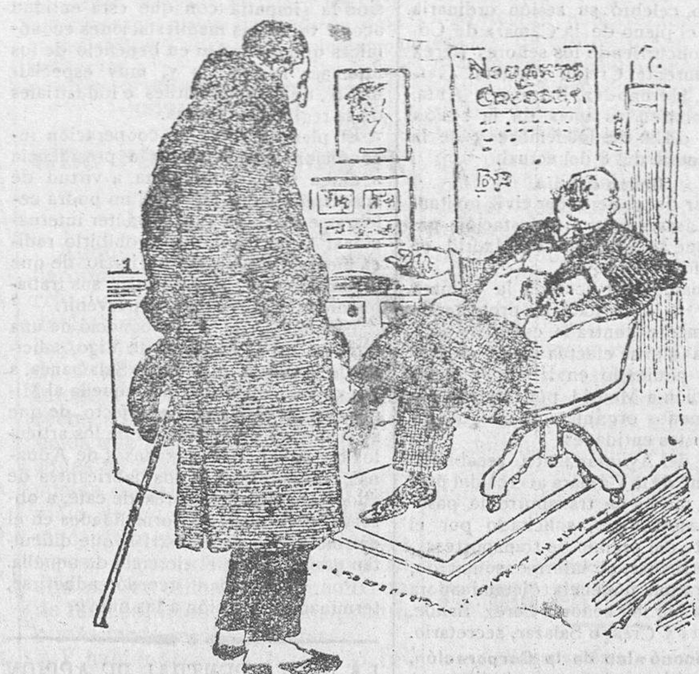
El empresario (contratando a un actor).—Ciertamente que el sueldo no es excesivo; pero tenga en cuenta que en la obra que vamos a estrenar, se pasa usted comiendo todo el segundo acto.

rano, se le envían títulos de interinos y órdenes de posesión.