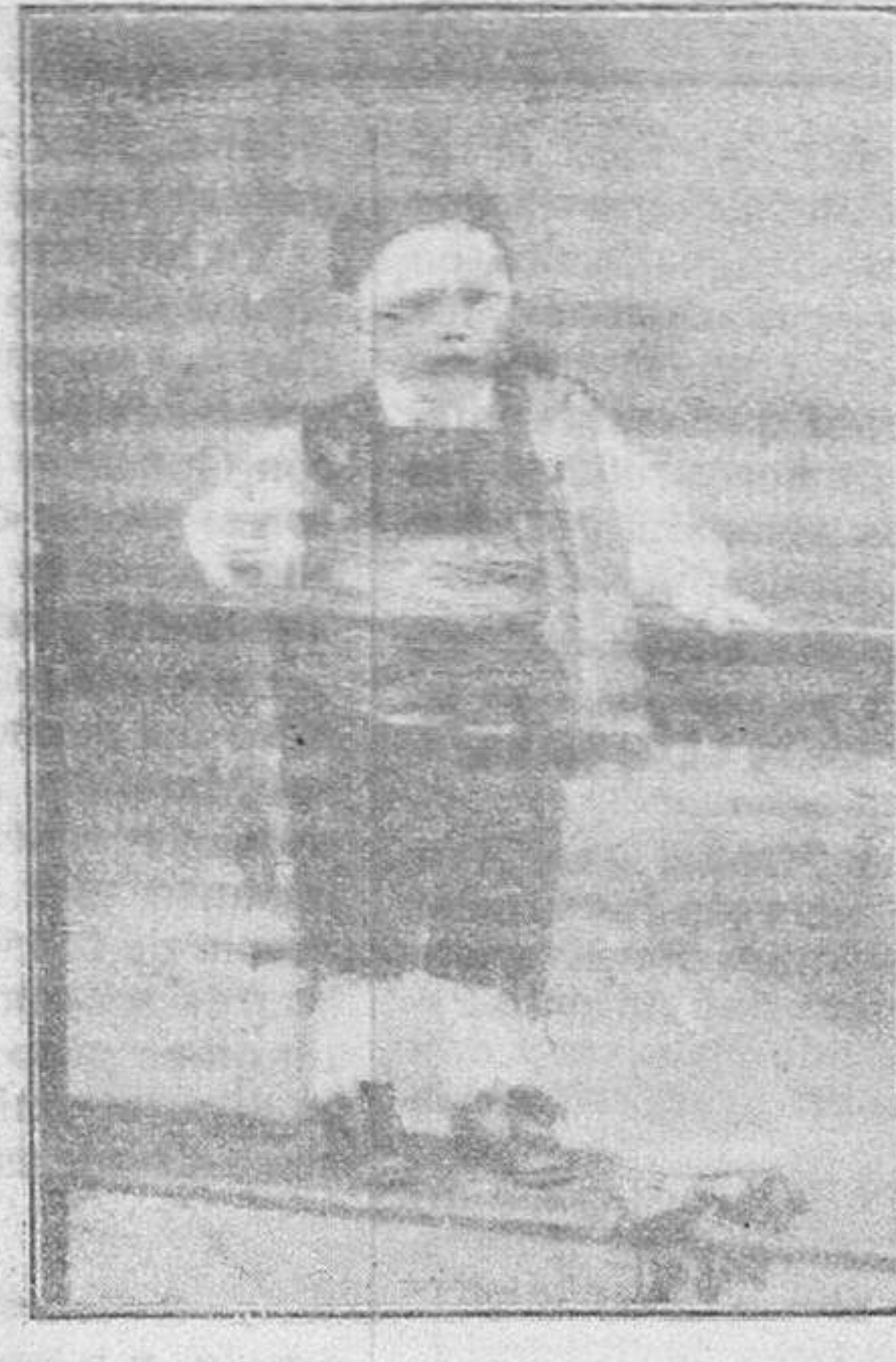
332.—(No figura el nombre, por haberse extraviado la nota donde estaba consignado).