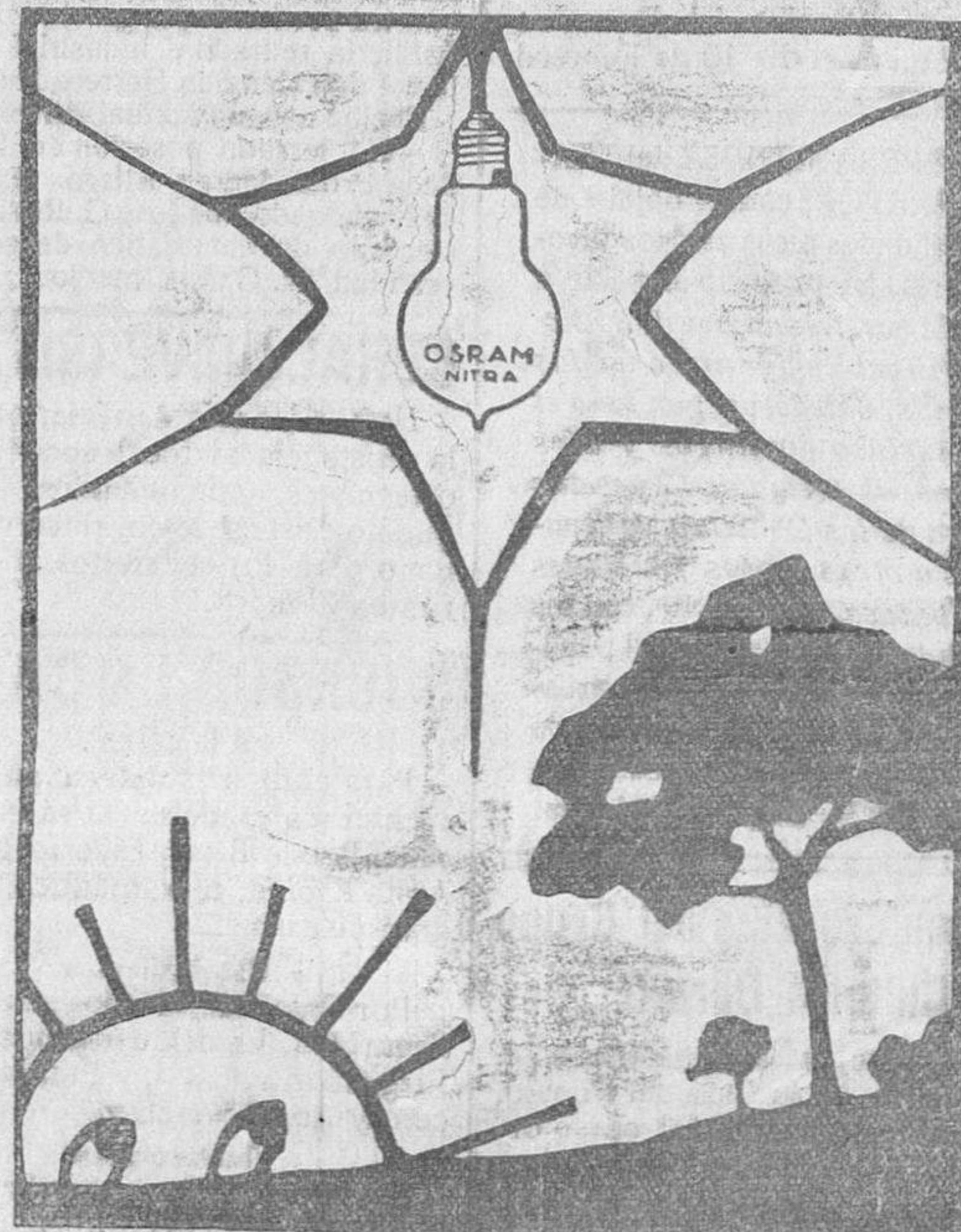
El Sol se marcha dispuesto, a dejar que la Osrám-Nitra ocupe siempre su puesto.

El Ungüento Cadum ha demostrado ser un gran remedio para millares de personas que han estado sufriendo durante años de enfermedades tan molestas como de tan mal aspecto para la piel. Las lastimaduras, erupciones y otros padecimientos angustiosos ceden prontamente a sus propiedades curativas tan maravillosas. Es distinto a cualquier otro remedio y puede usarse con toda confianza. Hace cesar al instante la picazón y cicatriza en seguida el eccema, acné (barros), granos, forúnculos, úlceras, erupciones, urticaria, ronchas, almorranas, comezón, sarna, heridas, arañazos, cortaduras, lastimaduras, postemillas, escaldadura, costras, sarpullido.