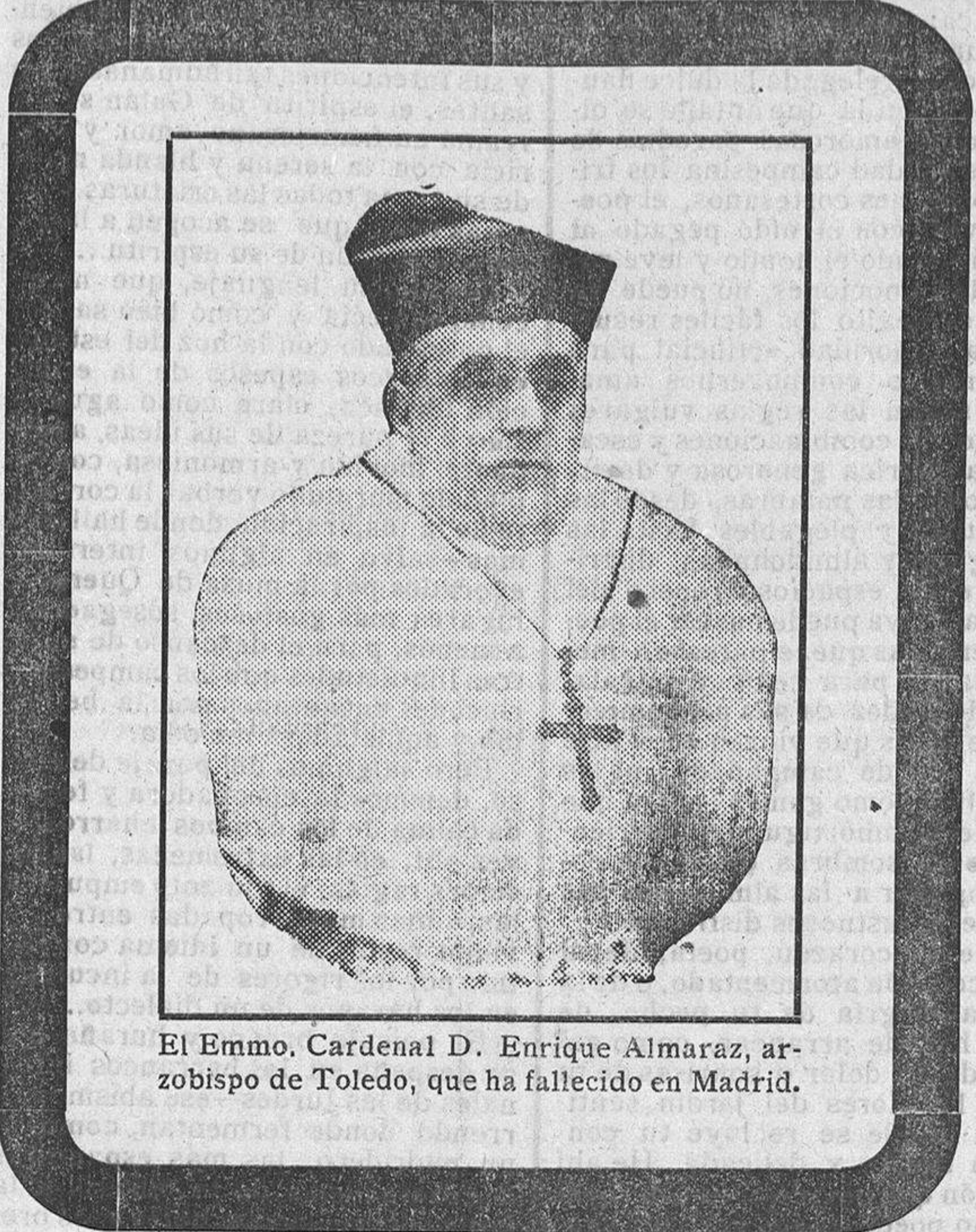
El Emmo. Cardenal D. Enrique Almaraz, arzobispo de Toledo, que ha fallecido en Madrid.

Tras de la agravación y recalcía en su enfermedad, ayer dolorosamente llegó a Salamanca la noticia de la muerte en Madrid del Emmo. señor don Enrique Almaraz, Cardenal primado de España y Arzobispo de Toledo. Nunca con más razón podemos aplicar el título de ilustre a nuestro paisano, que nacido en el centro de la típica comarca salmantina, la Armuña, en la Vellés, ha subido, enaltecido por sus excepcionales méritos de virtud y ciencia, a la cumbre de la jerarquía eclesiástica nacional y honrando su figura preeminente de la Iglesia española, con la púrpura cardenalicia. Cuando en la silla metropolitana hispalense fué honrado con la dignidad de Príncipe de la Iglesia, y más tarde su exaltación a la Primada de Toledo, Salamanca se sintió orgullosa de que un paisano nuestro mereciera tan preclaros honores, escalón de una jornada, que Dios ha finalizado, privando a España de uno de sus más ilustres varones y a la Iglesia del