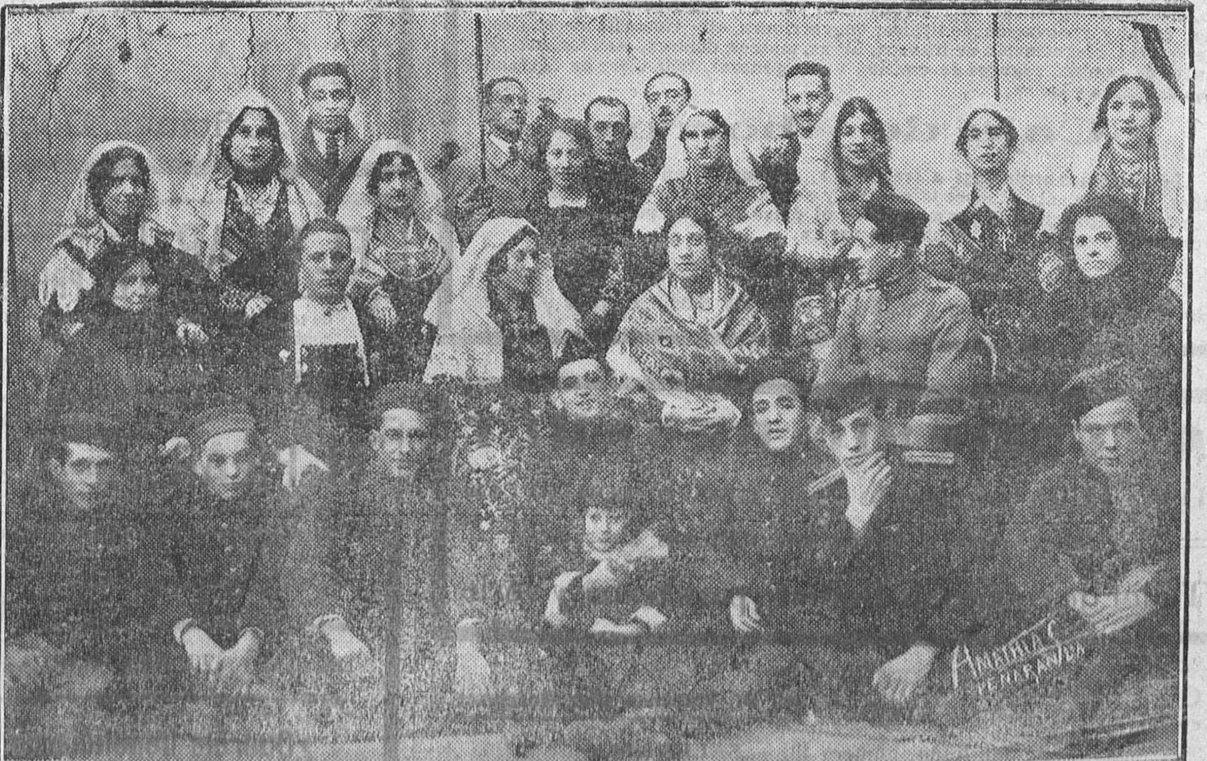
Grupo de señoritas y jóvenes de la sociedad peñarandina, que han tomado parte en una velada patriótica celebrada recientemente y a los cuales se ha invitado para que cooperen a la fiesta en honor de Gabriel y Galán, proyectada para muy en breve en la inmediata ciudad.

NOVELTY CAFE RESTAURANT Variado y selecto menú por cubiertos y a la carta. Langosta diaria. Se sirven banquetes, bodas y lunches.