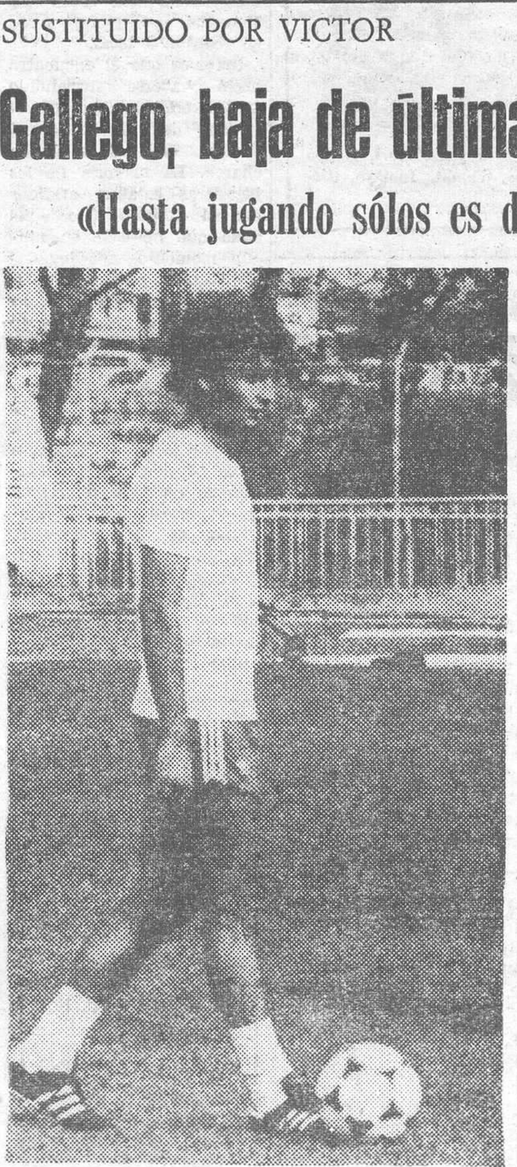
Gallego será el ausente en la alineación de Miguel Muñoz. Una lesión de última hora ha tenido la culpa.

un entrenamiento contra el Betis Deportivo, de tercera, que ha tenido que ser suspendido a los 65 minutos a causa de la lluvia. Muñoz jugó en el primer tiempo un 3-3-4, con Buyo; Salva, Maceda, Camacho; Gallego, Güerri, Gordillo; Carrasco, Santillana, Rincón y Marcos. Luego Sánchez suplía a Gallego. Los jugadores extrañaron el sistema, por lo que el «sparring» se adelantó en el marcador. Luego, la selección hizo cuatro goles —dos Carrasco y dos Santillana—, más o menos la tercera parte de los que van a necesitar el miércoles. El ambiente es de preocupación ante lo elevado del listón. Muñoz reconoció esta mañana que es muy difícil marcar once goles «hasta jugando solos». Por contra el debutante Buyo se brindaba el mismo para «marcar el undécimo».