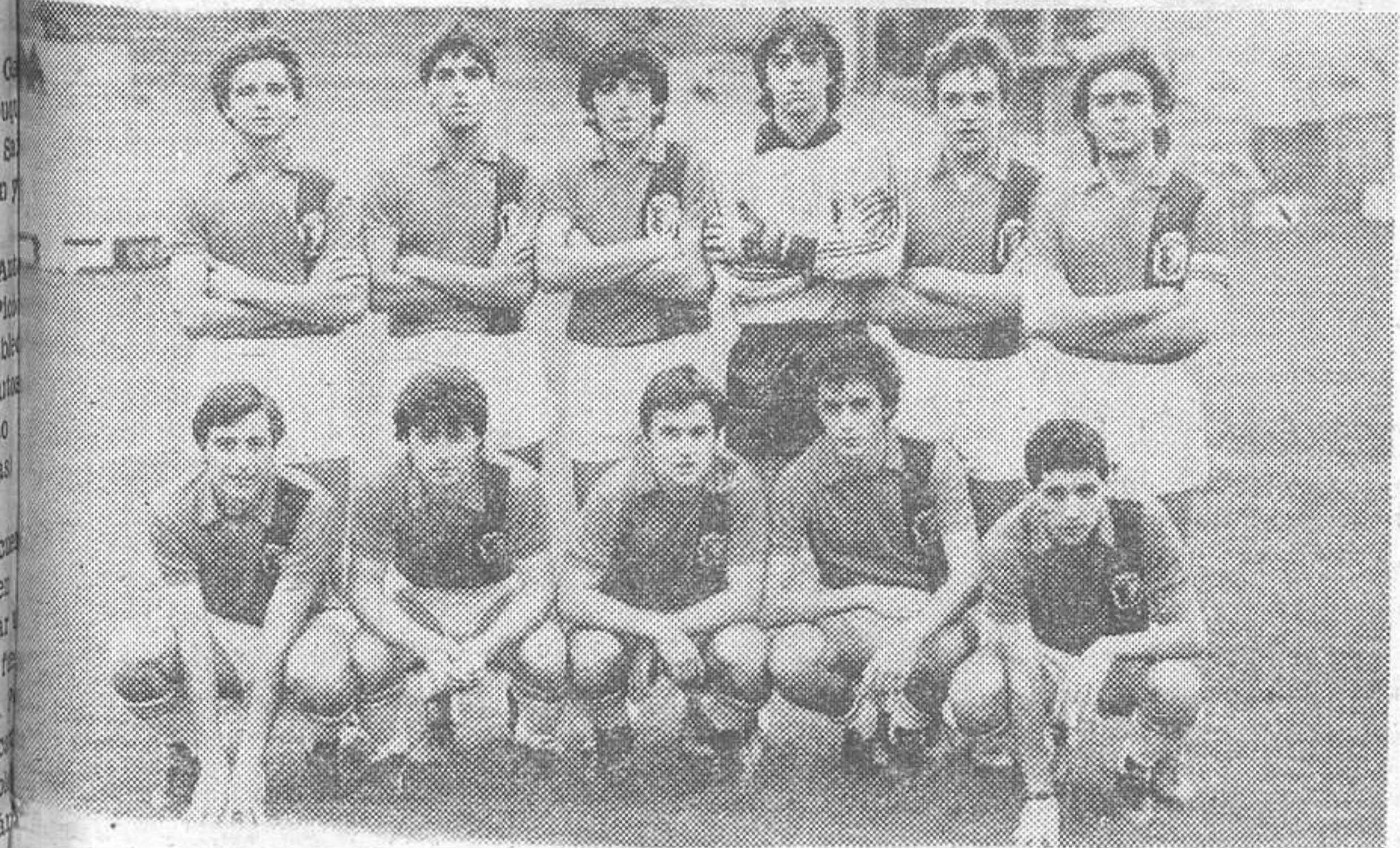
El Real Burgos demostró estar en buena forma física, en el encuentro disputado frente al C. D. Bosco-Salesianos, de Zaragoza. El marcador no reflejó los méritos que hizo el equipo local.

El Real Burgos Juvenil, se impuso por un gol a ce al C. D. Bosco Salesianos, Zaragoza, en jornada correspondiente a la Liga Nacional. La primera parte terminó sin goles.