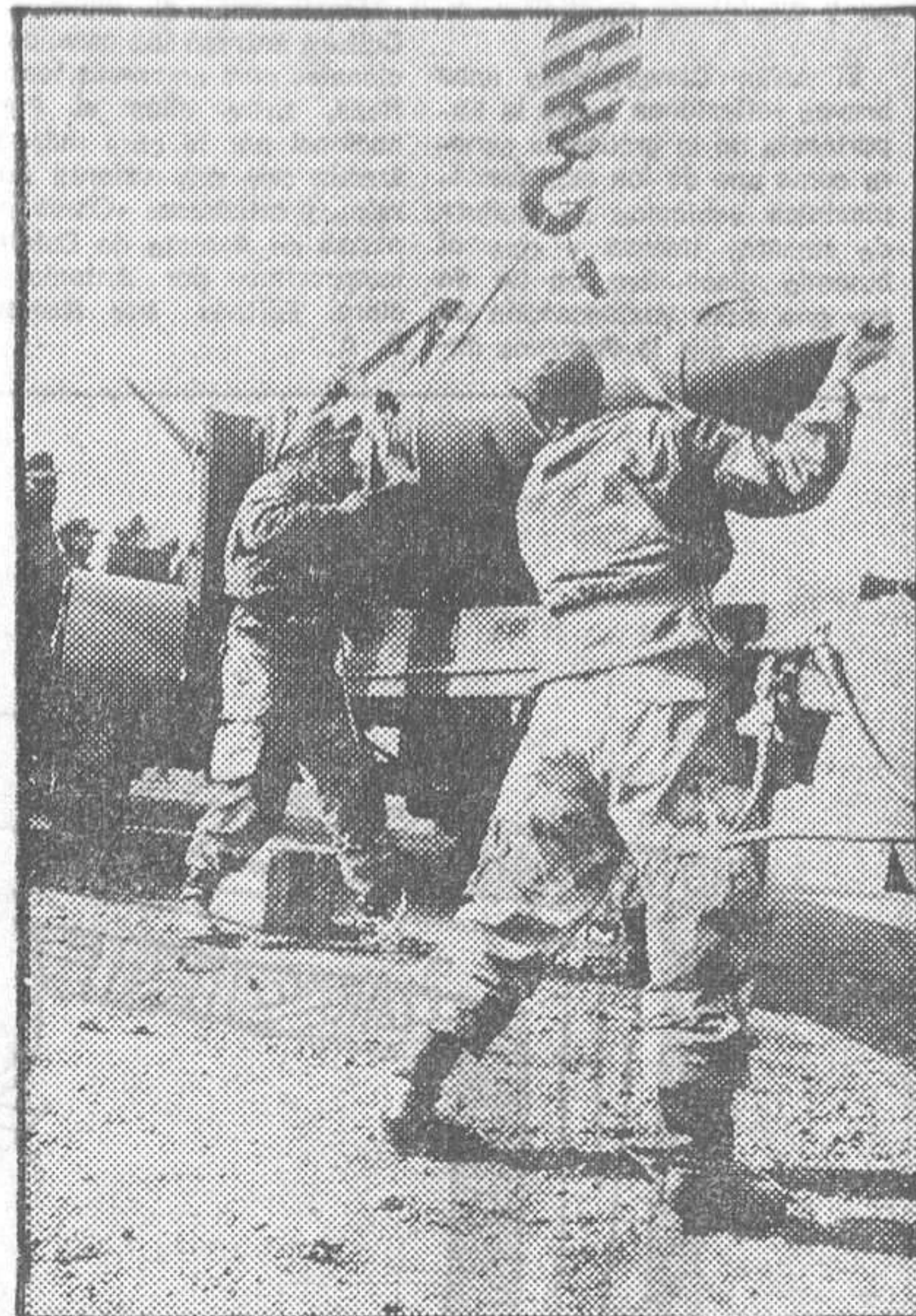
Soldados alemanes occidentales colocan en posición un misil táctico.

La justificación oficial de tan cuantioso gasto está en línea de la misma vieja explicación que viene siendo usada por los establecimientos políticos y militares de todo el Mundo desde hace tiempo: «¡Que viene el lobo!». O sea, que vienen los rojos. La fórmula empleada en esta ocasión es que tal gasto es necesario ante «la amenaza militar, tecnológica y económica procedente de la Unión Soviética y sus aliados».