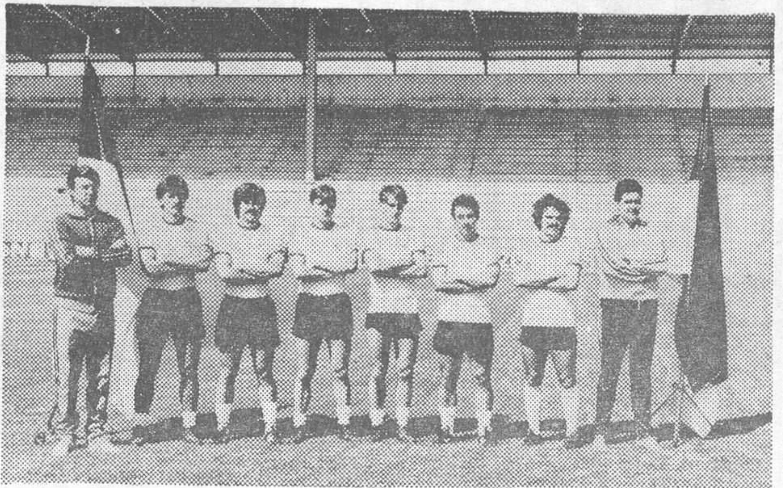
La operación García Traid ha fallado. En la foto de archivo aparece el primero a la derecha y después de él algunos de los que llegaron. Tres meses después de comenzar la Liga cayó el técnico.

"Son muchas las causas que me han empujado a tomar esta decisión"