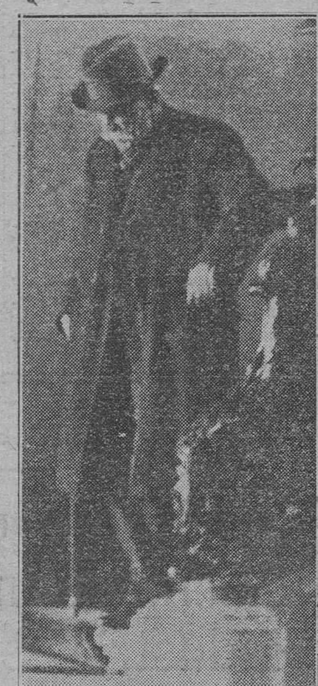
El último retrato del mariscal

Esta es, en líneas generales, la biografía del ilustre militar que está en peligro de muerte. Sin ser un genio de la guerra, ni mucho menos, es un hombre que prestó grandes servicios a su patria y en momentos de los más graves por que atravesó esta nación, y en todo momento mereció la consideración de sus compatriotas, aun en aquellos en que peligró su prestigio por los reveses de sus ejércitos. Su serenidad y su optimismo impidieron muchas veces que no se perdiese el espíritu militar y patriótico del ejército francés.