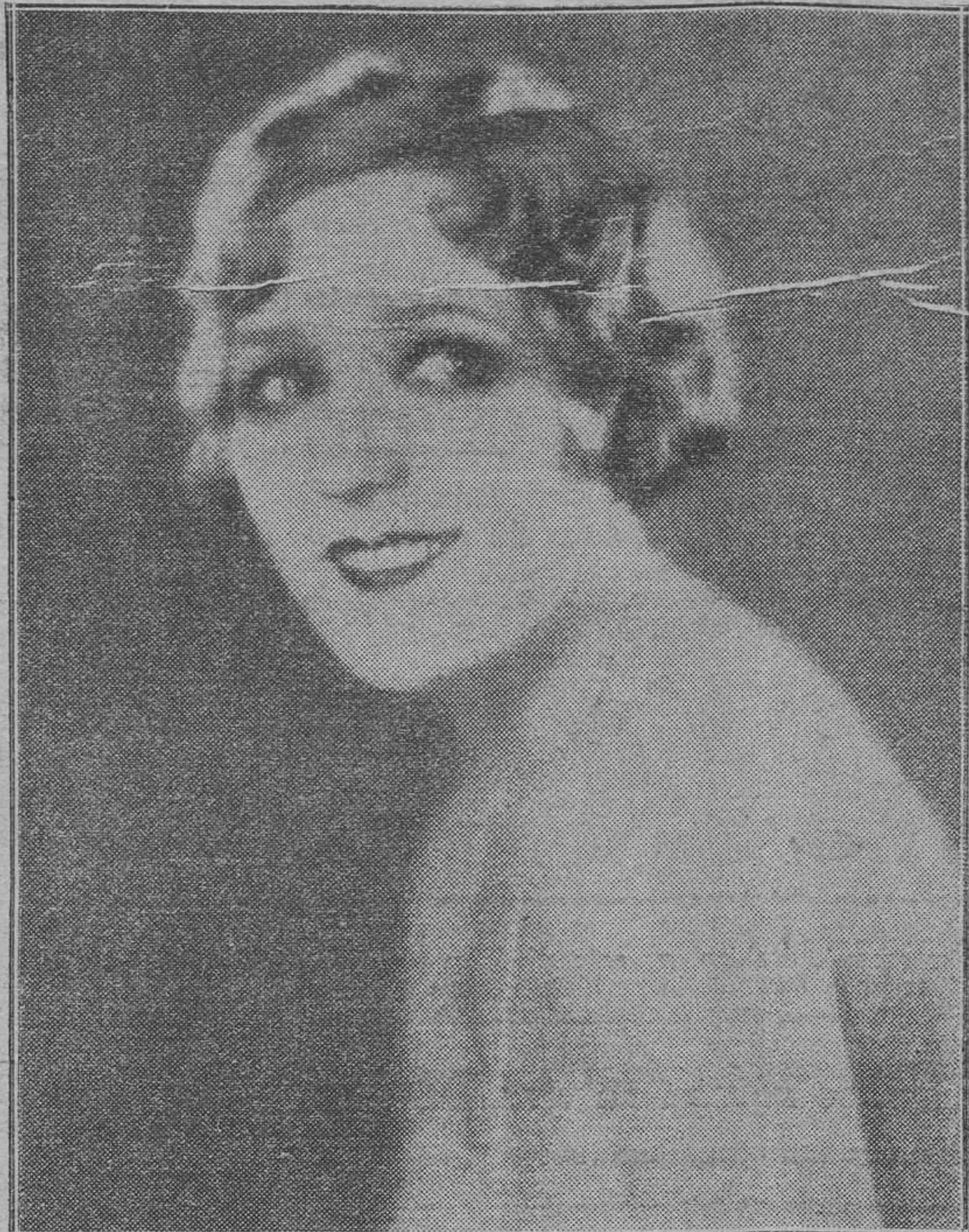
MARY PICKFORD Inspiradísima intérprete de la película «COQUETA»...

Y, lo dicho, la «mise en scene» constituye un problema de difícil solución y no poco grave.