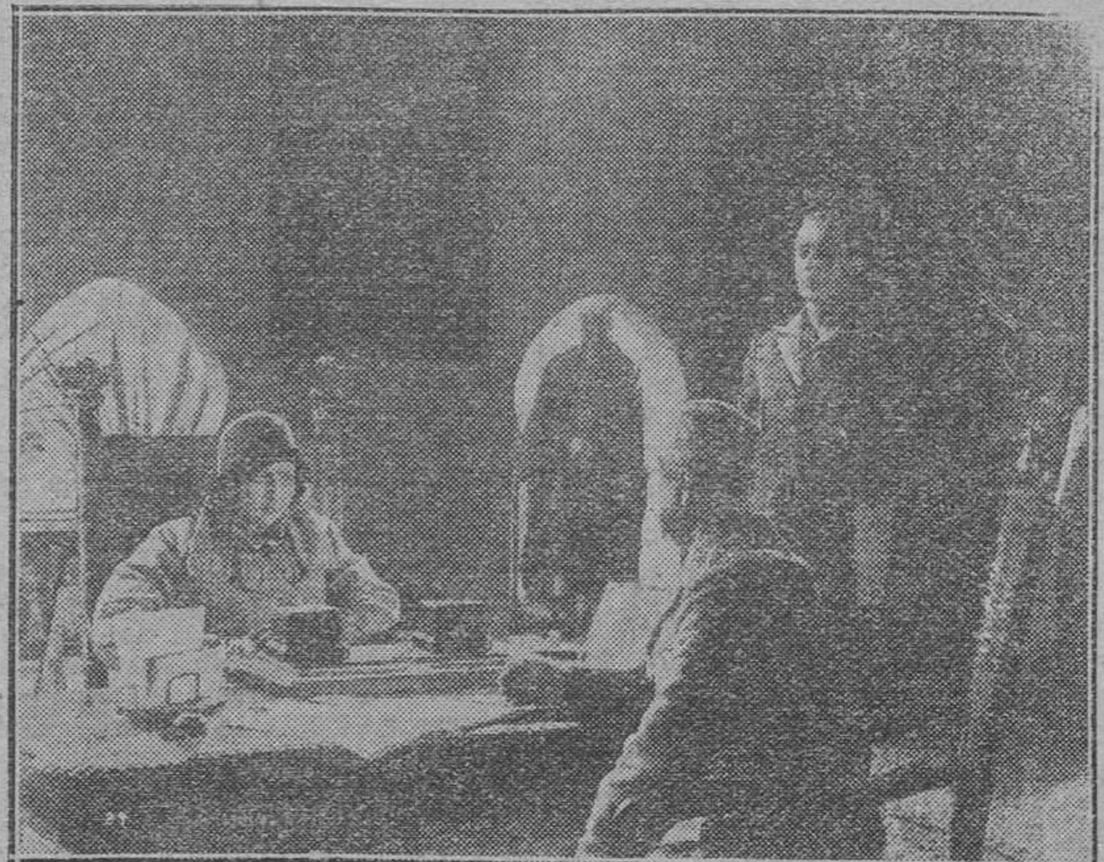
Una interesante escena de la película «EL LEGIONARIO 67-82»...