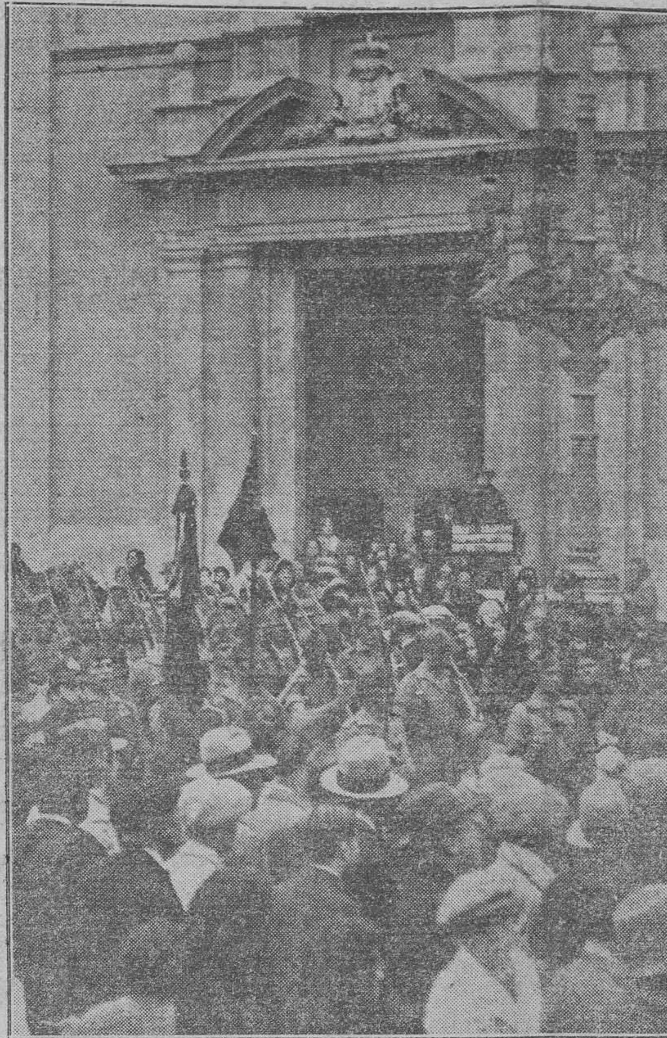
La visita a nuestra patrona la Virgen de los Desamparados