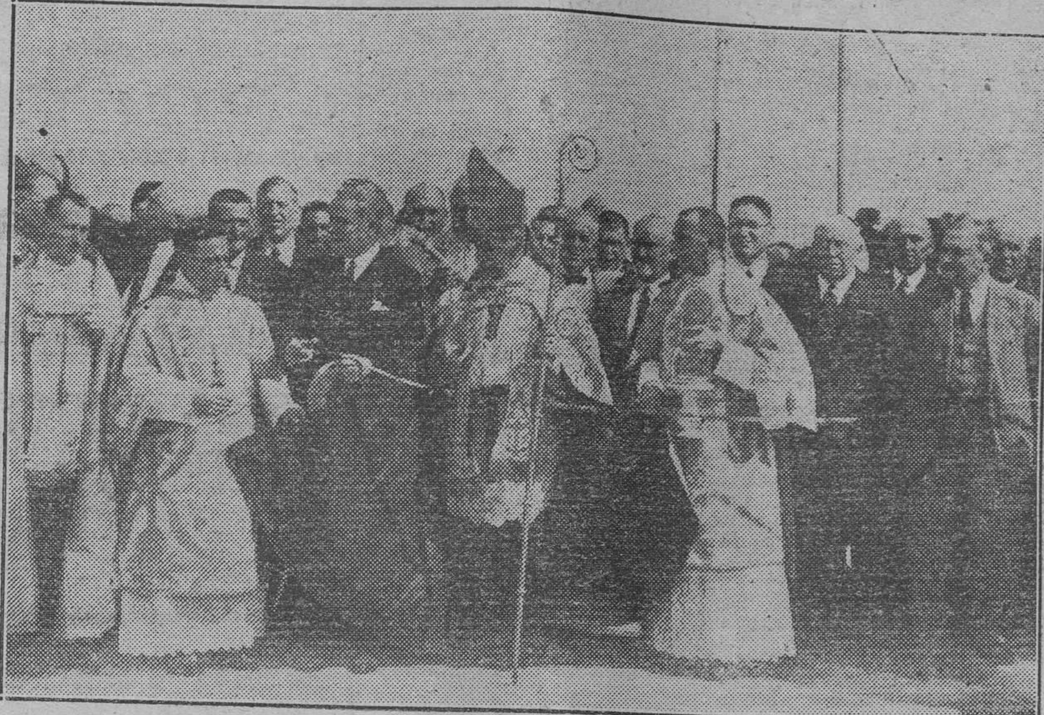
Acto de inaugurarse el puente