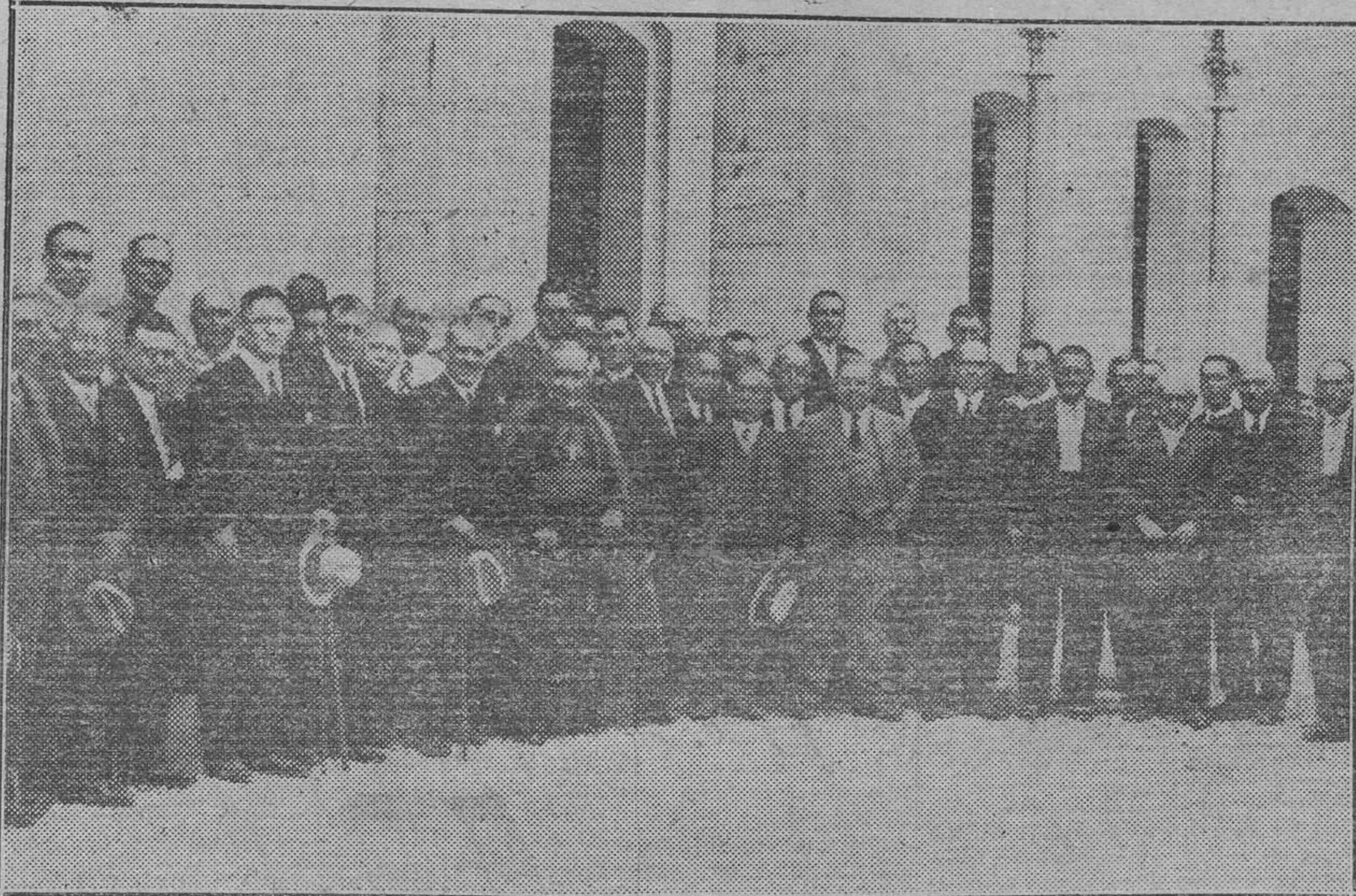
Autoridades e invitados

«Las Provincias» en Berlín Estamos en vísperas de grandes acontecimientos Es verdad que las urnas alemanas han dado un resultado que nadie se esperaba. Era de prever el aumento de sillones en el Parlamento del partido comunista. También se sospechó que los partidarios de Hitler alcanzarían una victoria. Lo que no era posible suponer, refiriéndose a esa victoria, era el número exagerado de votos alcanzados por el partido fascista.