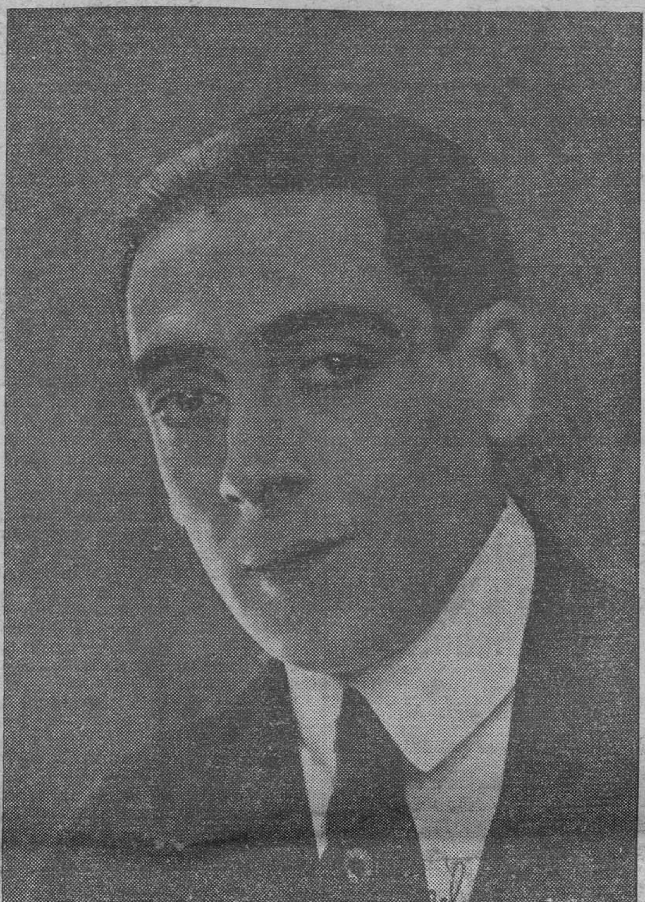
REDONDO DEL CASTILLO

el famoso bajo de ópera que con la Paquita , Sempere y Sugi-Barba , interpretará «Marina» en los Viveros el próximo 25