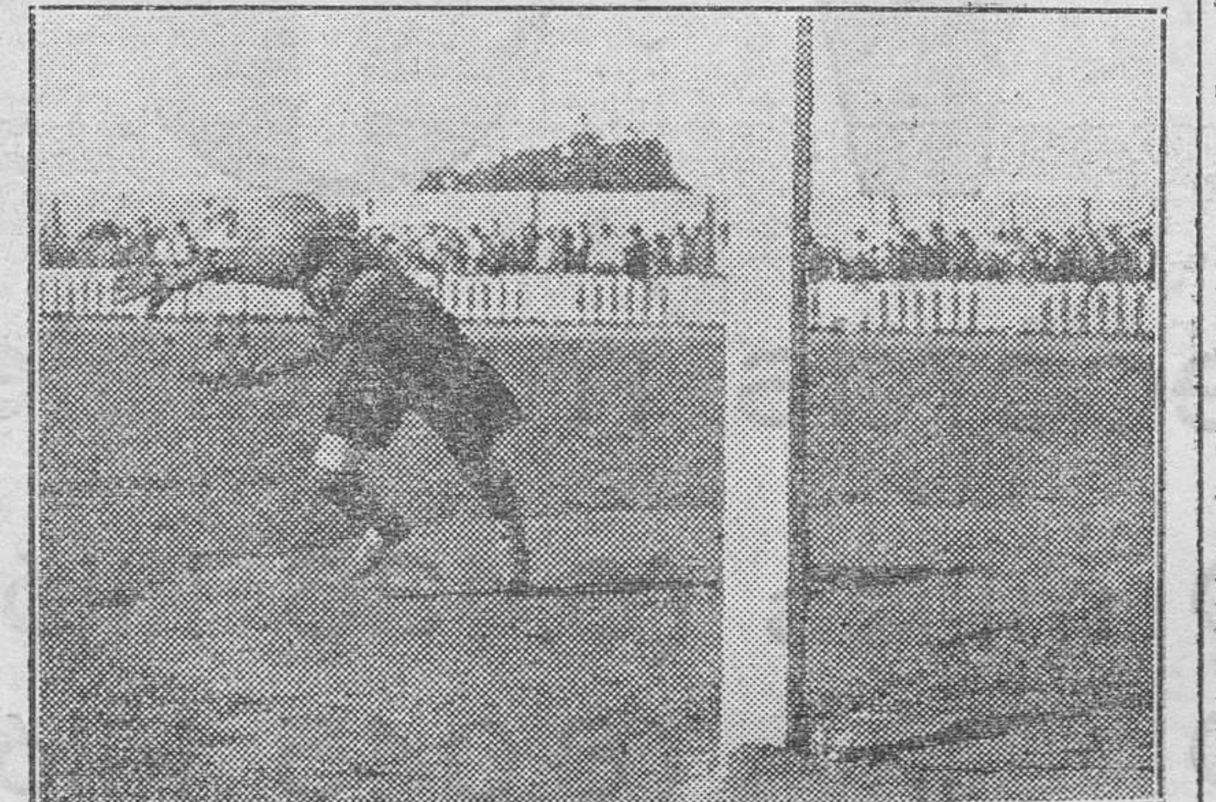
Una de los gols del Valencia.

El Moto Club Valenciano ruega a sus asociados asistir hoy martes, a las siete de su tarde, al domicilio social, donde se celebrará junta para tratar de asuntos y detalles del próximo campeonato regional.