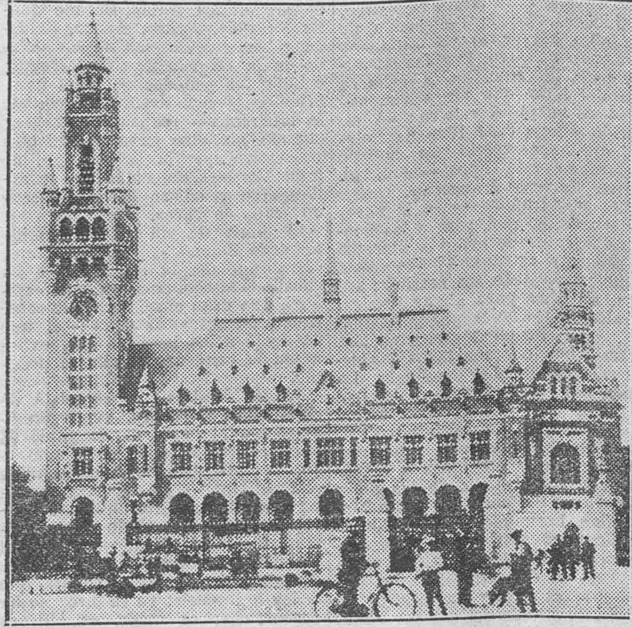
El Palacio del Ayuntamiento, donde celebran la Conferencia de las Reparaciones