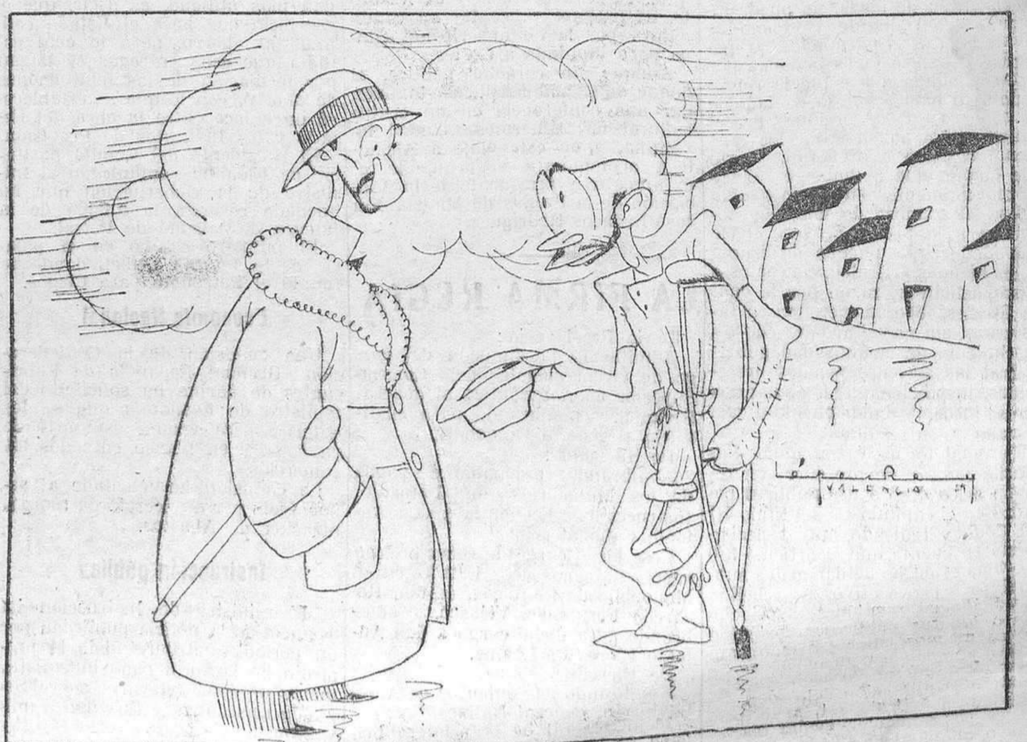
—Una limosna, señor. —¿Una limosna? Más vale que se vaya a mendigar a su pueblo. —¿Cómo sabe que no soy de aquí? —Porque si fuera usted de aquí sabría que no doy jamás limosna a nadie, y no vendría implorándome...