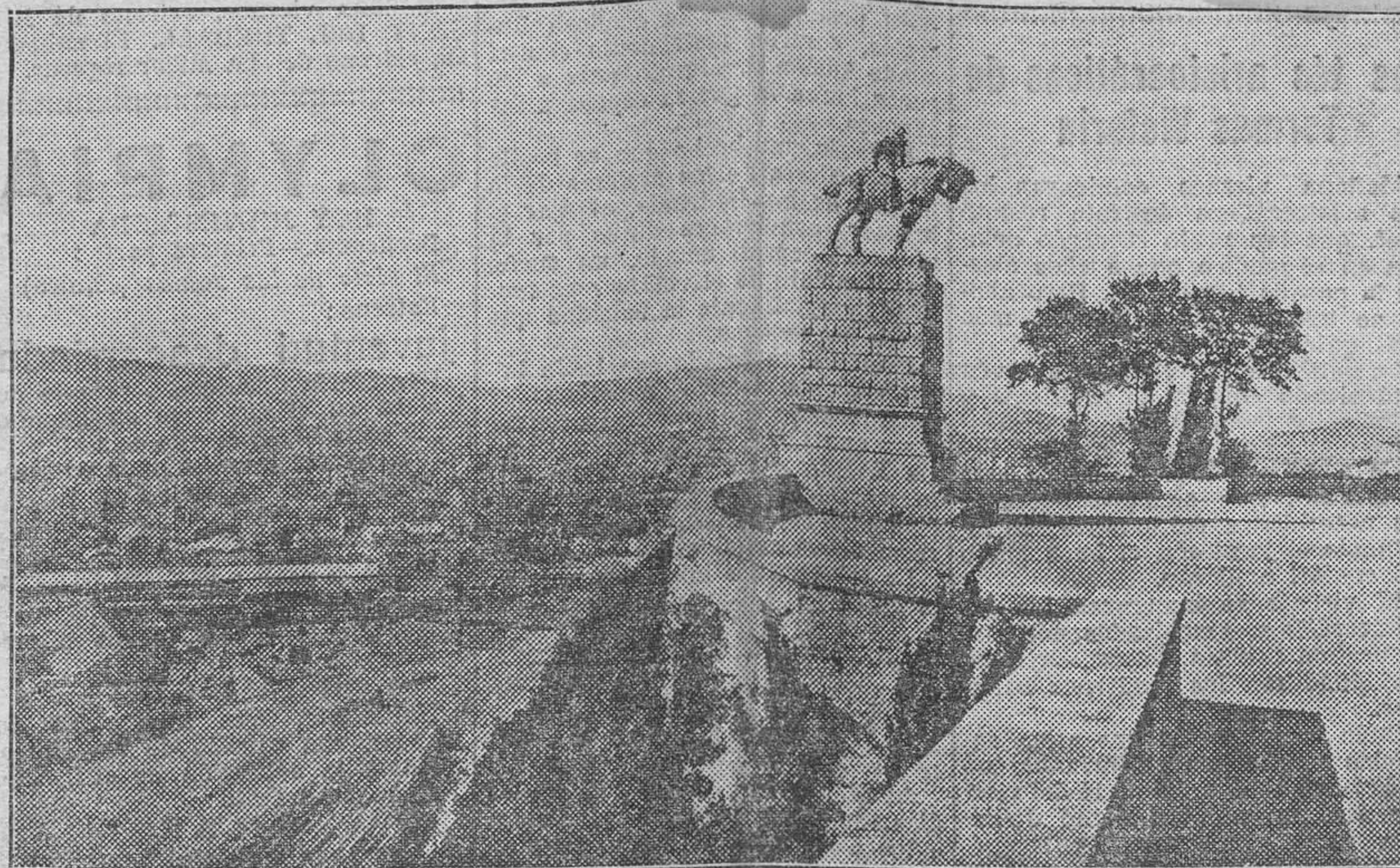
Estatua de San Jorge, en el Parque de Montjuich

dines colgantes, y siguiendo la topografía de la montaña, el mayor atractivo de este Parque consiste en que las perspectivas se renuevan incesantemente y a cada revuelta de sus umbrosos senderos, el espectáculo cambia por completo, ofreciéndose a la admiración del