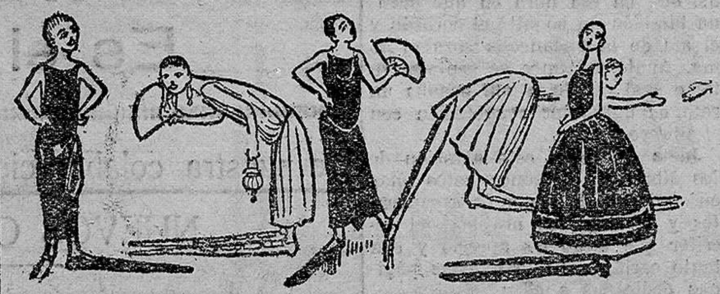
Así es que no fuera imposible ver en los salones elegantes algo como

verdaderamente revolucionaria, pero sin programa preciso, de esta evolución bélica, decimos, hemos llegado a una meta casi precisa.