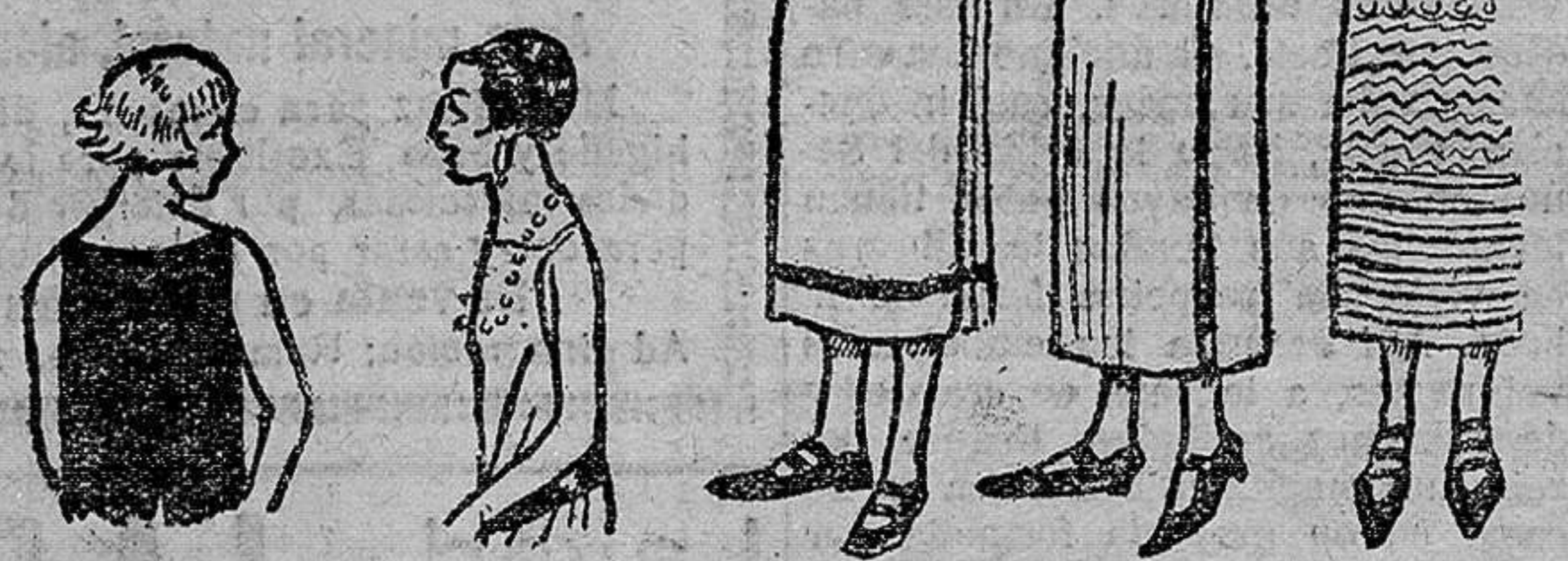
Hoy la moda exige para la cabellera un corte cada vez más corto... y para los zapatos un tamaño siempre más grande.