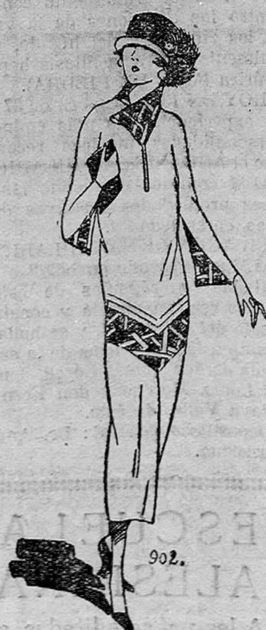
Vestido en popelina azul marino adornado de broderi escocesa.