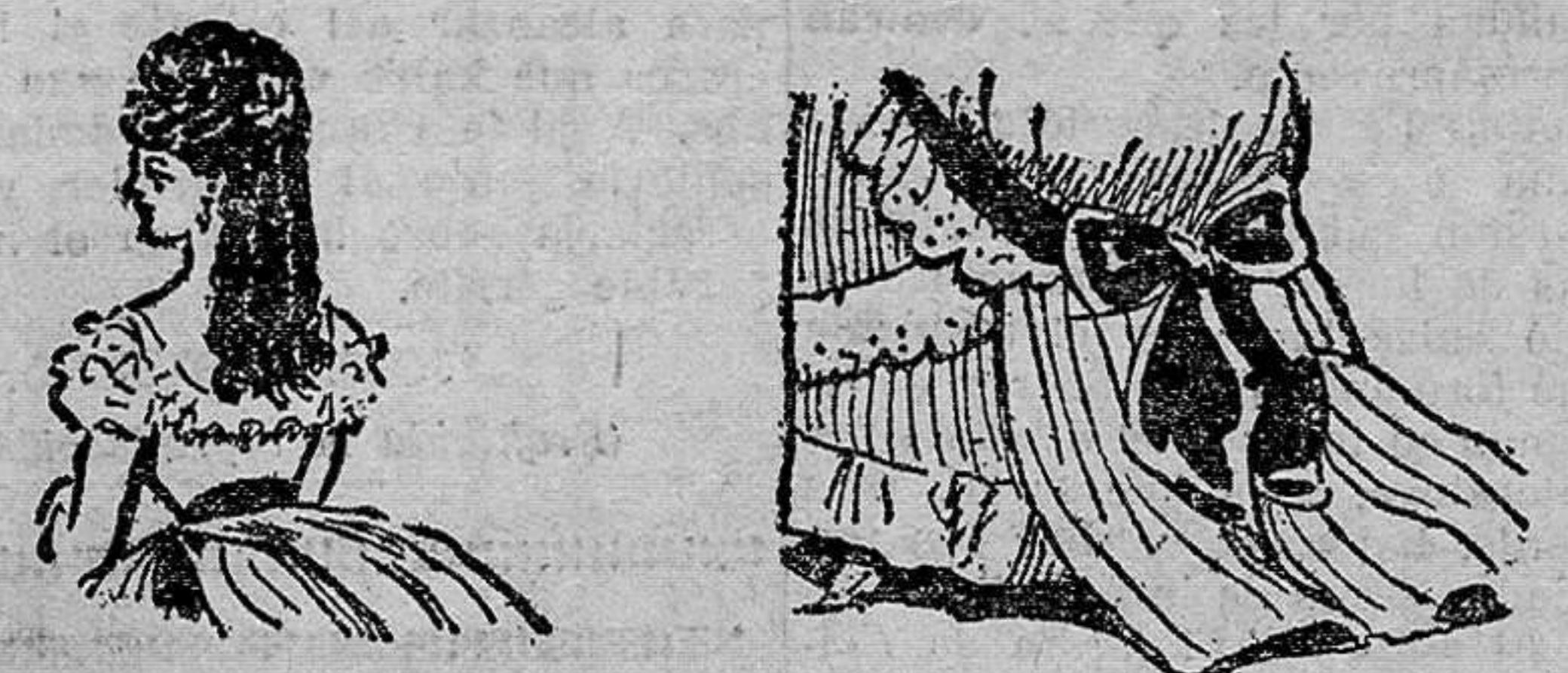
Entonces el mayor orgullo de una mujer era tener una exuberante cabellera... y un pececito de pequeñez inverosímil.