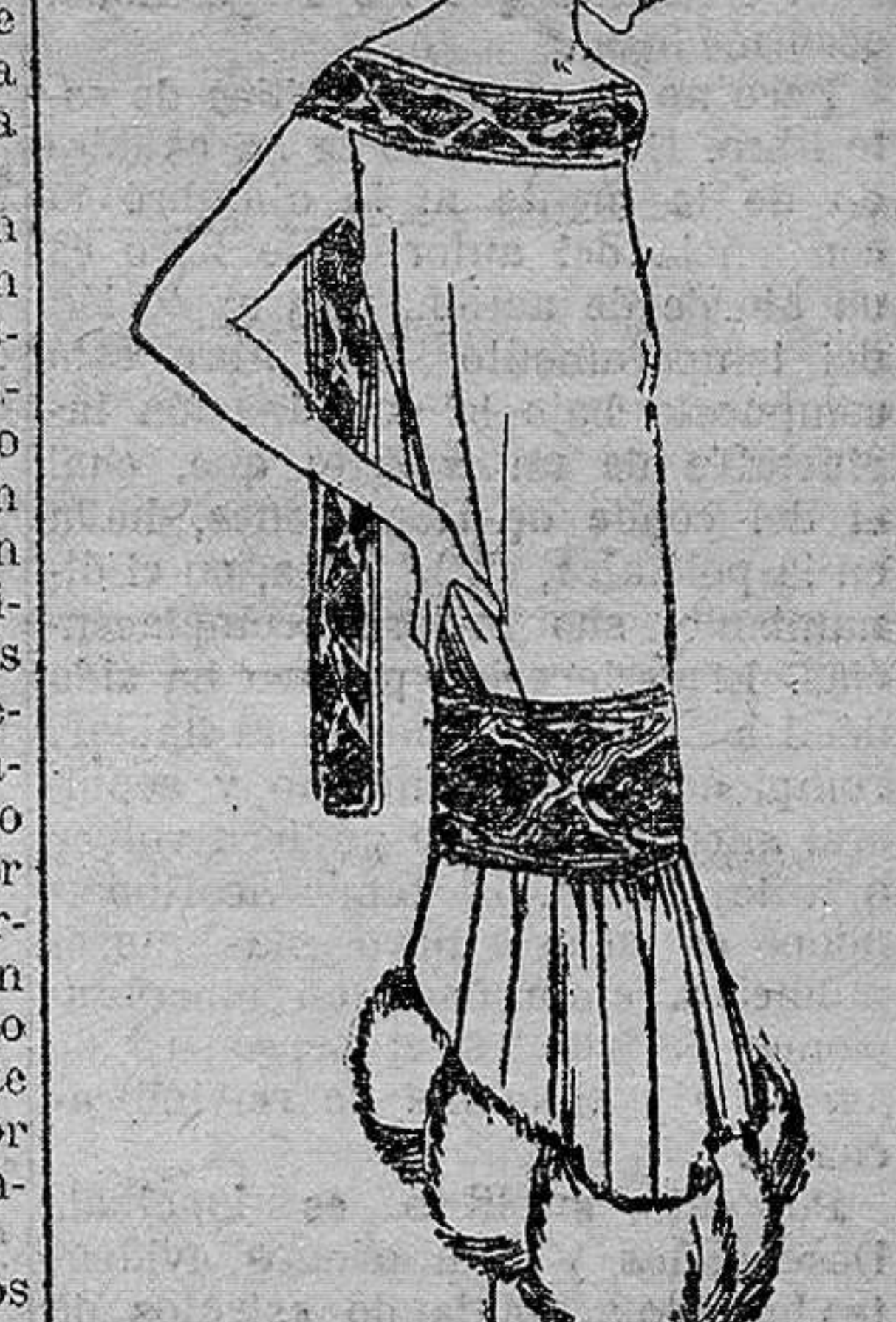
Vestido de crepé georgelle mastico, adornado de bandas bordadas mastico negro y rojo, en el bajo piel de castor.

Por el pasillo central de la sala de butacas iban y venían los orga-