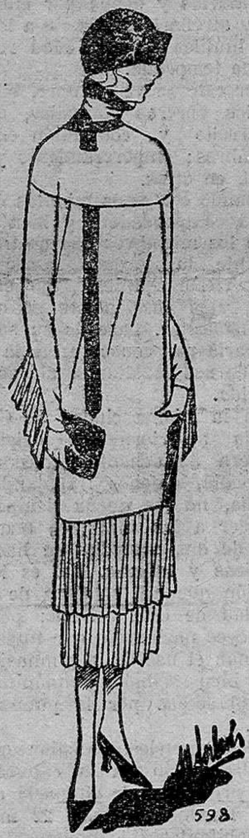
Vestido de garga azul marino, adornado de bandas de piel roja.

La correspondencia a mi nombre, LAS PROVINCIAS, apartado número 139