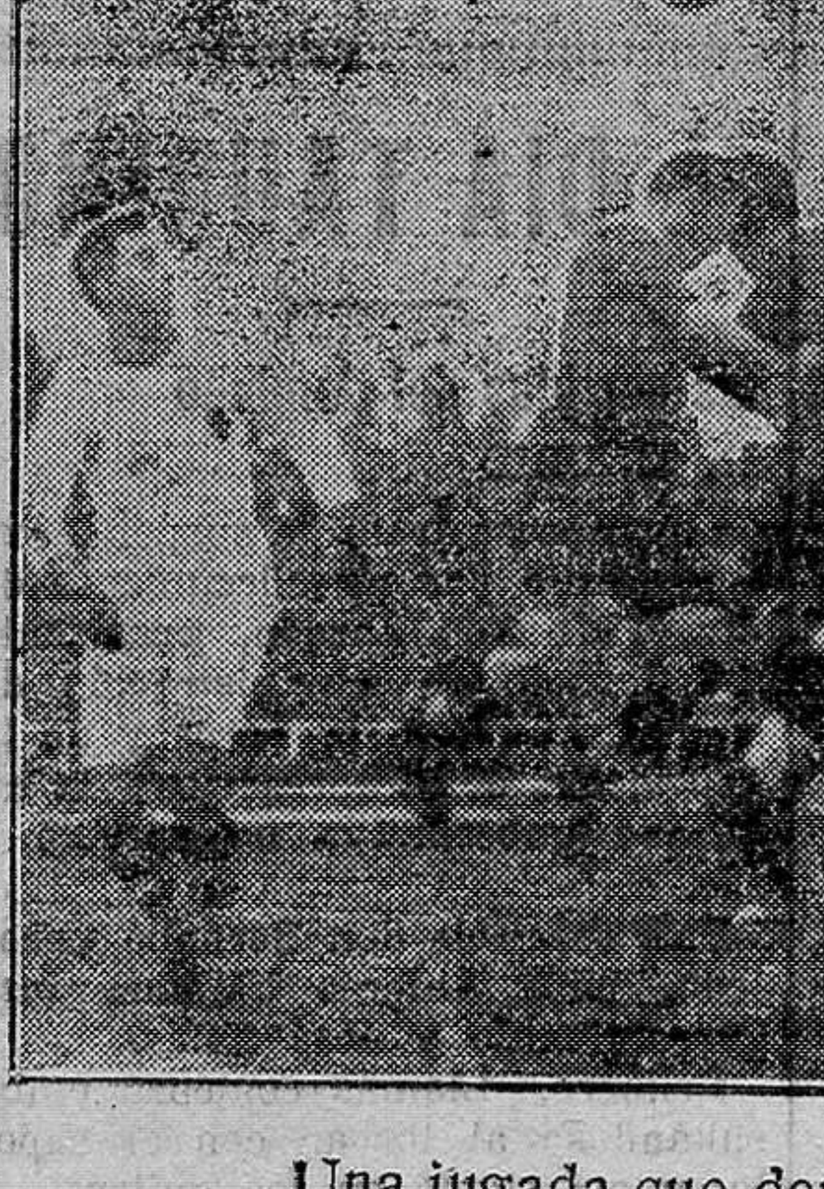
Una jugada que demuestra la codicia con que jugó el Gimnástico