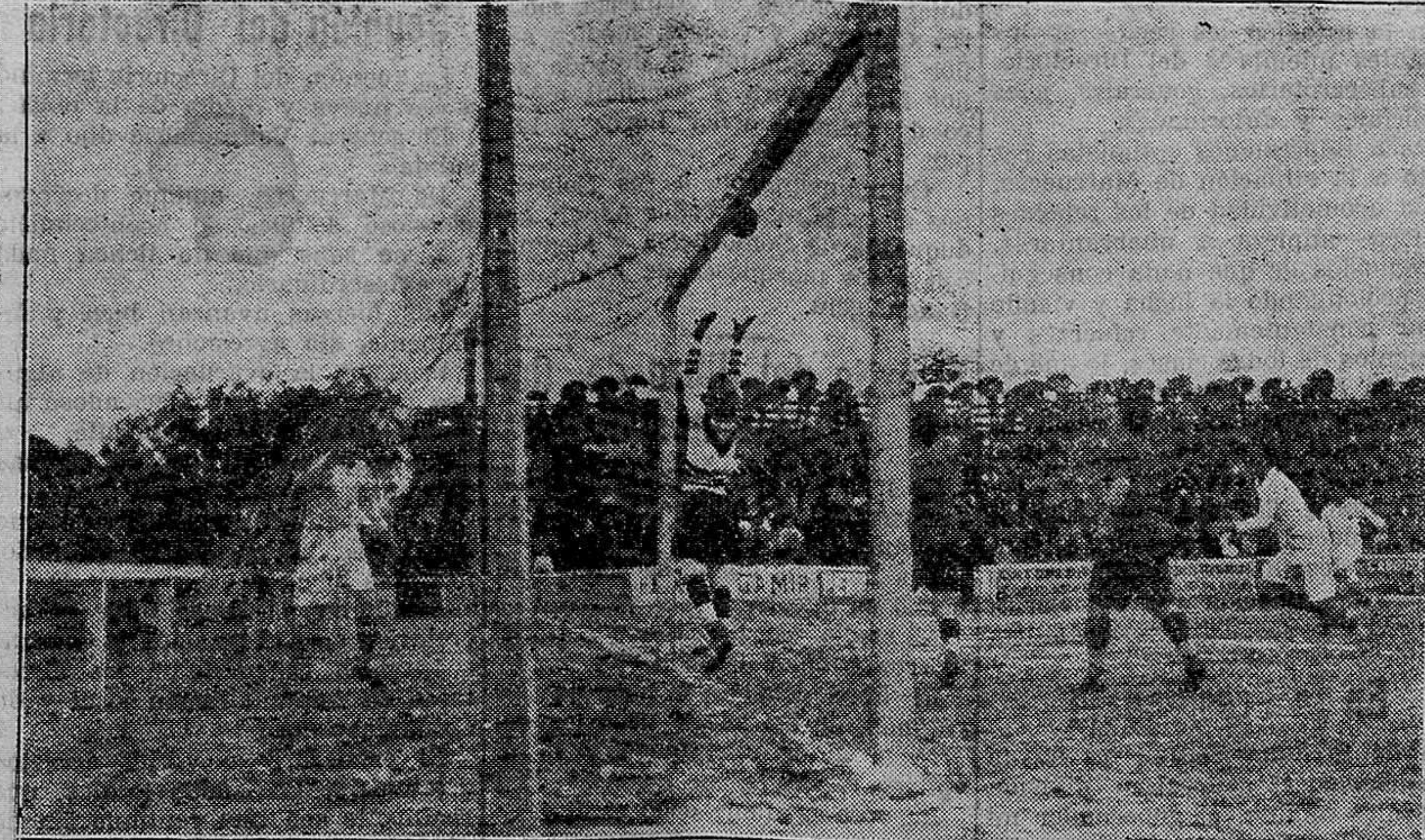
Un momento de peligro para la puerta del Gimnástico