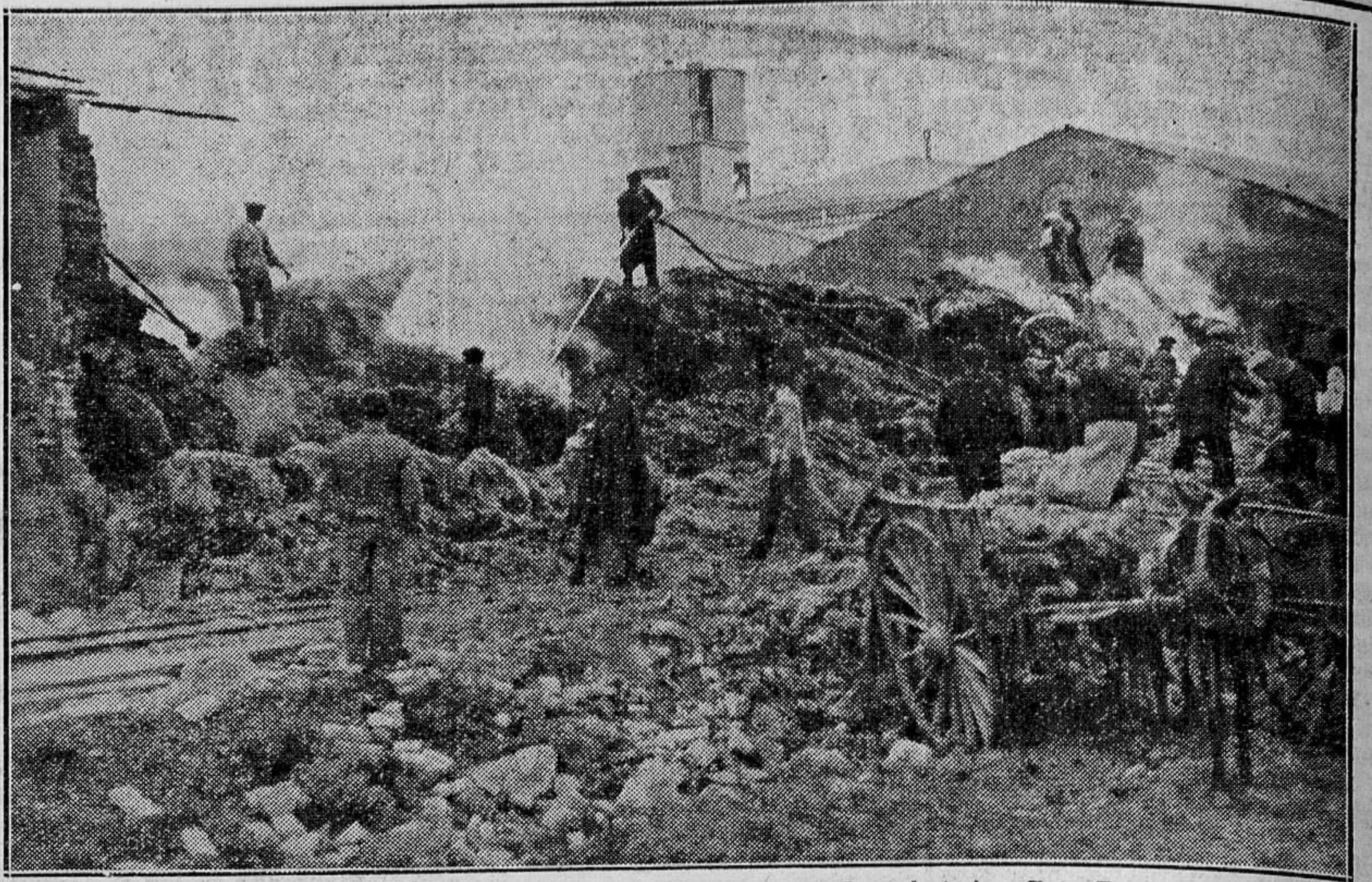
El incendio de la Yutera de Foyos, producido por un acto de sabotaje.