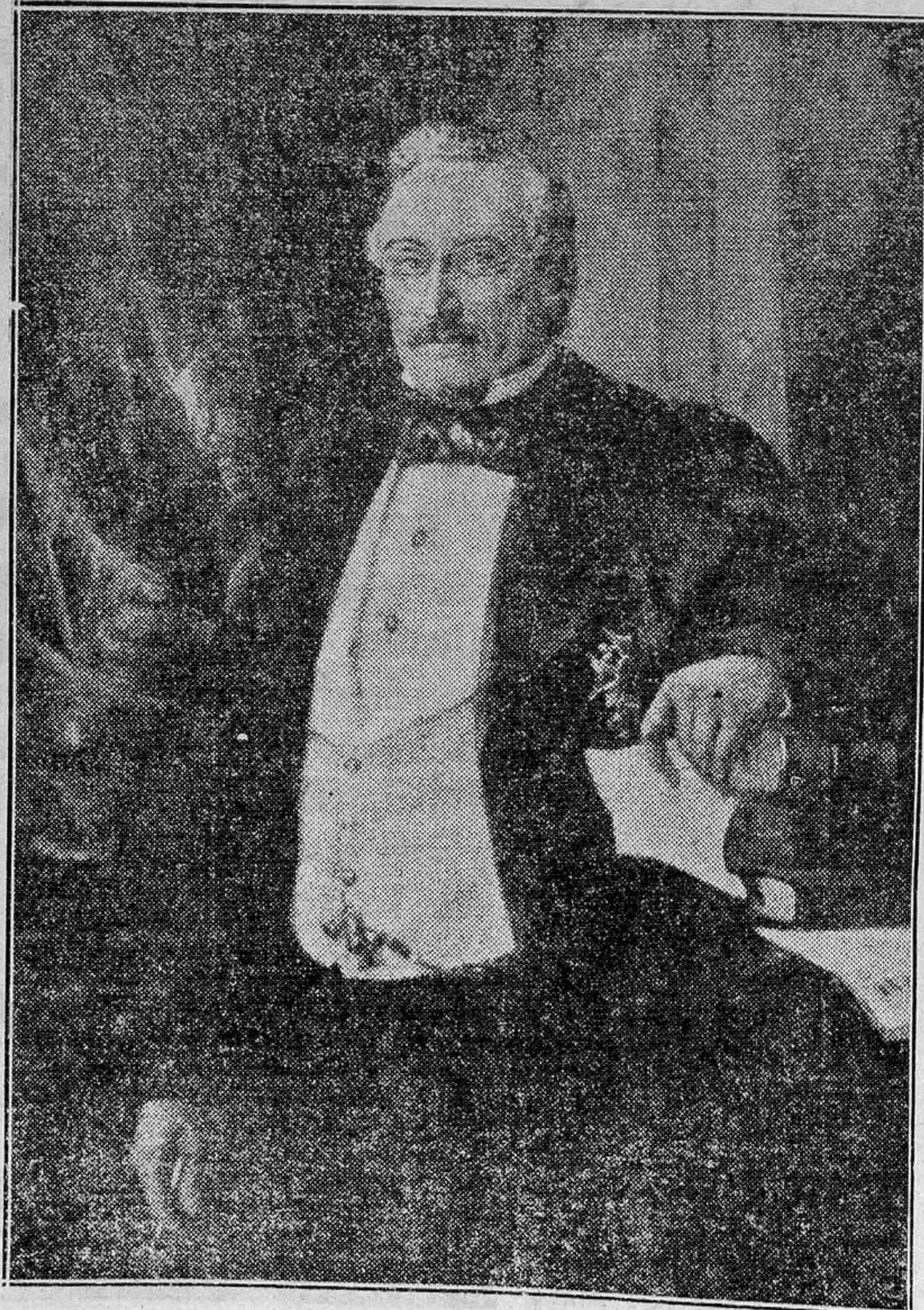
Don Buenaventura Carlos Aribau