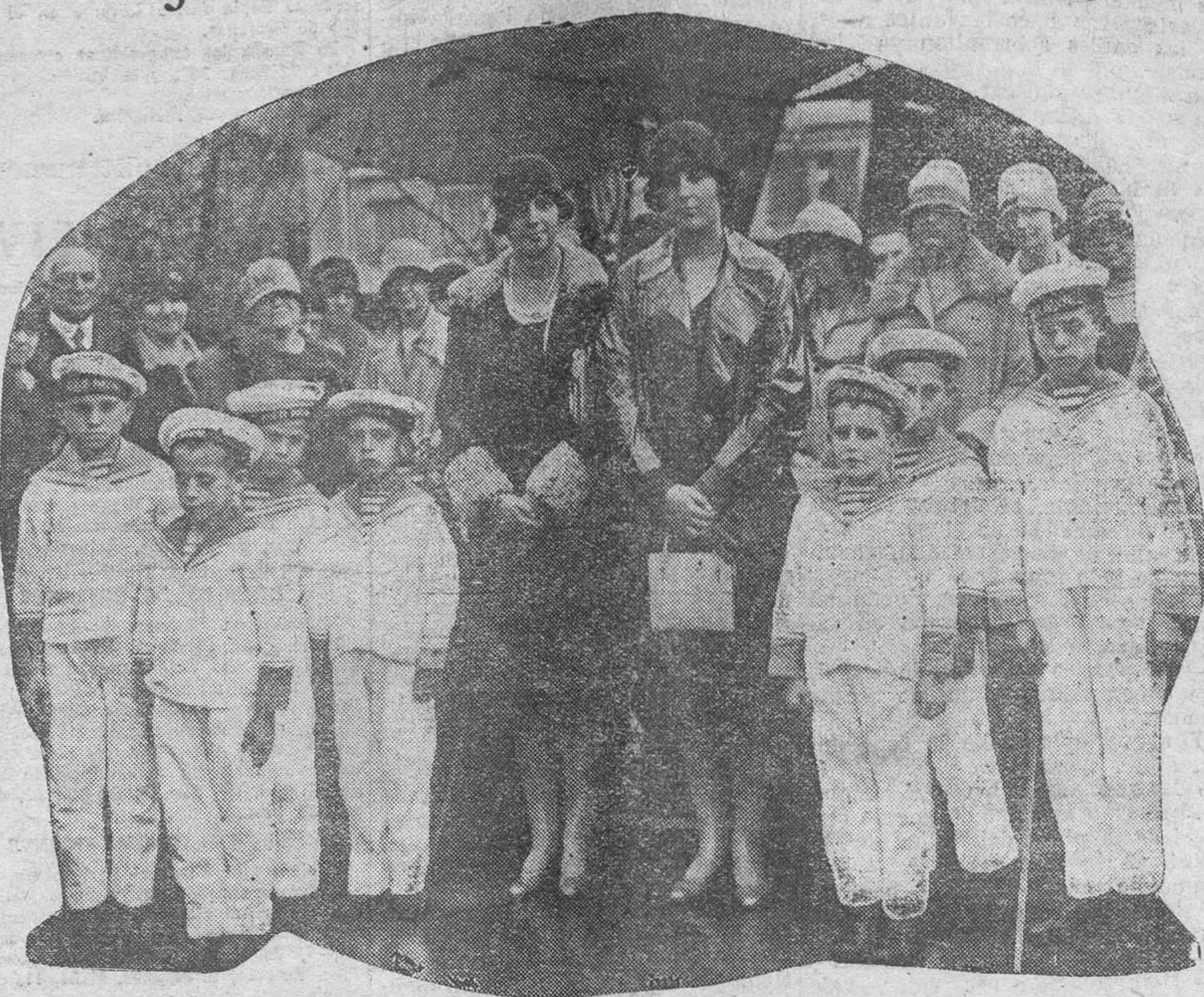
SS. AA. las Infantas Maria, Cristina y Beatriz en el buque-asilo de niños de marinos.