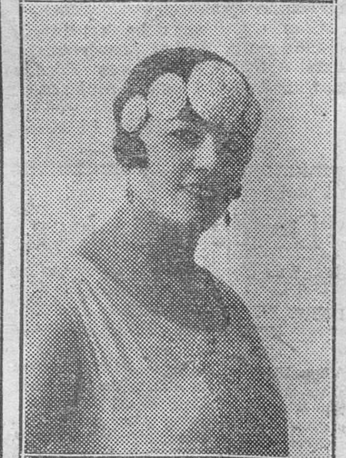
do no pisa las tablas se olvida de la ironía para tomar todas las cosas absolutamente en serio.

Recientemente París ha celebrado el 25 aniversario de la muerte de Emilio Zola, no sólo con la consabida abundancia de literatura, tan peculiar del país vecino, sino inclusive con su pequeña marejada de tendencia política. No importa que el autor de los «Rougon Macquart» sea, en las letras contemporáneas, un cadáver sobre cuyos despojos, conservados en el Panteón de Hombres Ilustres, cayó hace tiempo el olvido cuando no el desdén. Los franceses han «resucitado» a Zola, el llamado «cerdo romántico», para enaltecer su memoria, nimbando su nombre otra vez, reeditar sus obras completas, y comunicar una especie de fragancia a esta flor de trapo que en la época de su lozanía exhalaba, a juicio de muchos, más tufo y hedor que aroma y salud. Sin entrar aquí en una revisión crítica que no ha dejado de efectuarse allende el Pirineo, el caso digno de comentario es que Francia, siempre atenta a airear sus glorias y sus hijos, no ha querido dejar sumido en el silencio un aniversario más. Nunca se olvida de aquellos que le honraron, o simplemente la estreñecieron. Hoy mismo, a pesar de los muchos años transcurridos y de la grafarrea que engendrarán, todavía se sigue hablando de María Antonieta, la Reina mártir; de Napoleón, el coloso; de Juana de Arco, la redentora, y de otras figuras más o menos conocidas en los dominios del arte, de la religión y de la historia.