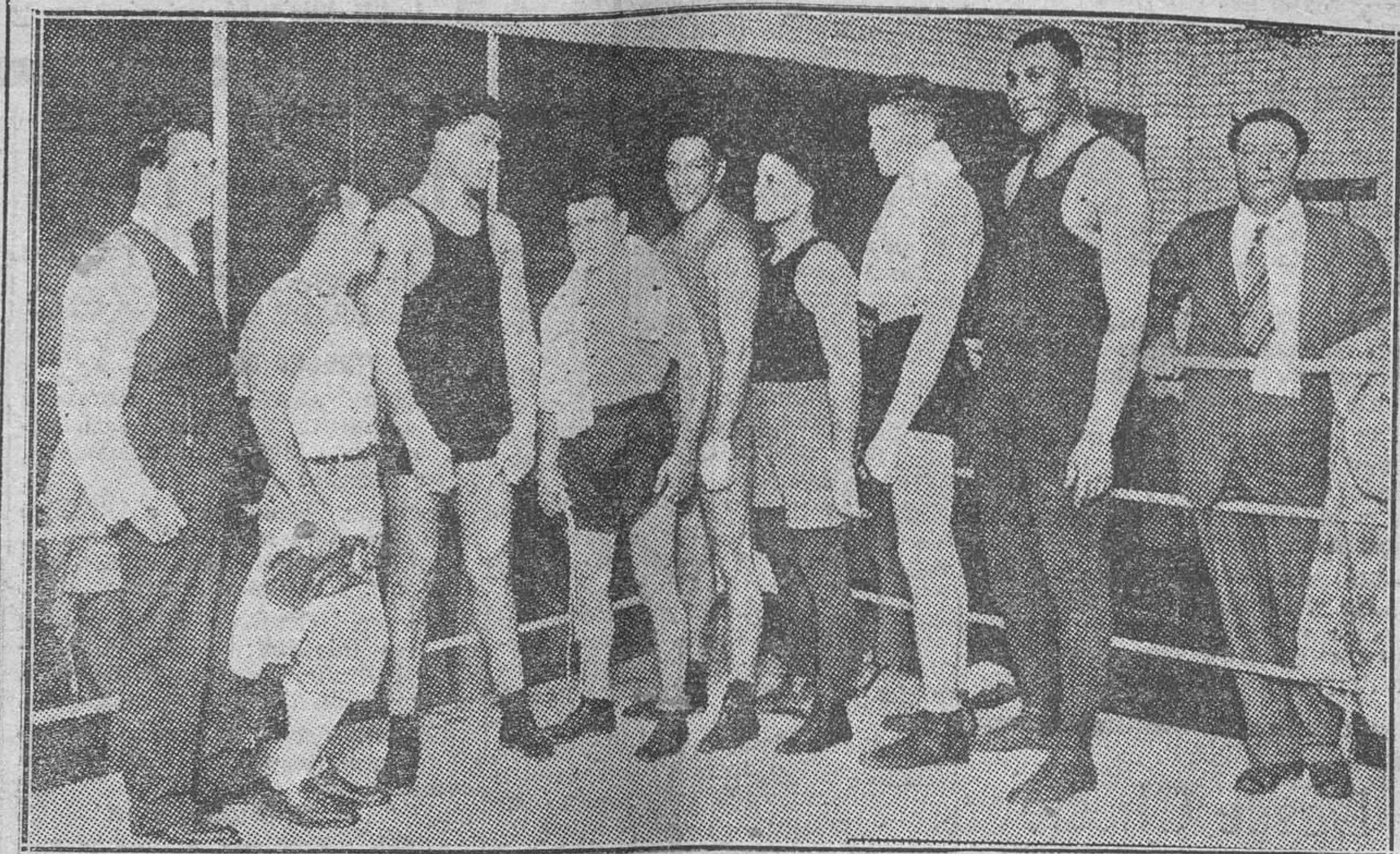
La preparación de Dempsey para su match contra Tunney.—Jack, con sus auxiliares en uno de los entrenamientos.