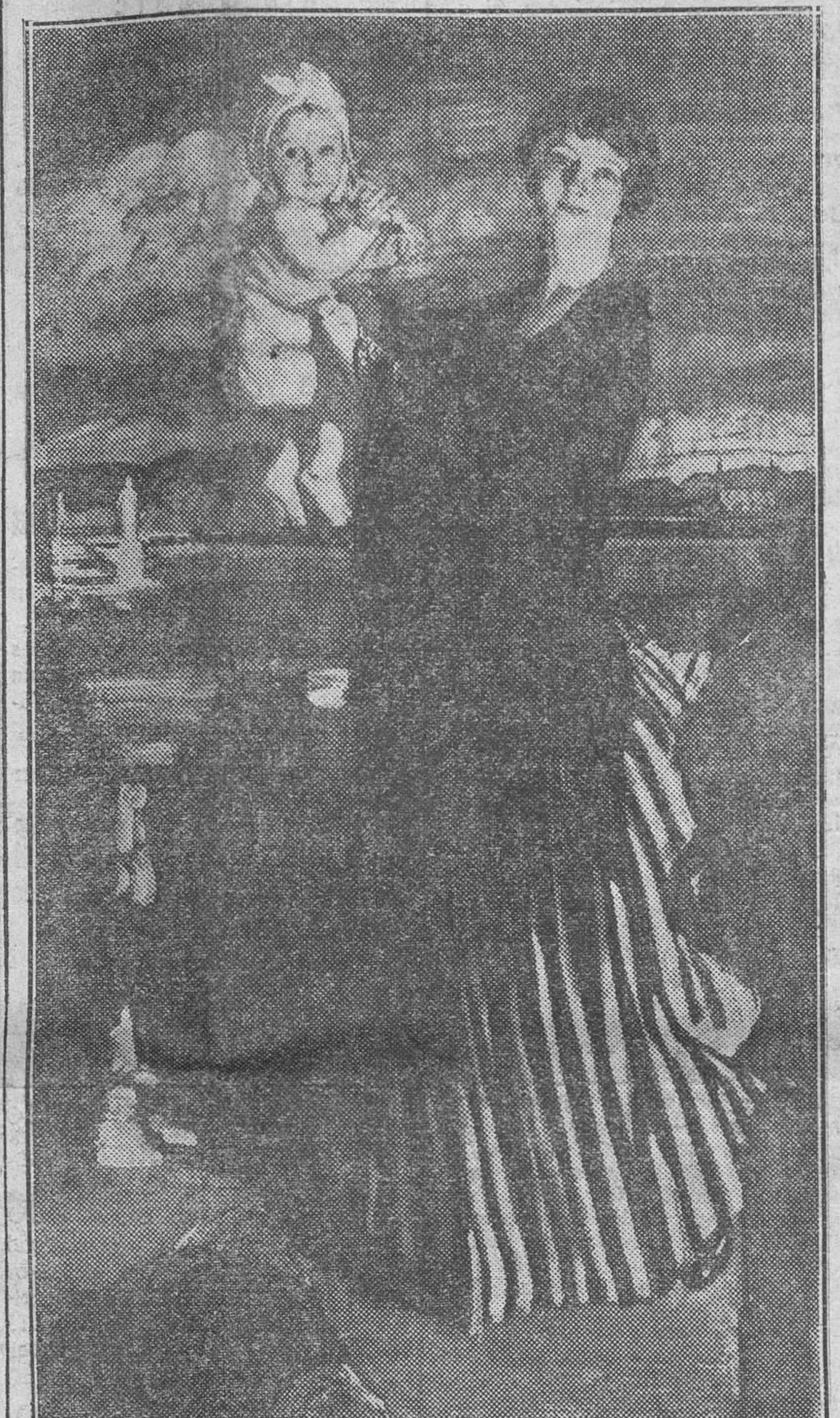
«Retrato de mi mujer y de mi hija», cuadro de Ortiz Echagüe, que figurará en la próxima Exposición Internacional de Pittsburg (E. U.)

En las postrimerías de la temporada artística, y como si quisieran dejarnos agradable regusto de lo que ella fue, algunos pintores esclarecidos nos ofrecen sendas Exposiciones de sus obras. A la muy brillante y sugestiva de Manuel Benedito—por la que ya desfilado con deleite todo Madrid,—sucede la de