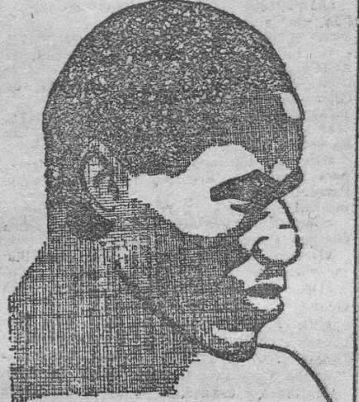
HARRY WILLS La Pantera negra

De vencer Uzcudun, como todo lo hace presumible, no habrá adelantado ninguna paso en su carrera, porque para los americanos Harry es cosa ya pasada. Si contra toda lógica sucumbiera, habría derribado su castillo de alfileres—para los americanos—y tendría que volverse con más o menos plata, pero con la mala. El mismo caso de Wills, eterno retador de Dempsey, es demostración de que la teoría de Monroe tiene su aplicación en el boxeo. No pudo habérselas nunca la Pantera Negra con el campeón del mundo, y tuvo que limitarse a vegetar hasta que un buen día tropizó con Sharkey, que acabó de quitarle