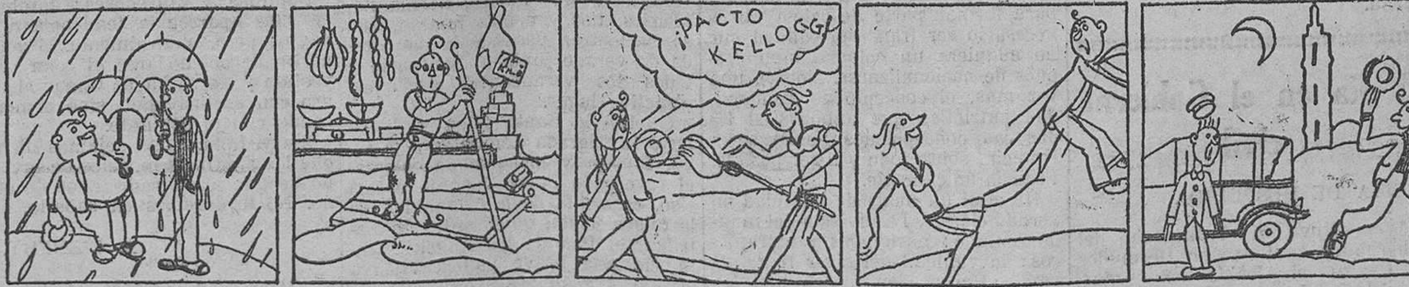
— ¡Ya ha llovido! Ya ha llovido! — Esto su música tiene... «Bogando las aguas viene...» — La Ruth Elder, al marido... — Y bien se puede observar de estos vuelos se ha salido... — A esta tuna se ha quedado por ser tan reconfortado.