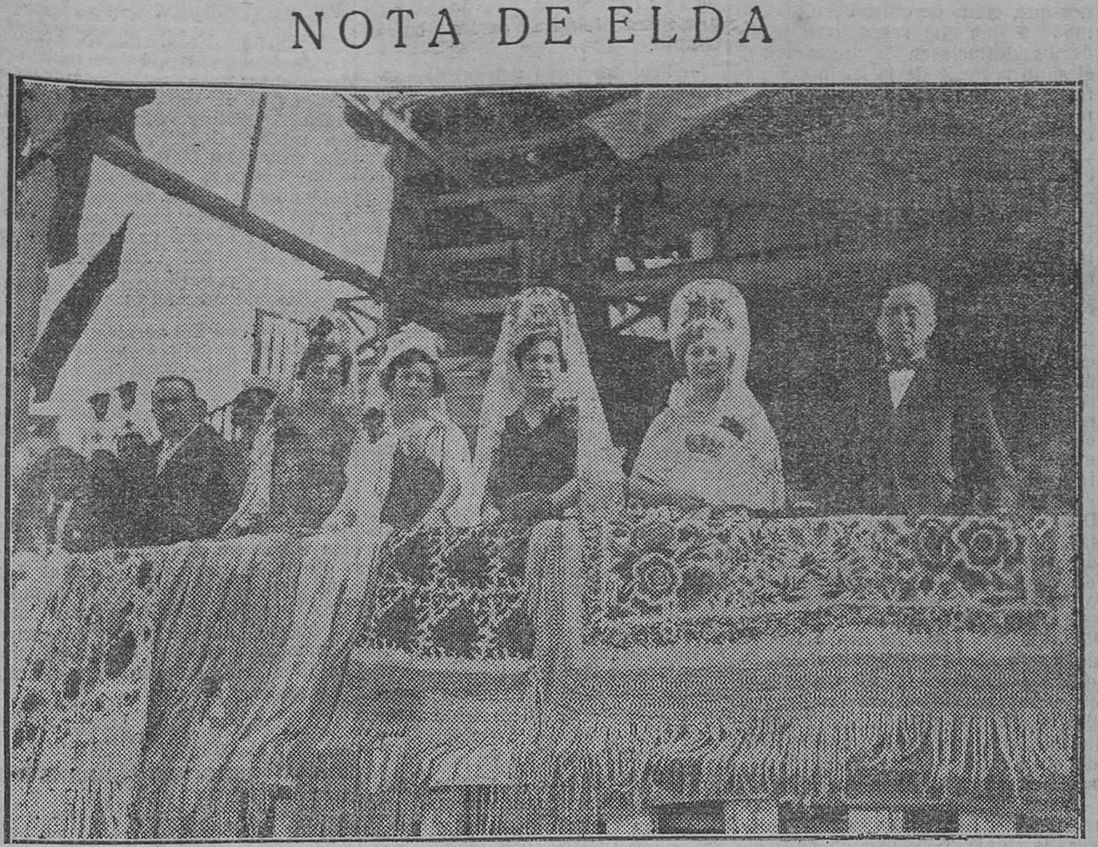
Bellísimas señoritas que presidieron la becerrada que a beneficio de la Cruz Roja se celebró el pasado domingo