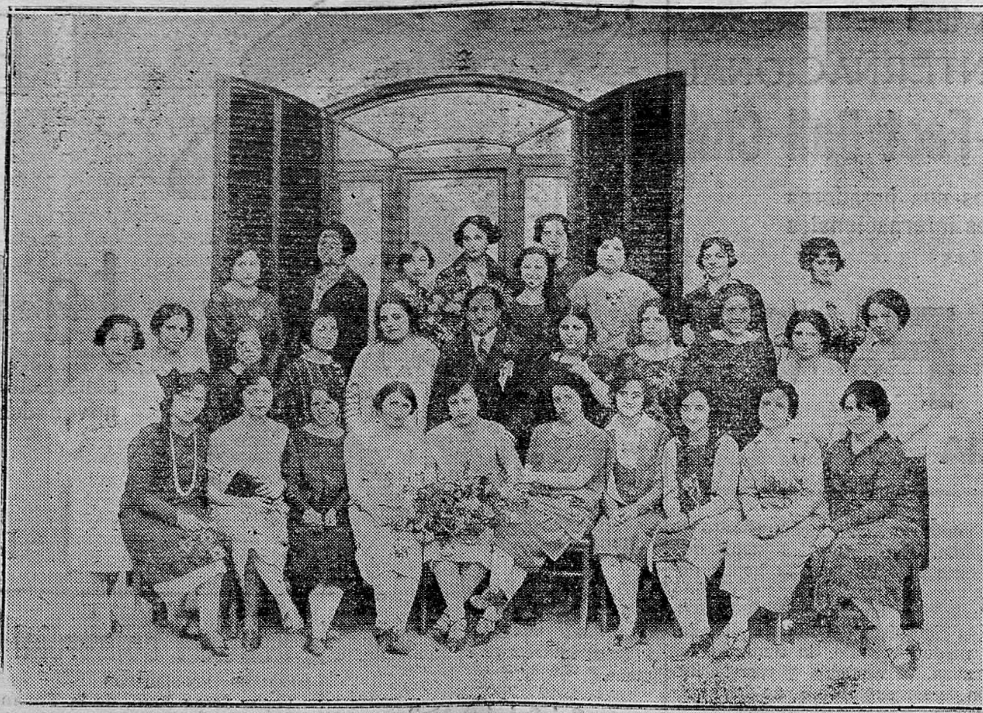
Grupo de distinguidas señoritas alcireñas y carcagénitas, rodeando al eminente divo