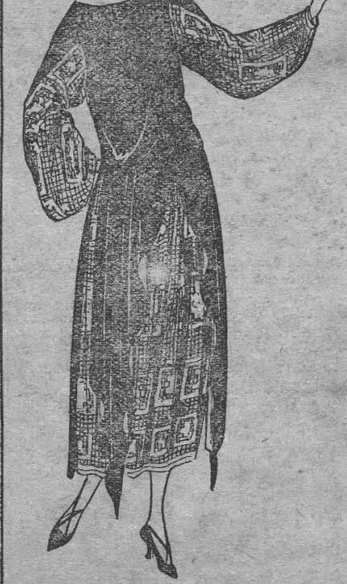
Traje de terciopelo negro, combinado en filetes de igual color, bordado en blanco.

Martita inclinóse para subir un poco el embozo, y él, enérgico, creyendo que ella quería ver su brazo