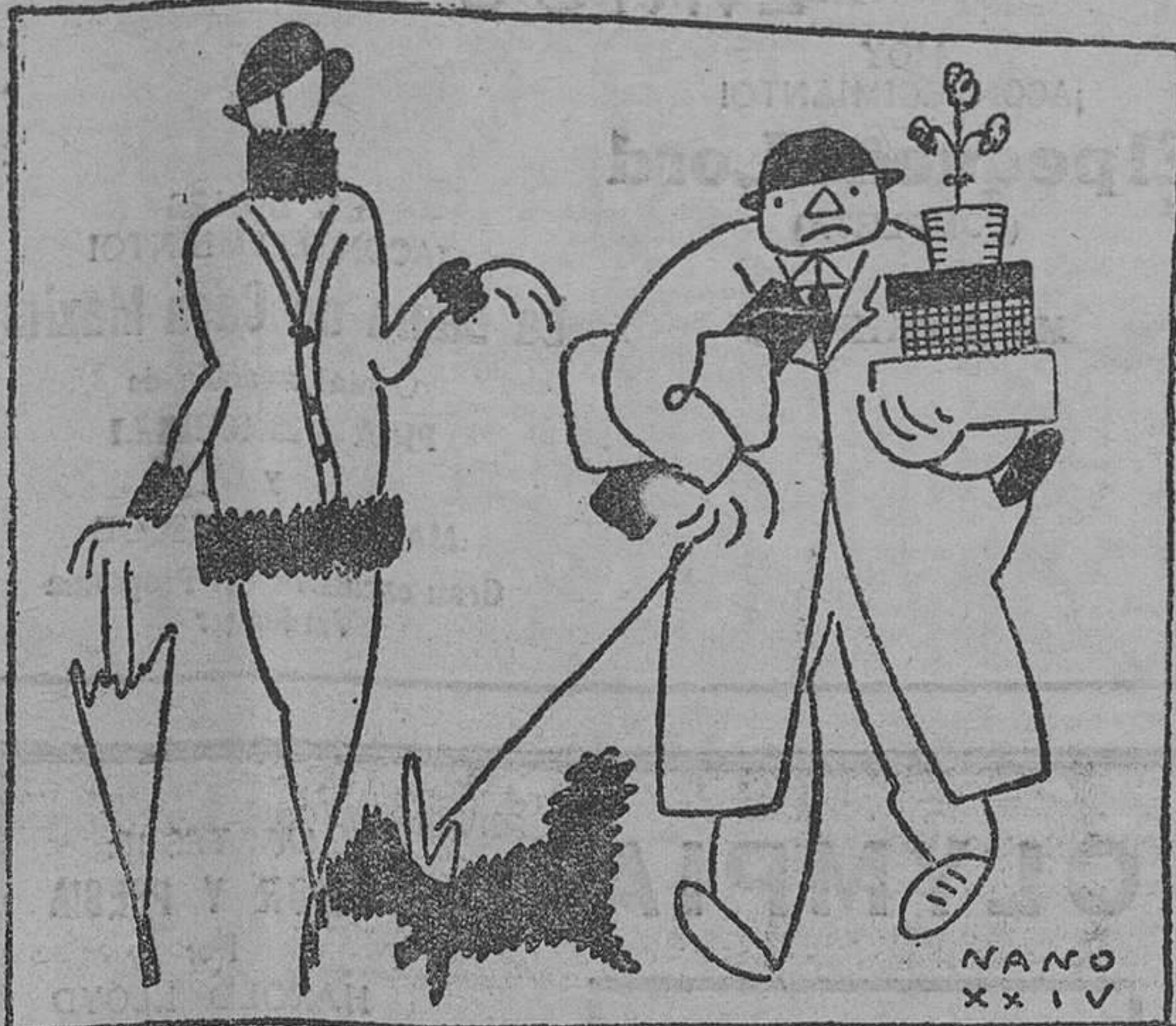
—Vas muy cargado. Yo llevaré el perro