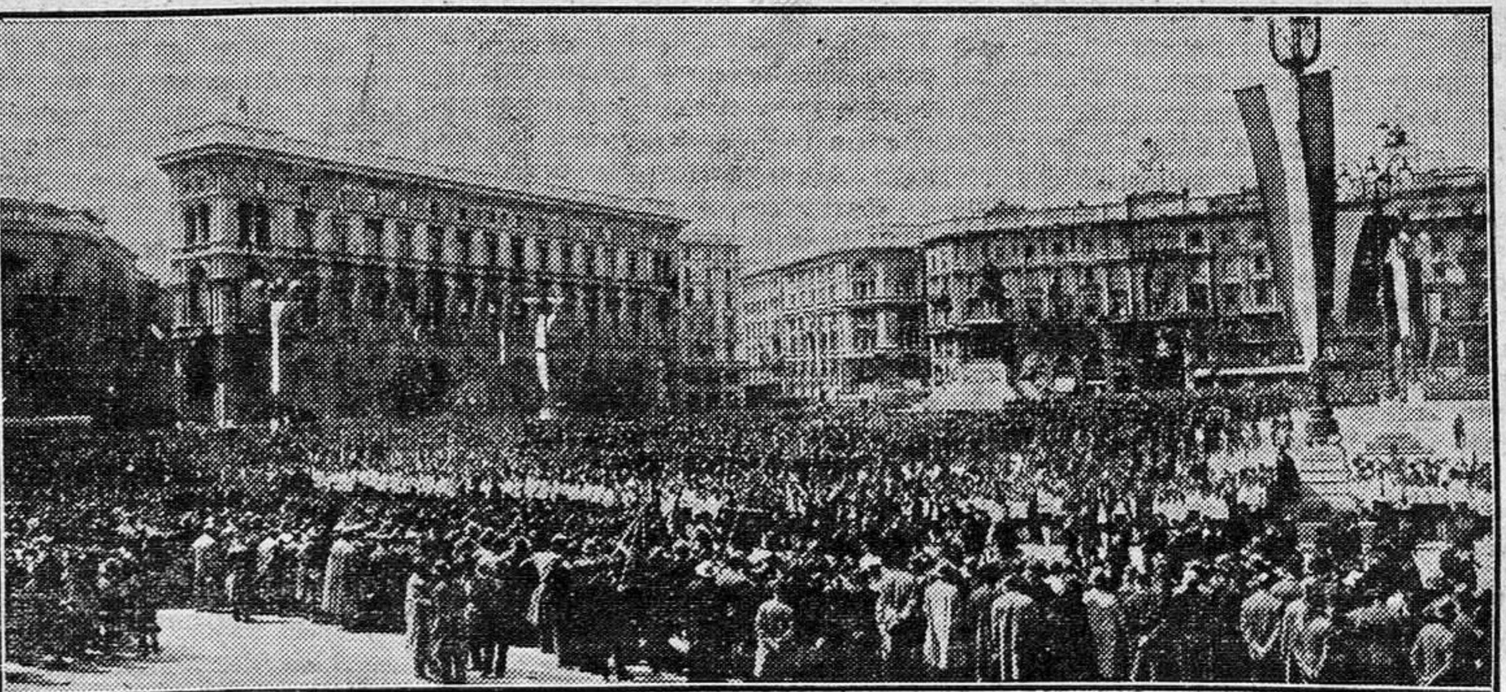
Representantes de diferentes entidades que han organizado la importante Asamblea Económico Agraria, celebrada en el teatro de la Comedia, de Madrid. Roma.—En toda Italia se celebró el día 21 el aniversario de la fundación de Roma. Mussolini ha abolido la fiesta del primero de Mayo, sustituyéndola por la mencionada del 21. He aquí un aspecto de la plaza del Duomo, durante el desfile de 40.000 jóvenes fascistas.