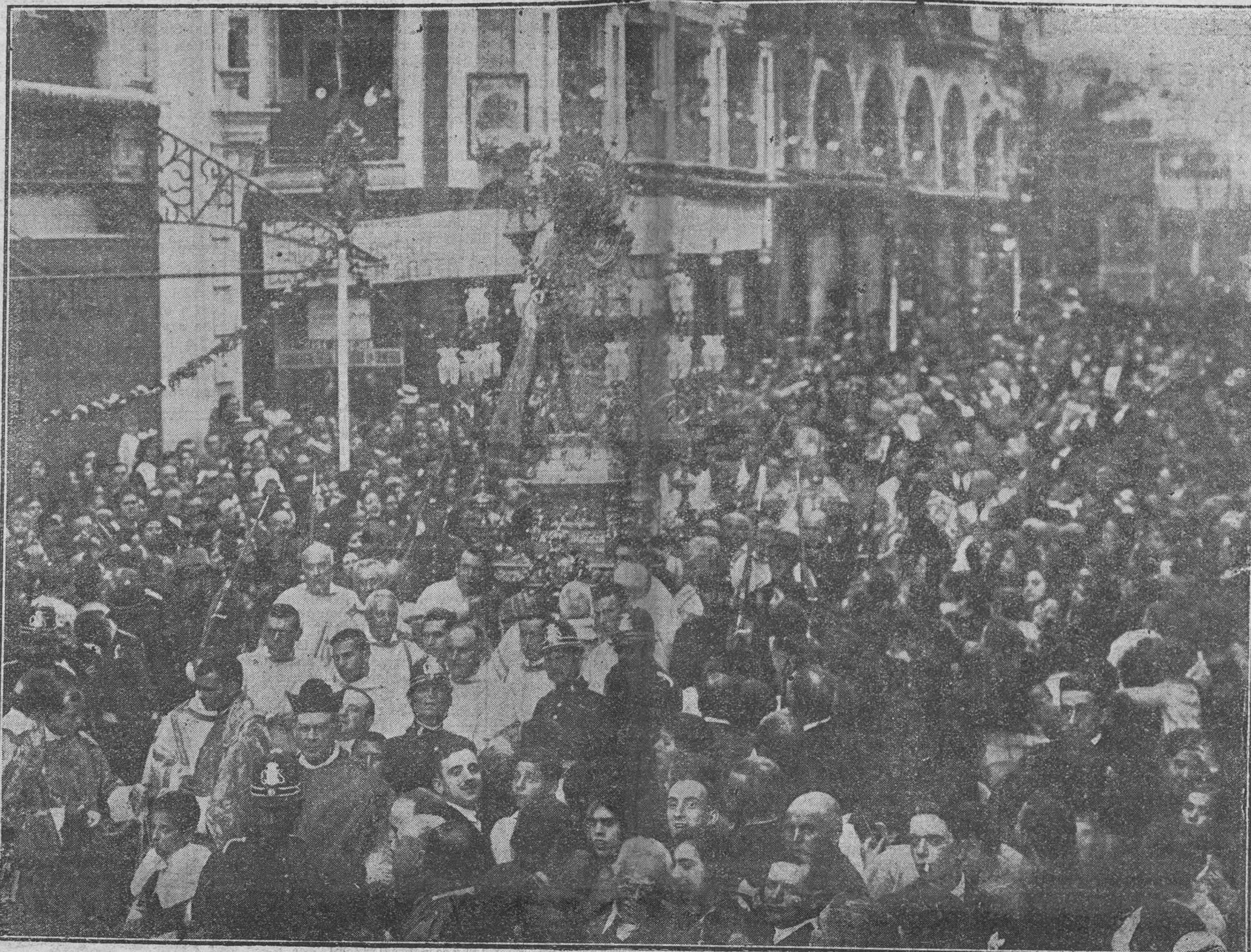
La Imagen de la Virgen de los Desamparados es reintegrada a su Capilla, entre las aclamaciones del pueblo