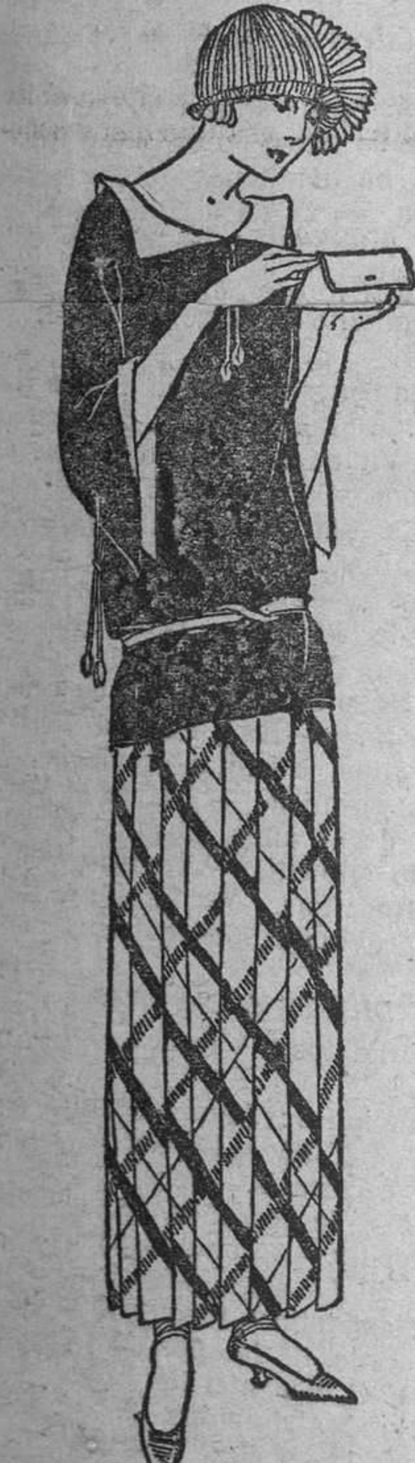
Modelo de Rodier, combinación de dravela azul marino y Rasha. De este último género se confecciona la falda a pliegues planos.

Un curioso y original concurso de labor de aguja (ganchillo) se ha celebrado recientemente en Atlantic City. Veintidós señoras y un caballero se pusieron frente a frente, dispuestos a medir sus fuerzas. Entre los concurrentes no faltó una valiente anciana de ochenta y ocho años, que quiso demostrar que, a pesar de su vejez, aun se sentía fuerte: la más joven era una niña de doce años. El competidor masculino era un antiguo combatiente de la gran guerra, herido en el campo de batalla en Arjona, y que había aprendido a hacer labor de ganchillo durante su estancia en un hospital parisiense. El hombre se declaró vencedor después de quince horas de trabajo continuado. Las mujeres todas siguieron animadas, pensando cada una de ellas en ser la ganadora del campeonato; pero cinco horas más tarde (a las veinte de haber comenzado el concurso), algunas se vieron abandonadas por las fuerzas y comenzaron las defecciones, más numerosas cada vez, a medida que el tiempo avanzaba. A las veintitrés horas justas de trabajo no interrumpido, solo quedaban tres disputándose la victoria. Sus criadas respectivas les hacían ingerir alimentos para sostenerlas y neutralizar el desgaste nervioso, mientras un gramófono desgranaba las rotas brillantes y alegres de varios aires populares. Terminado el concurso, se dió una nota simpatísima y ejemplar. Los vestidos de punto de lana que se confeccionaron durante el match fueron regalados y distribuidos entre los pobres del pueblo.