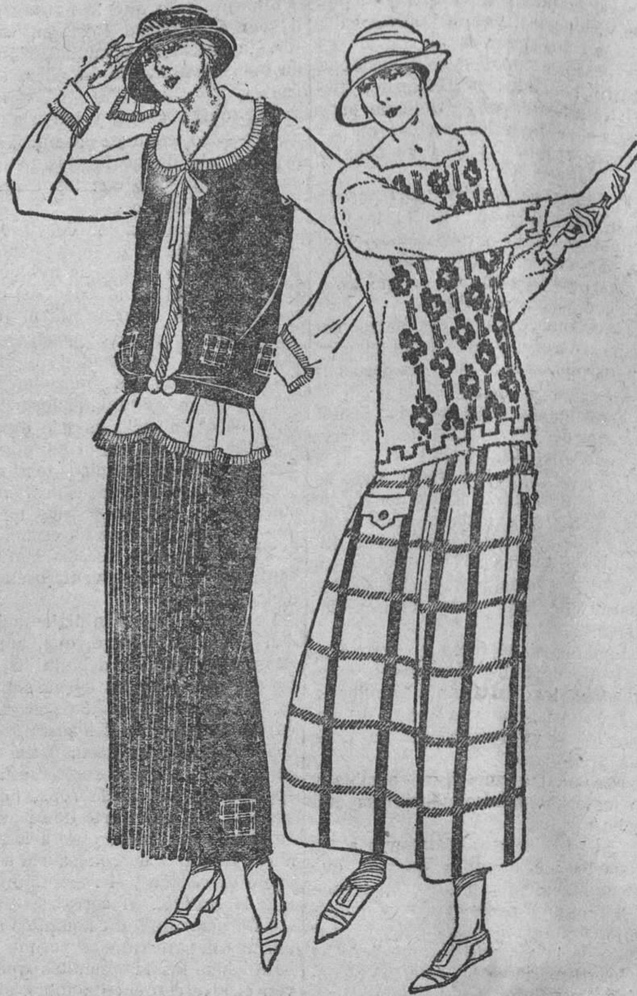
PRIMER MODELO.—Blusón y falda en sarga marina, el primero deja entrever una blusita de crepón de China, marfil, adornada de ruches del mismo. La segunda, plisada en las tablas delanteras y bordada de motivos, como el cuerpo, en sedas vitas.

Veréis también mucho género esdrújolo, de grandes cuadros, formados por rayas de anchura media: verdes, azules, amarillos, marrón y negras en su mayoría, sobre fondos claros.