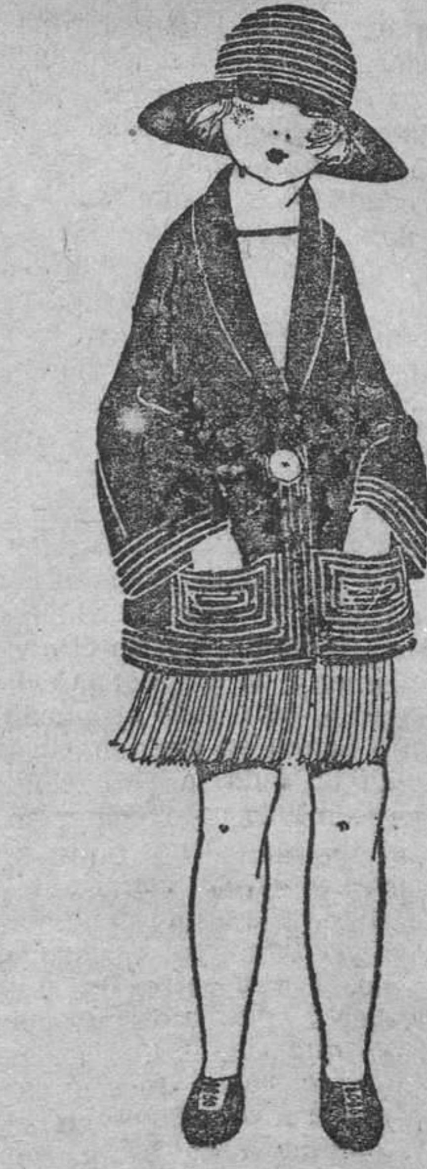
Trajecito de lanilla, verde almendra, de falda plisada, sobre el que se viste un abrigo de pañete marino bordado de soulaches.

Digo esto para justificar la existencia de este consultorio, que muchos quizá lo tomen como cosa trivial de pasatiempo, ligera, y que debieran abrir todos los periódicos, destiéndole un espacio diariamente. Sería una obra muy hermosa, muy humana y además un merecido homenaje a ustedes las mujeres, en constante indefensión, obligadas a una mudé y a un recato injustos y contraproducentes. ¿Contar sus penas a la familia? ¿Descubrir sus corazones a los amigos, a las amigas? ¿Hablar de querer al con-