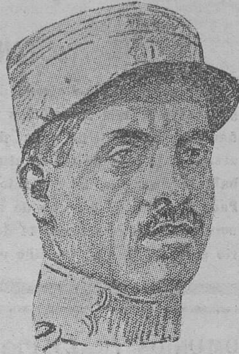
El presidente de la República del Perú, señor Sánchez del Cerro, asesinado recientemente