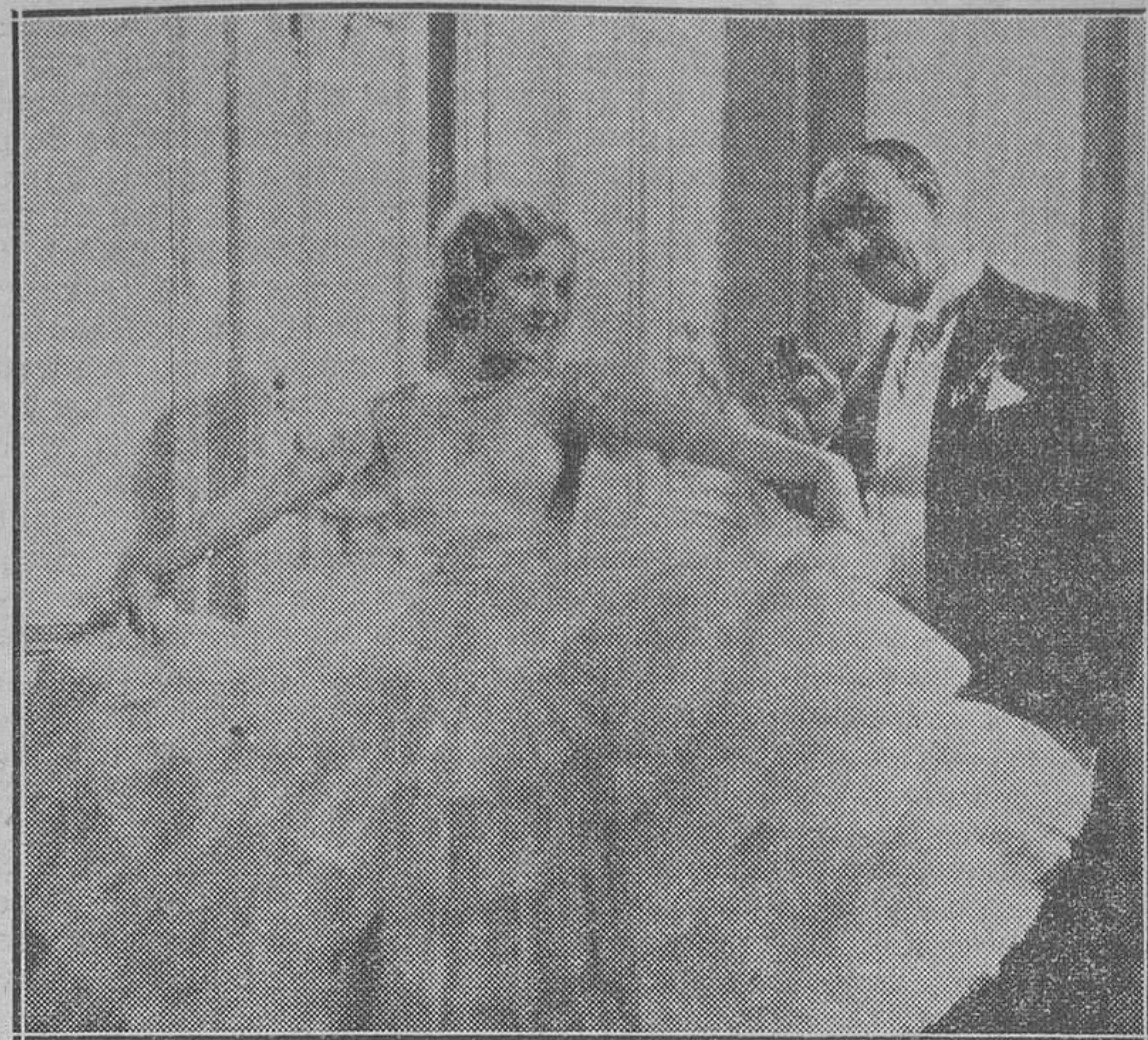
Marta Egerth, la bellísima estrella europea que en "La Princesa se divierte", realiza la más admirable y completa de sus creaciones