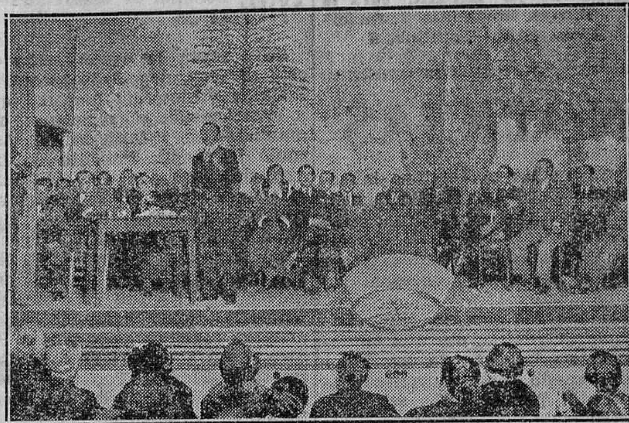
Conferencia del diputado agrario Lamamié de Clairac, en la Casa de Obreros, de Valencia, organizada por la Juventud Legitimista

ca, a no ser que el señor Prieto persista en su programa intervencionista iniciado en el Banco de España con la aprobación del proyecto de Ordenación bancaria.