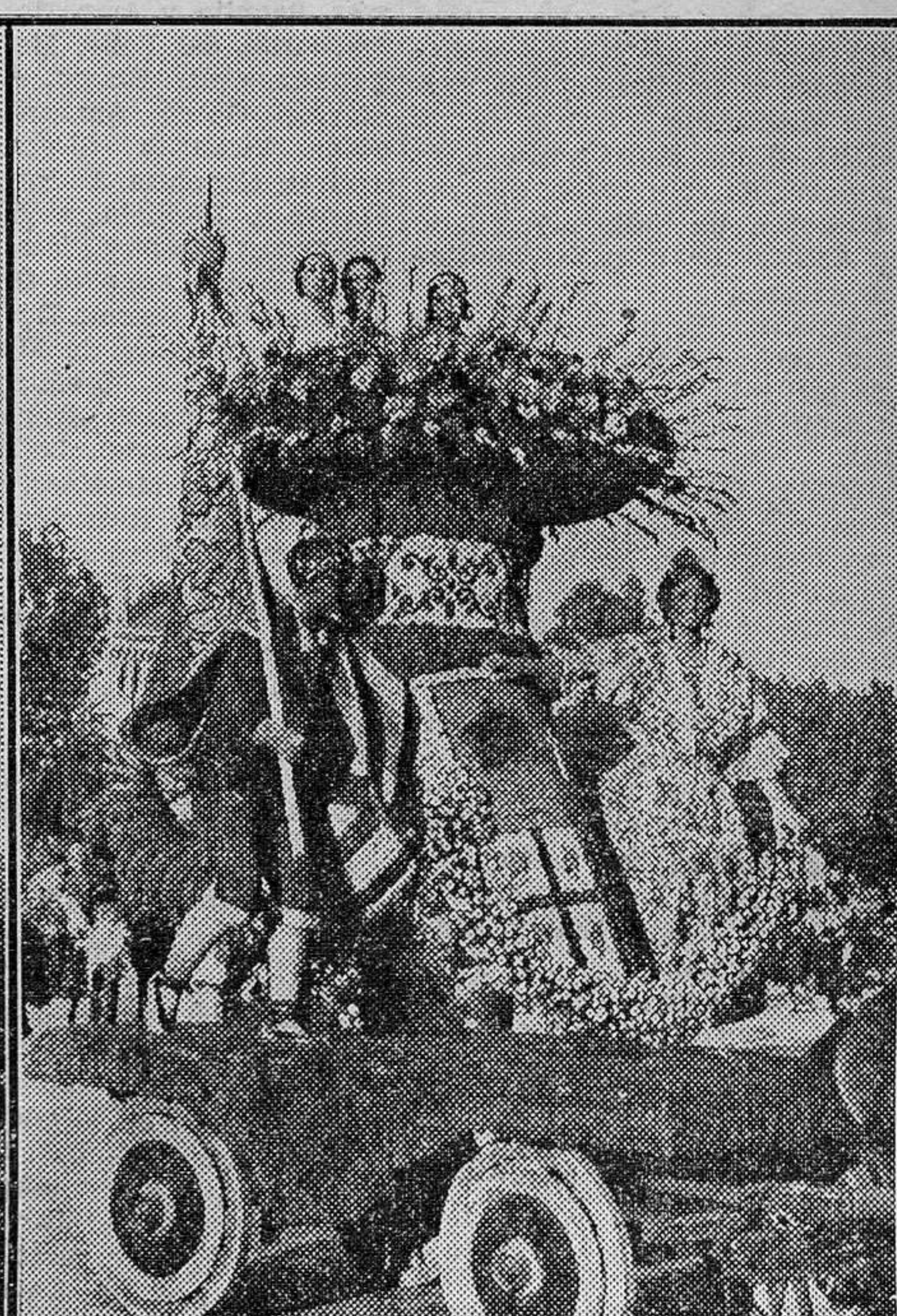
Primer premio, del excelentísimo señor presidente de la República, a la carroza del Círculo de Bellas Artes