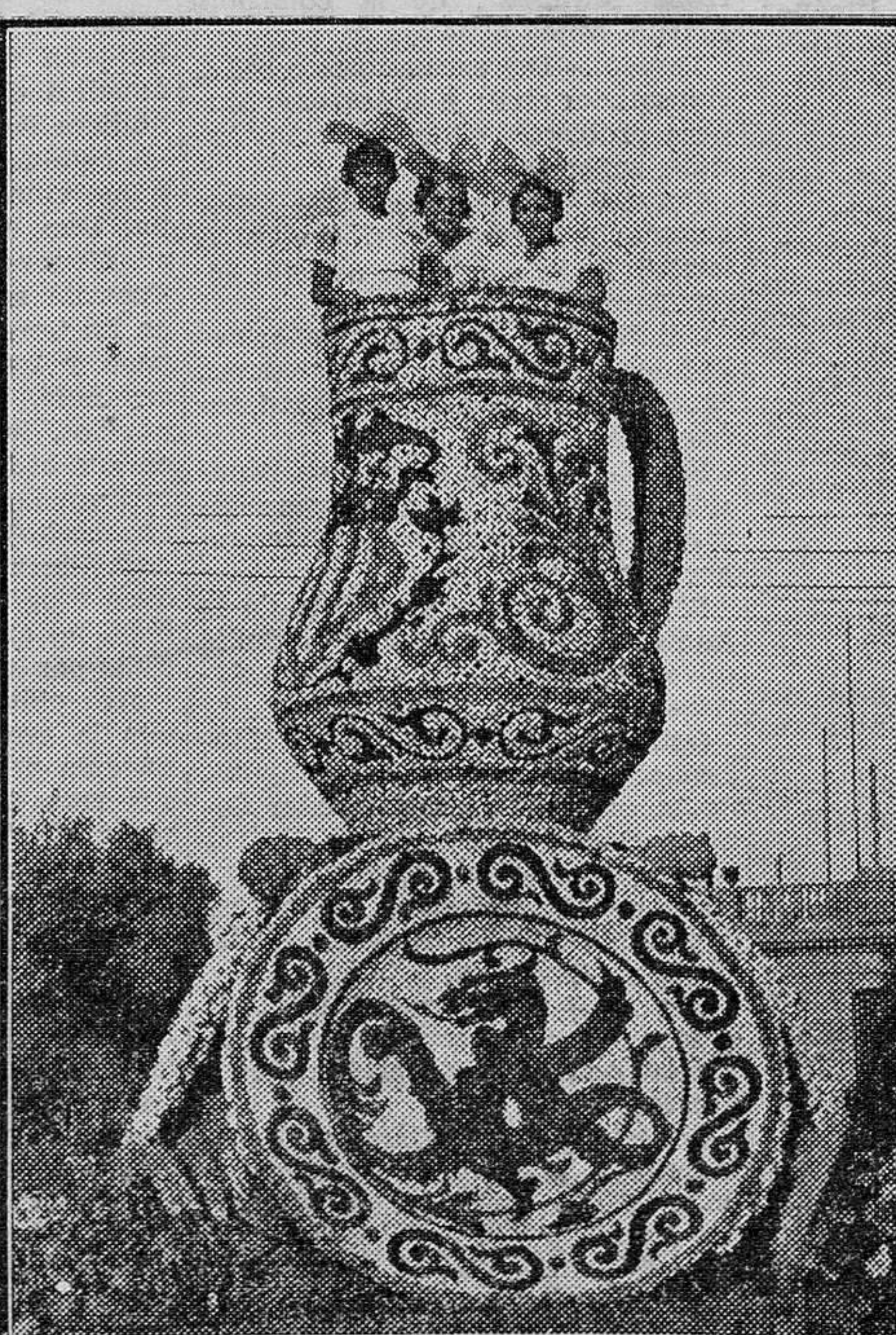
Segundo premio, del comandante militar, a la carroza titulada "Manises"