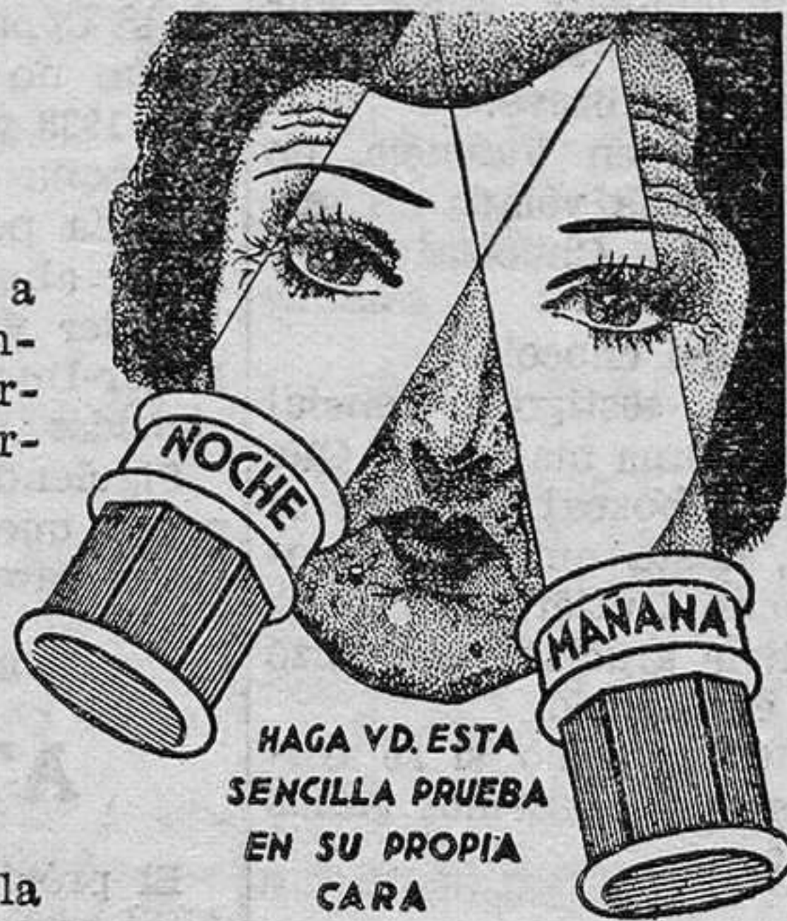
HAGA VD. ESTA SENCILLA PRUEBA EN SU PROPIA CARA

En cuanto procura usted a los tejidos el elemento vital y rejuvenecedor necesario a la belleza, la piel se blanquea, se nutre y se refresca. Este precioso elemento, obtenido de animales jóvenes, está ahora mezclado con la nueva Crema Tokalon, la famosa crema parisiense, y solamente con ella: Color Rosa para la noche—Color Blanco para el día. Así, pues, una piel marchita y aviejada se rejuvenecerá rápidamente; los mús-