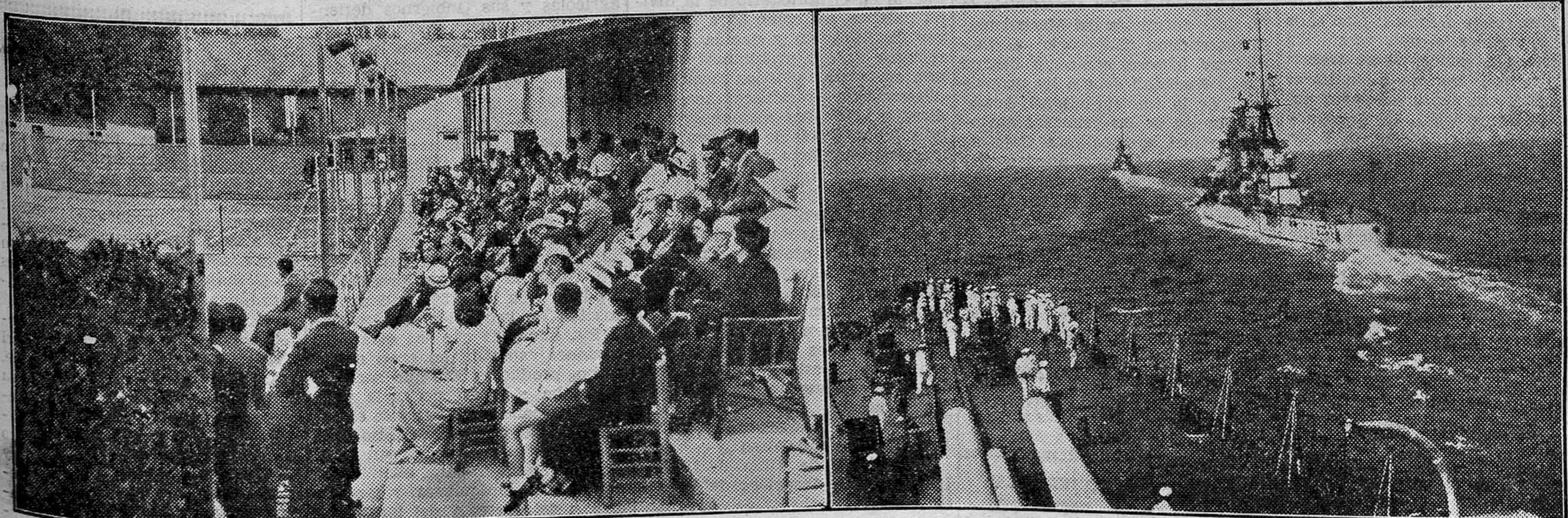
NOTA DEPORTIVA DE ACTUALIDAD. El incremento que el tennis toma en Valencia, lo demuestra la ribuna del Algirós T. C., atestada de público, durante uno de los partidos del campeonato regional que terminó ayer.—La Armada italiana está realizando maniobras de tiro de gran calibre. En la foto se distingue a los cruceros acorazados "Trieste" y "Zara" en línea, antes de comenzar los ejercicios