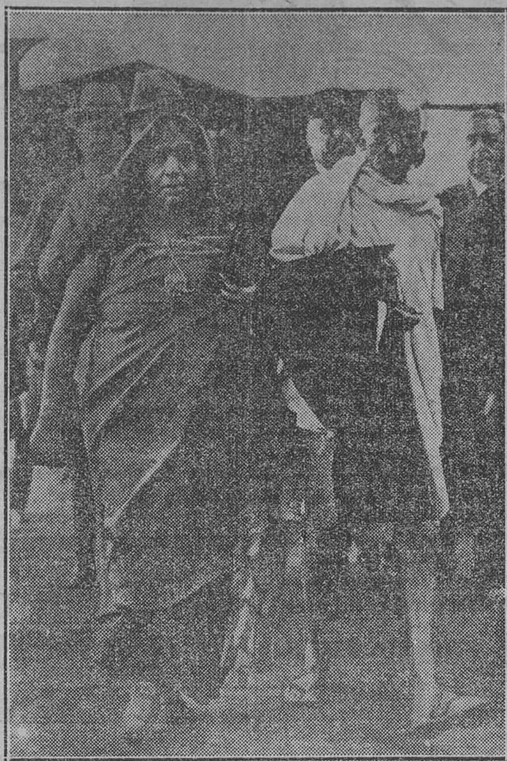
El indio Gandhi acompañado de una poetisa, también india, que le sigue por doquier

Lo que estamos relatando, está, a pesar de las apariencias, en relación estrecha con los actos de indisciplina en la Armada británica, puesto que éstos se han manifestado, a causa de la rebaja de haberes. El día 6 de este mes, al