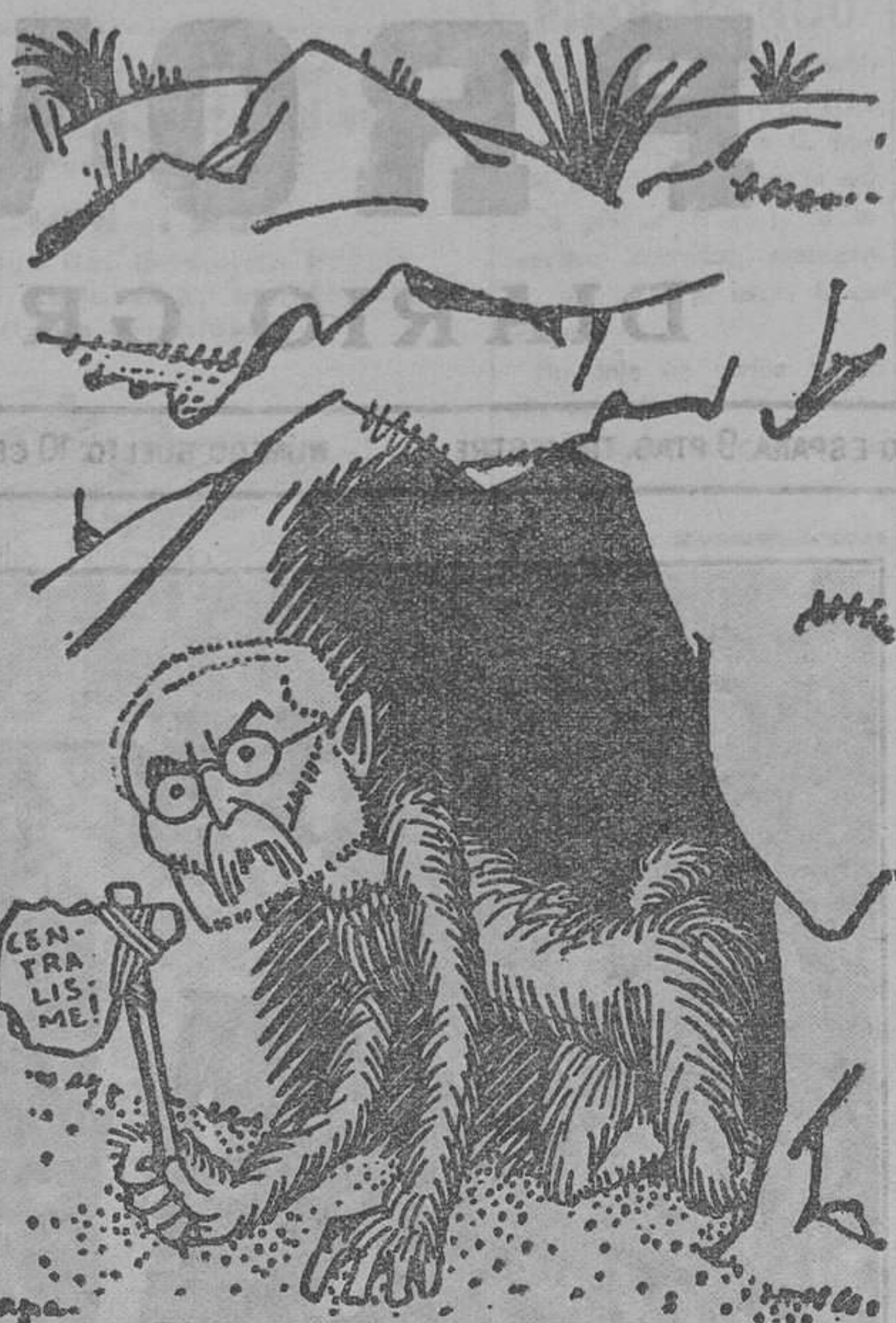
El "Unamuno de Neanderthal, troglodita y cavernícola maximus", según el diario izquierdista "La Publicitat"