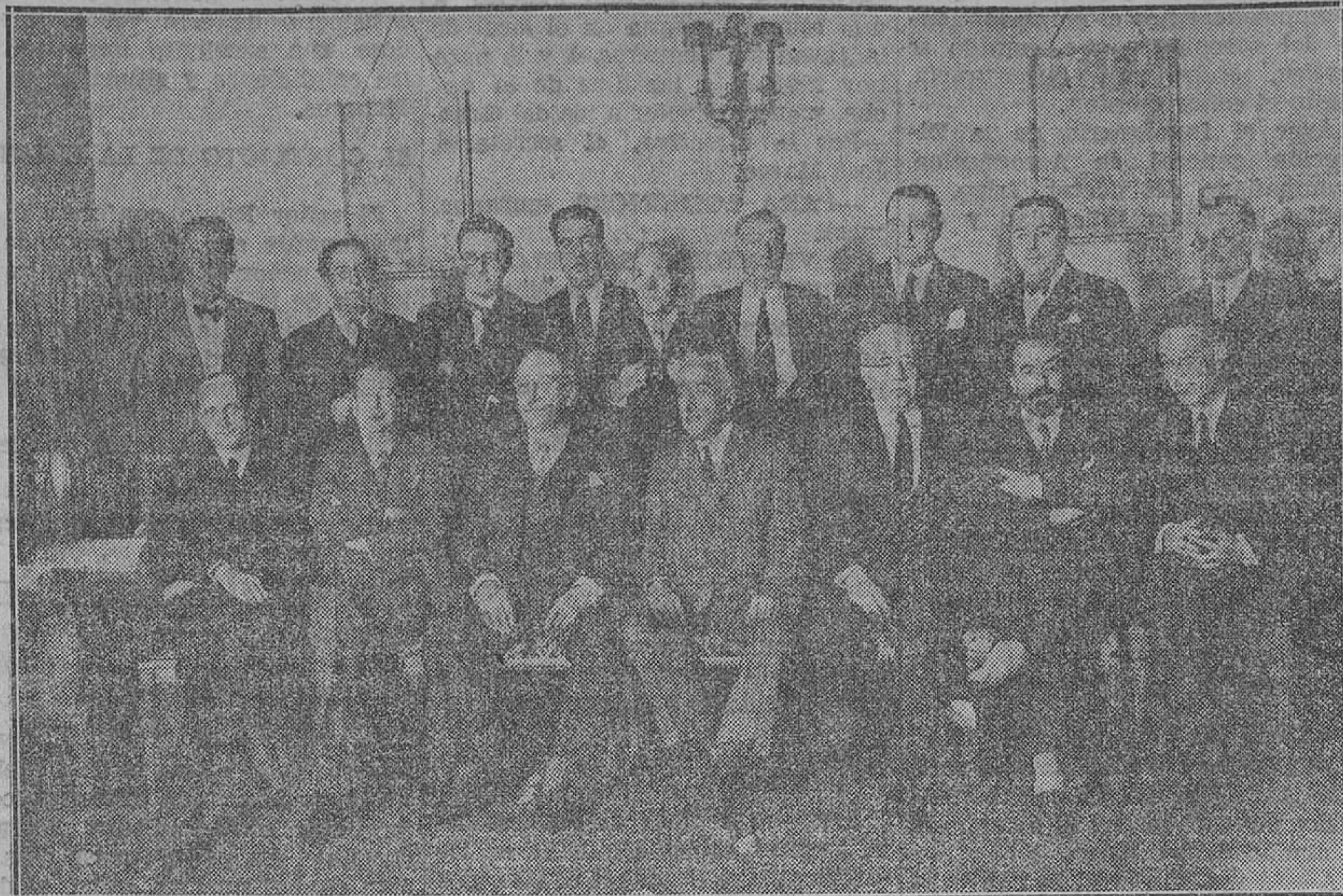
Los concurrentes a la reunión en que se firmó el Pacto de San Sebastián, congregados recientemente para celebrar aquel acto

Besteiro impone orden y pide más respeto para el Parlamento.