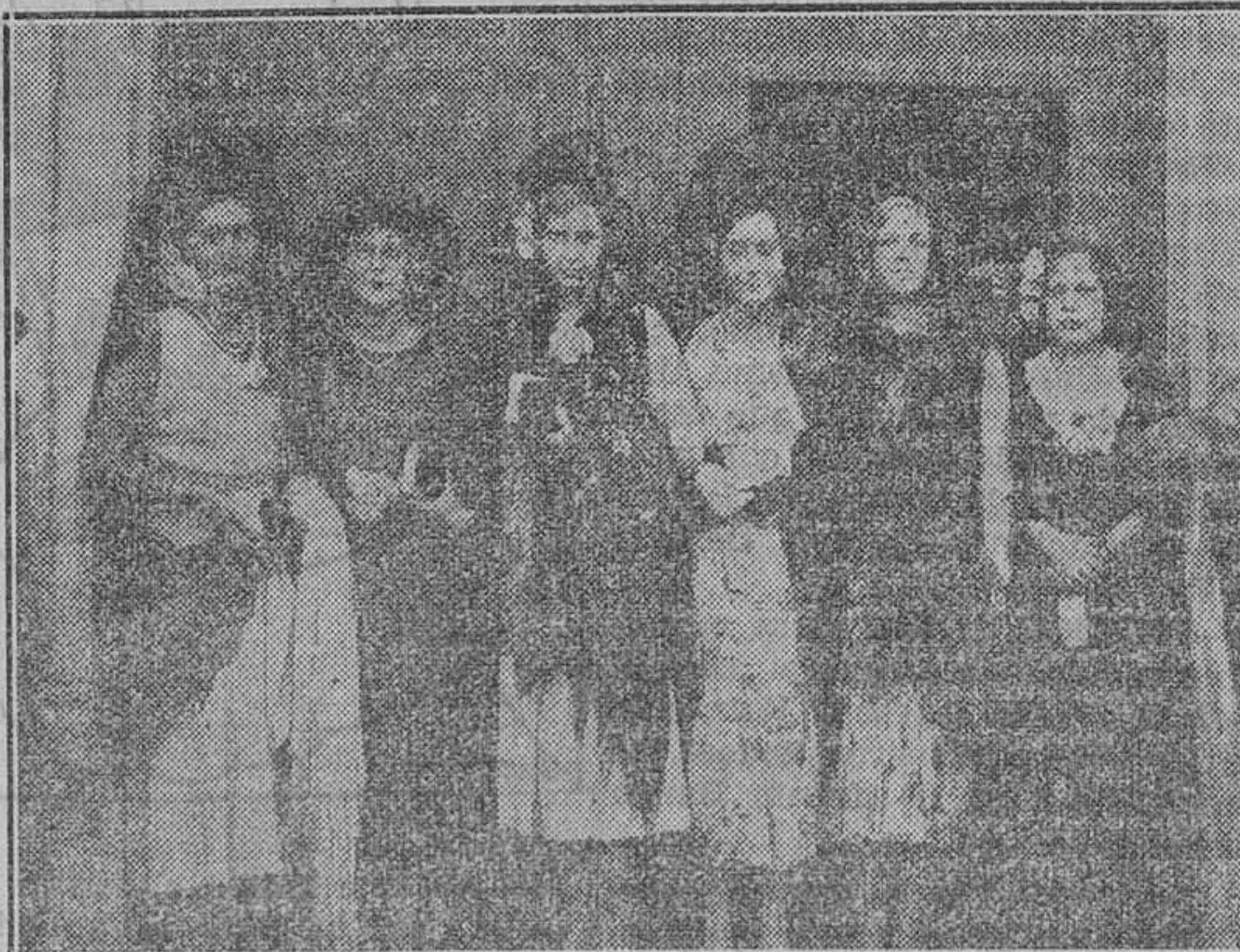
Bellísimas señoritas que presidieron el festival taurino celebrado estos días en Bilbao

Conformes con la explicación de nuestro querido compañero "Jordi