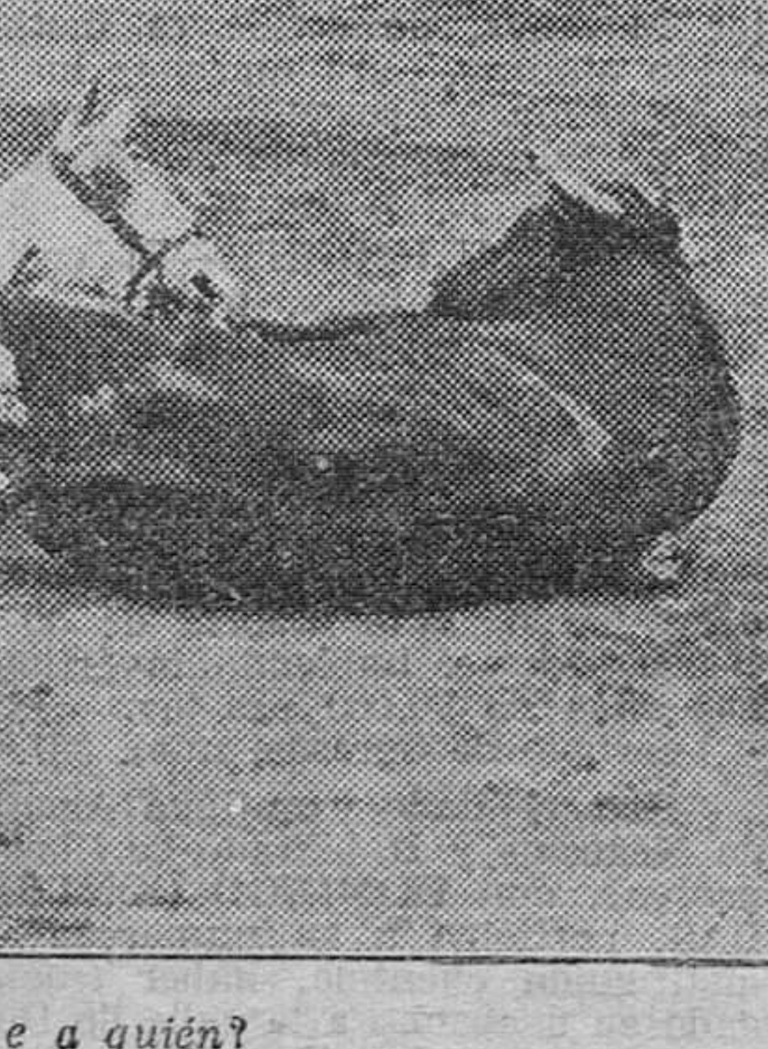
¿Quién vence a quién?