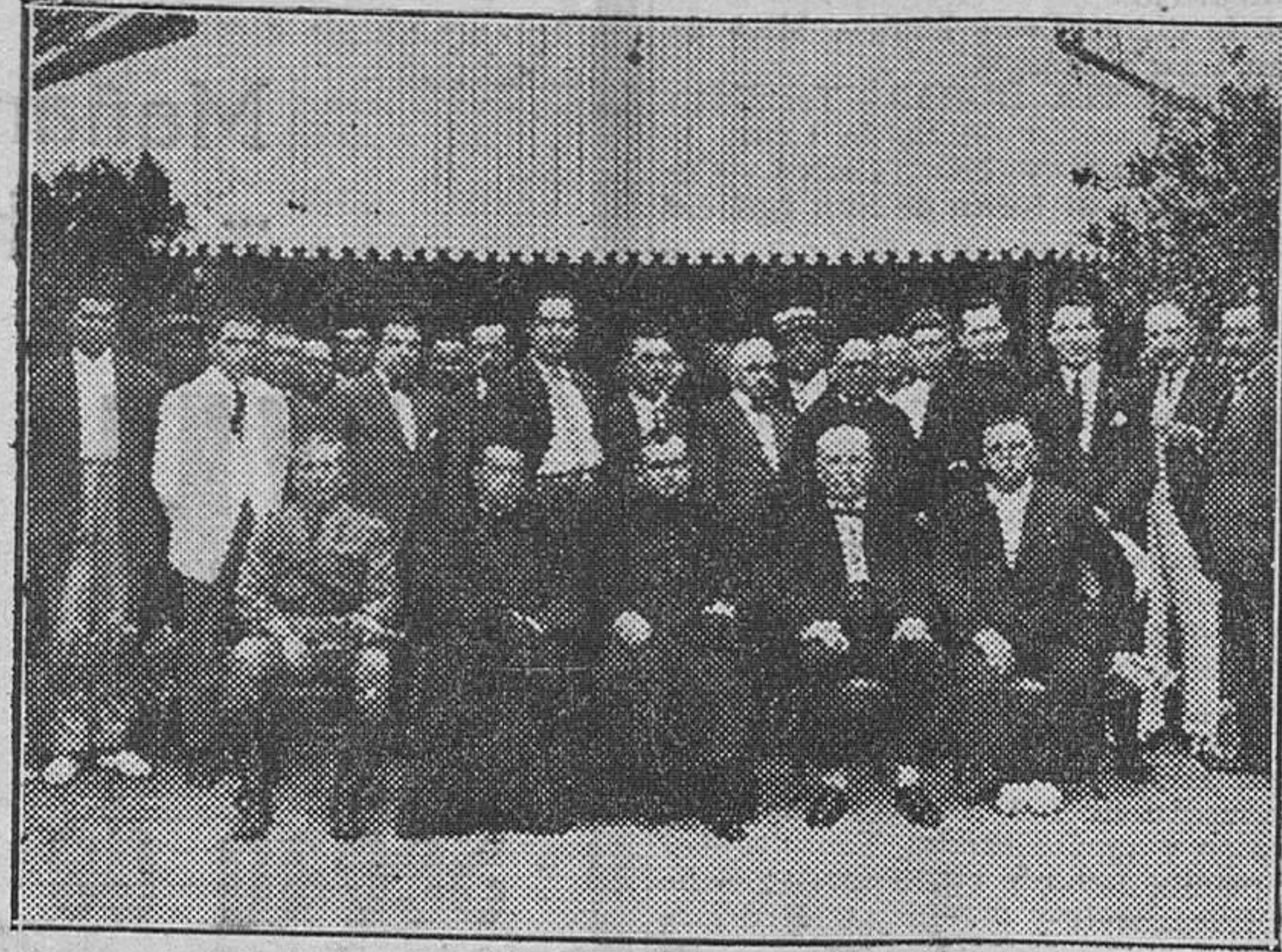
Grupo de autoridades locales e invitados que asistieron a la bendición de un coche del servicio Gandía-Grao.