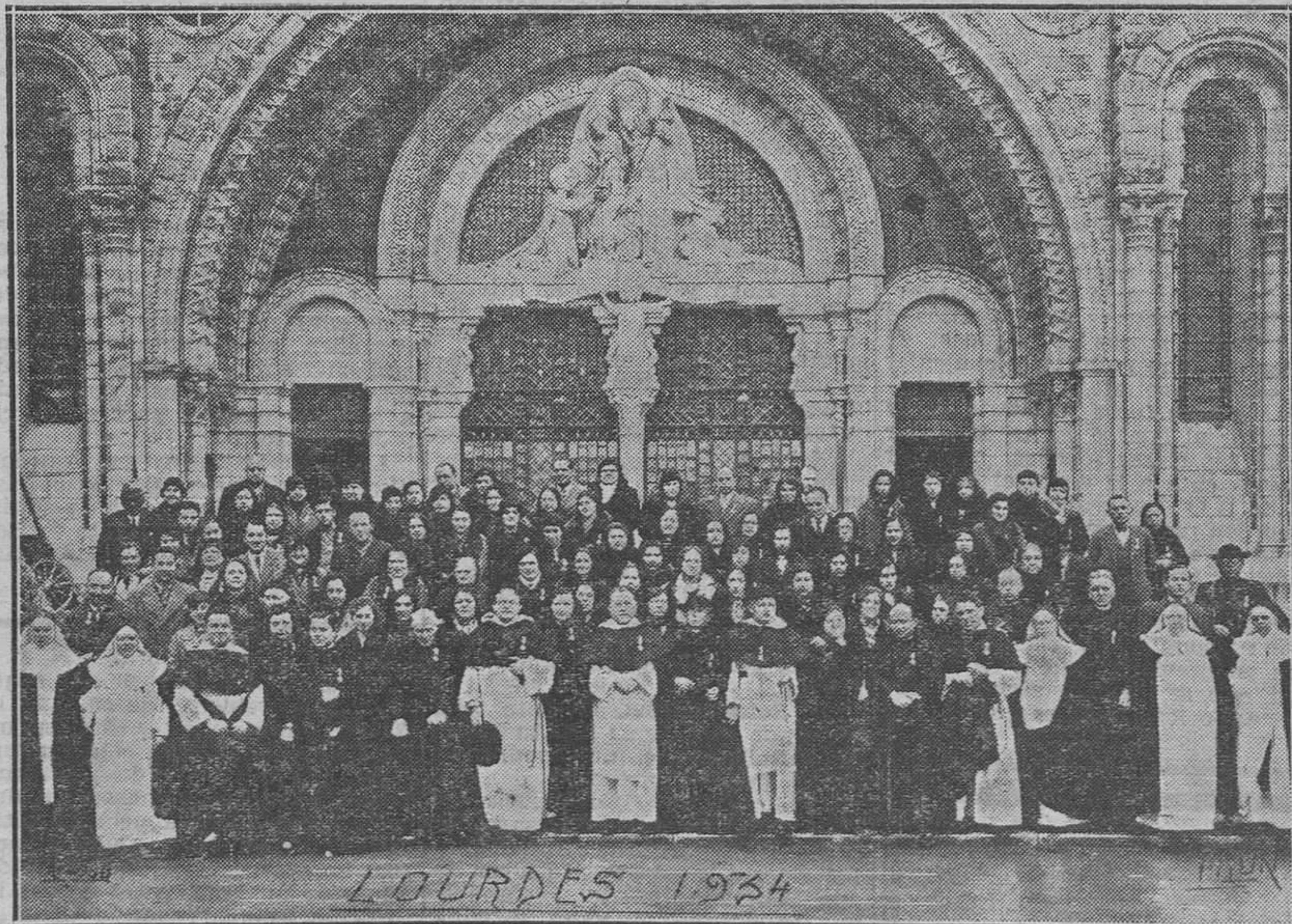
Grupo de peregrinos valencianos en Lourdes, al regreso de Roma, donde fueron recibidos por el Santo Padre y asistieron a la canonización de la Santa Madre Sacramento