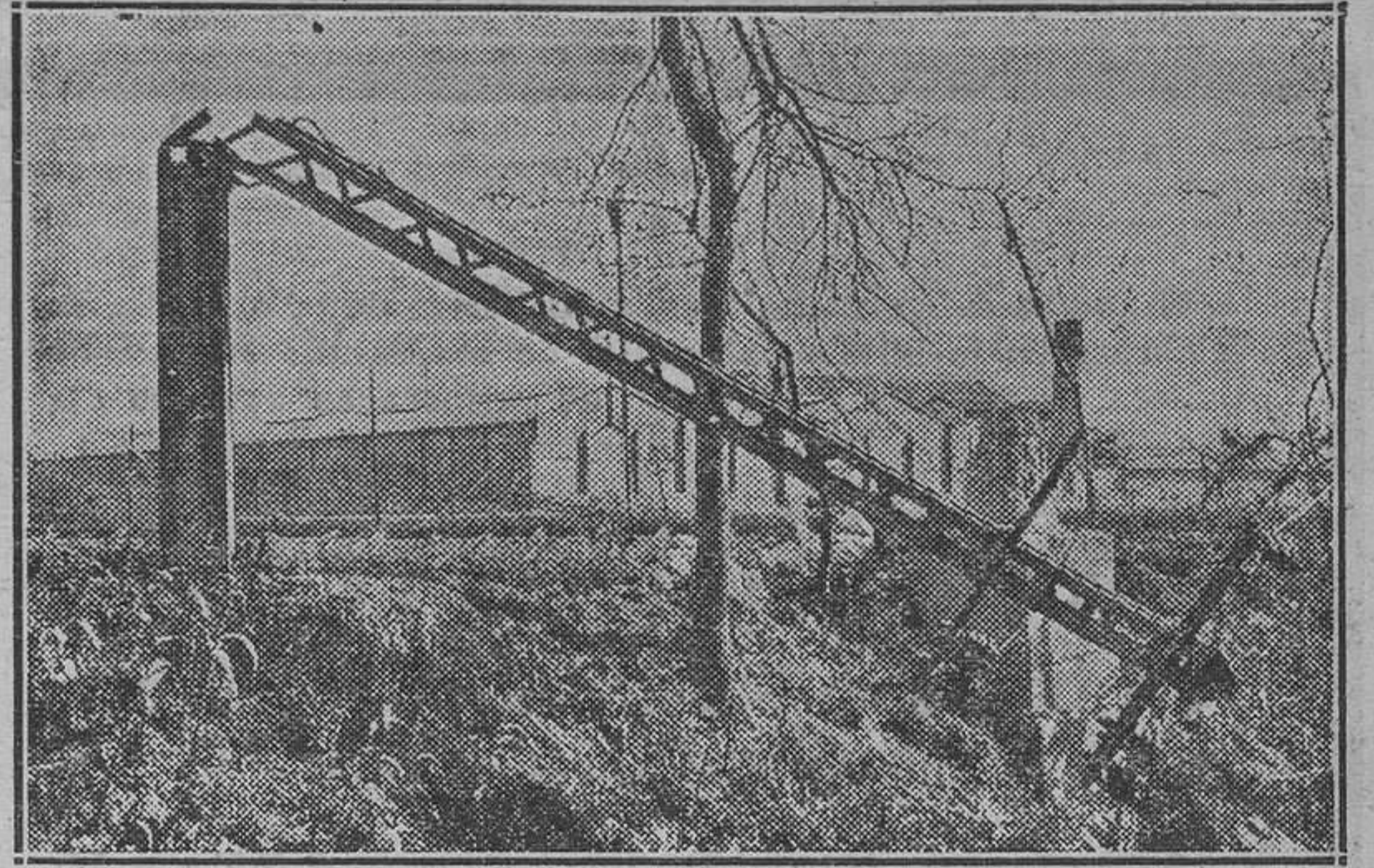
Dos de los varios actos de sabotaje cometidos el martes.