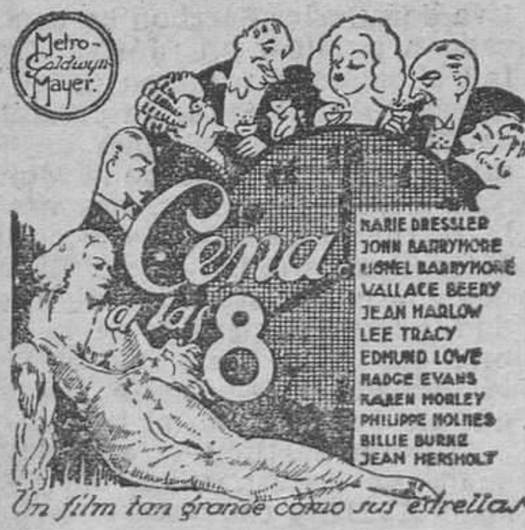
Un film tan grande como sus estrellas

Nota: Debido al largo metraje de este film, se ruega al público la máxima puntualidad.