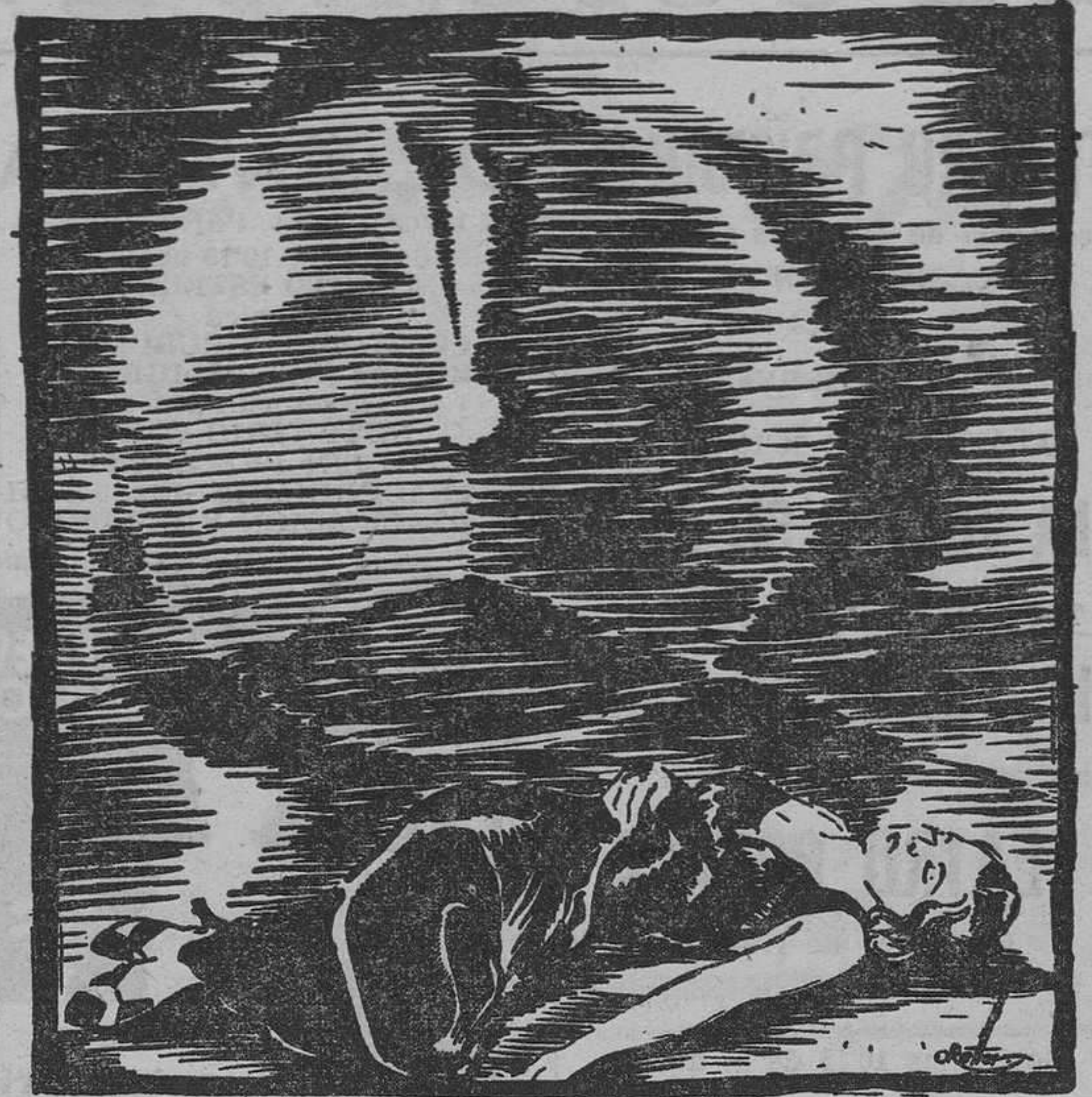
Muchos tenían miedo a "La dama del Club Nocturno", porque conocía demasiadas cosas inconfesables de la vida de ellos; por eso, cuando al filo de la media noche fué asesinada misteriosamente, su muerte, de la que tantos parecían culpables, fué para el sagaz detective Tchatcher Colt uno de los más difíciles problemas de resolver que se le presentaron en su larga carrera de triunfos profesionales. (Dibujo O. Retter. Estudio Cifesa.)