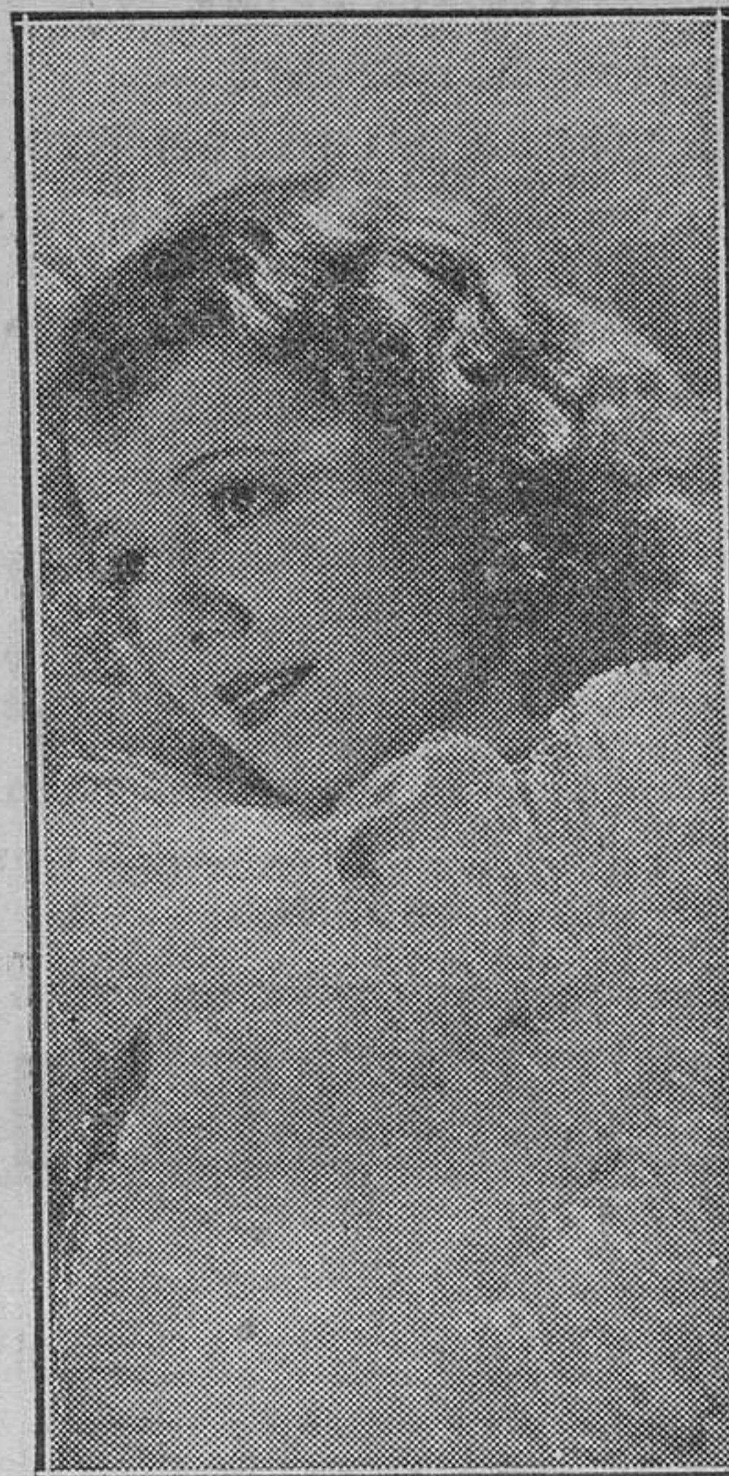
Janet Gaynor, la gentil muchacha que es ornato de los Estudios Fox Pictures