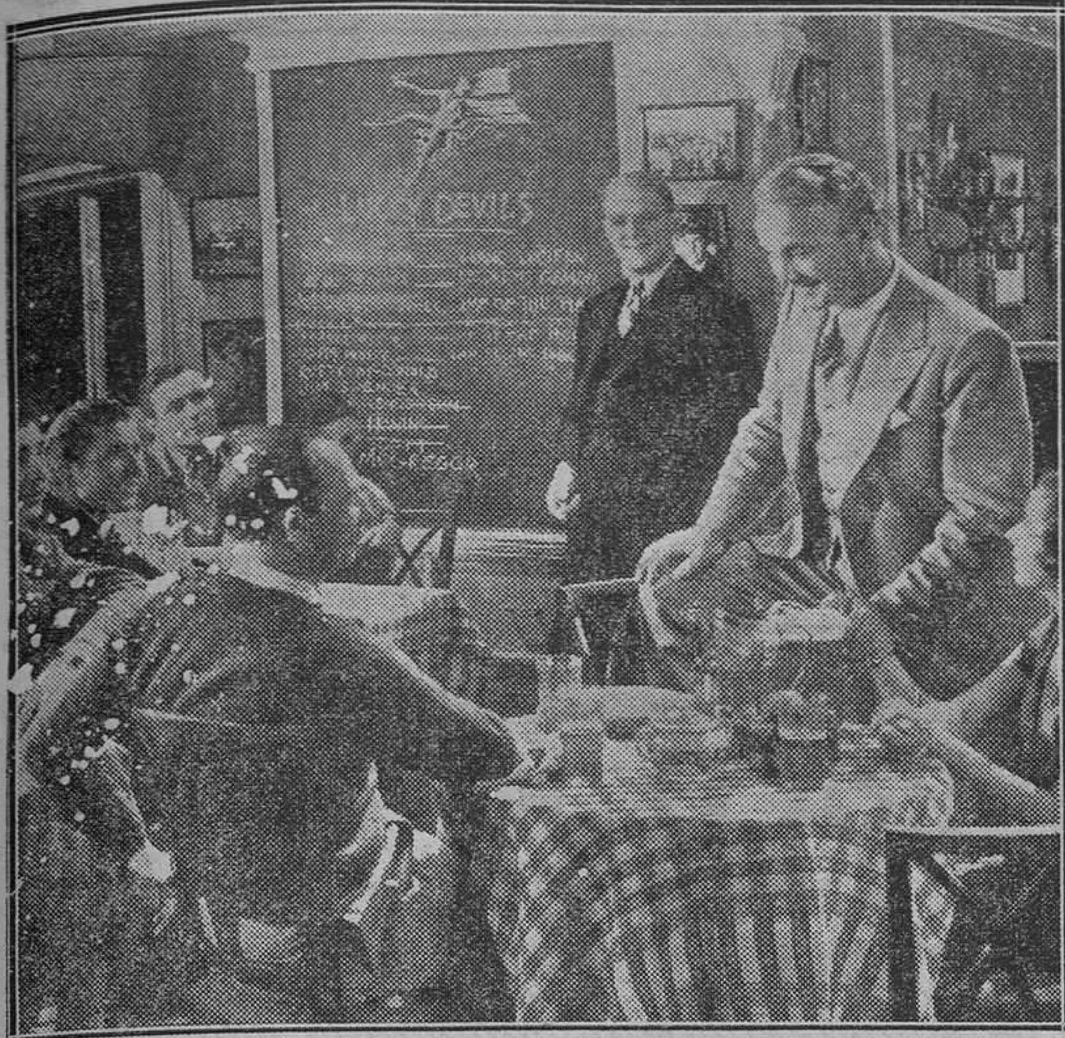
He aquí un puñado de "extras" en alegre camaradería, fase emotiva del film "Cincuenta dólares, una vida", que va a estrenarse el lunes venidero en el Lírico. Película protagonizada por valiosísimos elementos que logran un ajuste y una perfección magistral

El lunes próximo, festividad de San Vicente Mártir, Patrón de Valencia, aparecerá sobre la pantalla del Lírico una película que, si la prensa de Madrid no nos engaña, está llamada a causar sensación. Se trata de "Cincuenta dólares, una vida".