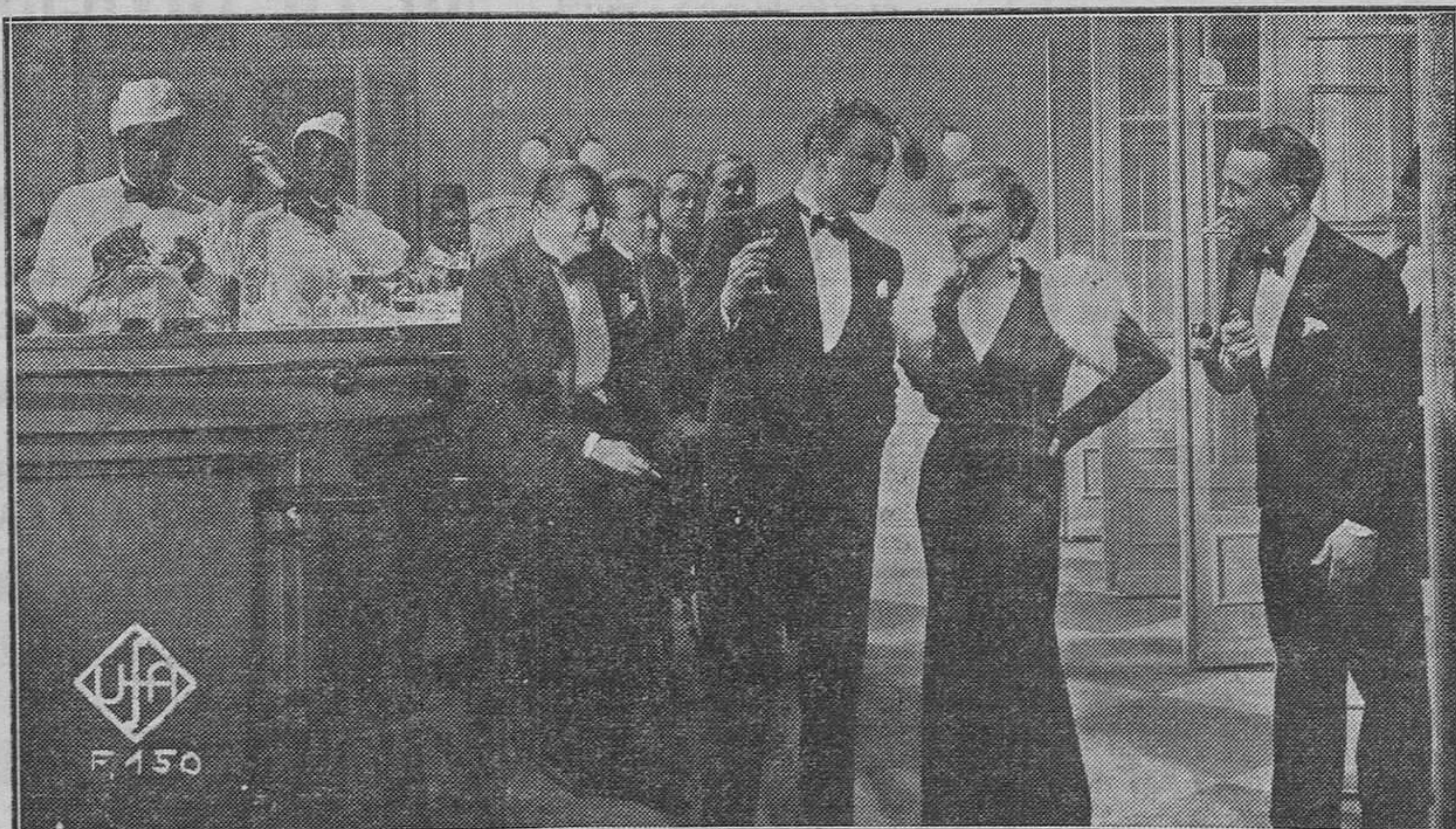
Superproducción de elegancias. Dígalo si no, esta escena galante en el bar del Club mundano, donde los trajes de etiqueta y las toaletas costosísimas esconden y disimulan recelos y deseos