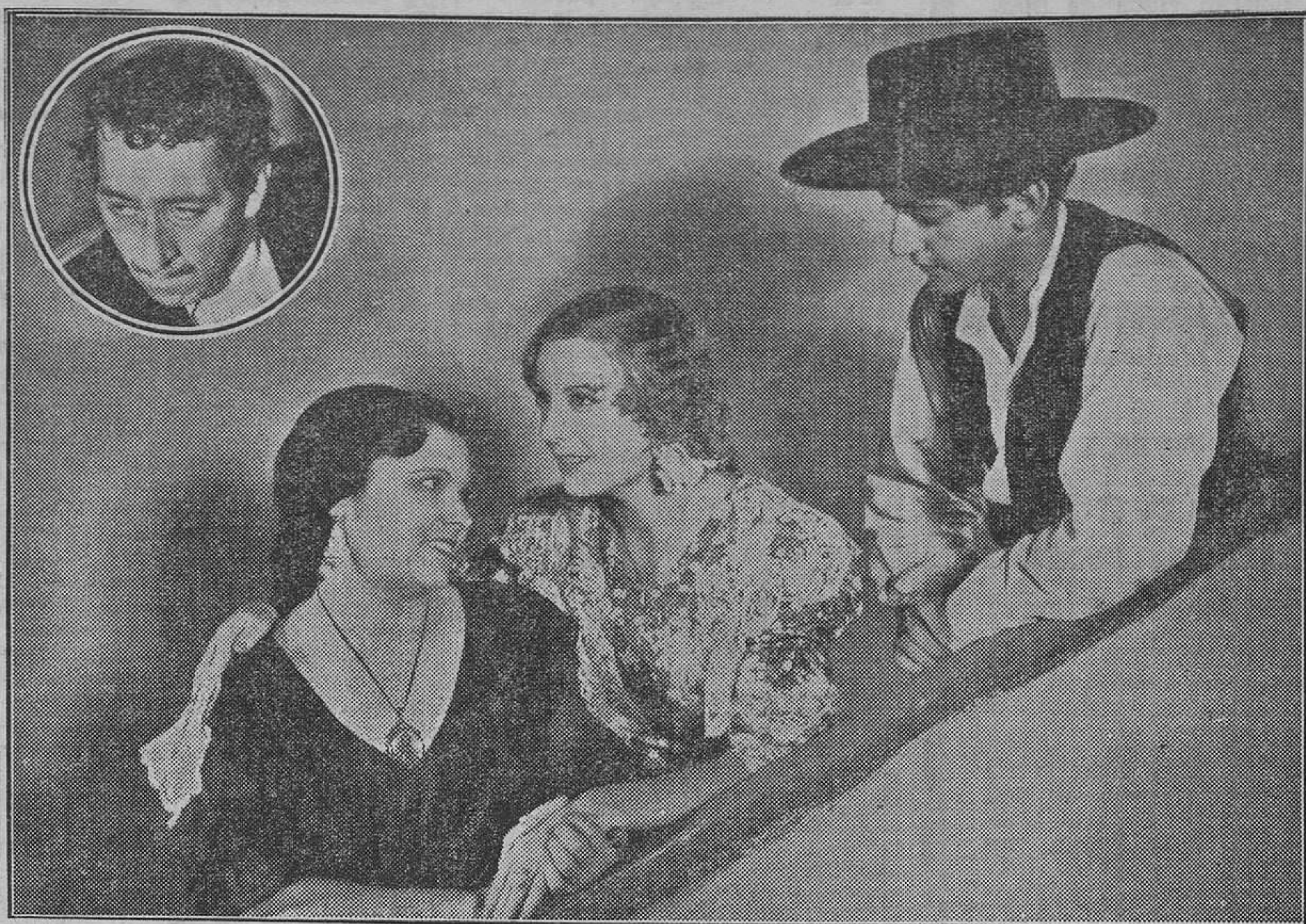
Uno de los bellos momentos de esta gran producción nacional, en la que Rosita Díaz Gimeno tiene su consagración definitiva. En el medallón, caracterizado con majera rondeña, el ilustre marqués de Portago, protagonista y propietario del film, al que ha podido llevar a aristocracia y dejos hispánicos de solera

escamujo en la diestra y un cor-dobés en las sienes, en la jaca andaluza, encabritada sobre las serranías cordobesas, y ni siquiera a su capricho, sino preso a las órdenes de un director español que sabe su menester y se llama Florián Rey.