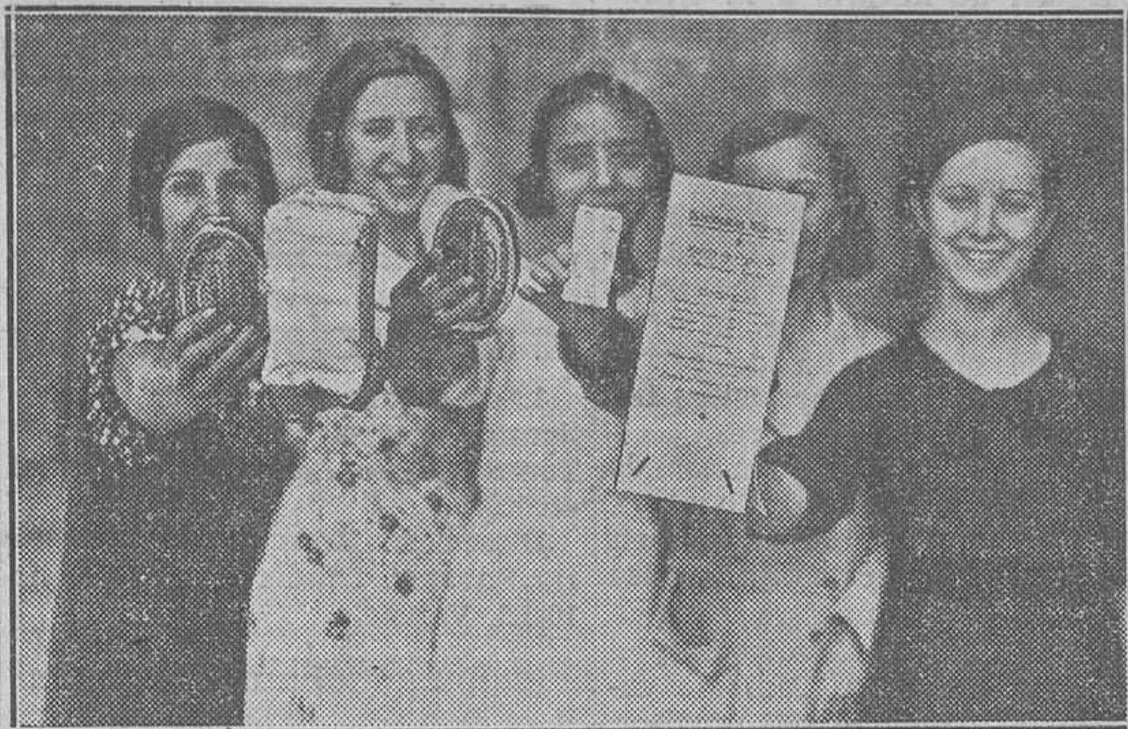
Grupo de muchachas mostrando las viandas que contienen las cajas del soldado con destino a las tropas de las próximas maniobras.

Naturalmente que por muchas sordinas que el Gobierno intente poner al escandaloso asunto de las responsabilidades políticas del contrabando de armas, será inevitable contener el estrago que ello ha producido en la calle, y, por tanto, será imposible realizar el designio de que en una próxima crisis no se estime este factor del flagrante delito de las izquierdas. He dicho aquí hace muy pocos días, que había una maniobra muy alta para imprimir a la crisis en puerta un rumbo contrario a la lógica y a la biología constitucional que impone la formación de un Gobierno sobre la base de la C. E. D. A. El escándalo producido por los alijos de armas viene a estorbar aquella intriga de alto coburno en tanto en cuanto demuestra que es catastrófica una solución de la crisis que no sea en un sentido de derechas. Pero la intriga no se arredra; antes bien, se crece e inventa este maquiavelismo, propio de un cacique rural o de un avestruz, que consiste en simular que nadie se entera de una cosa porque al avestruz o al necio personaje con alma de cacique rural le convenga para imponer su capricho y su pa-