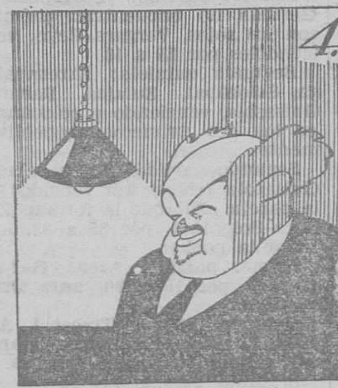
¡Ahora la Patria se salva pues trabajan... hasta el Alba!