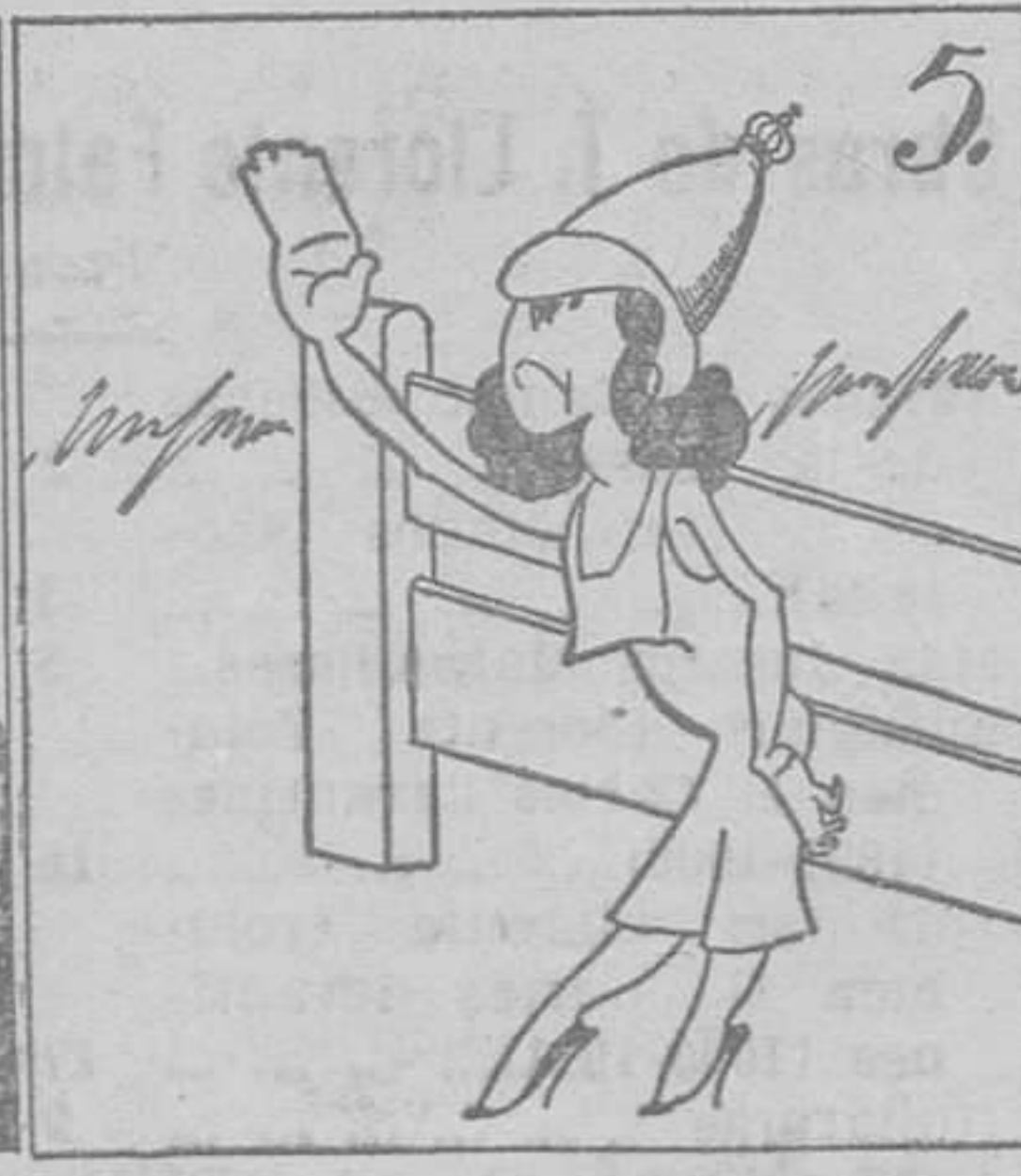
Un día estuvo en acción la monárquica obstrucción.