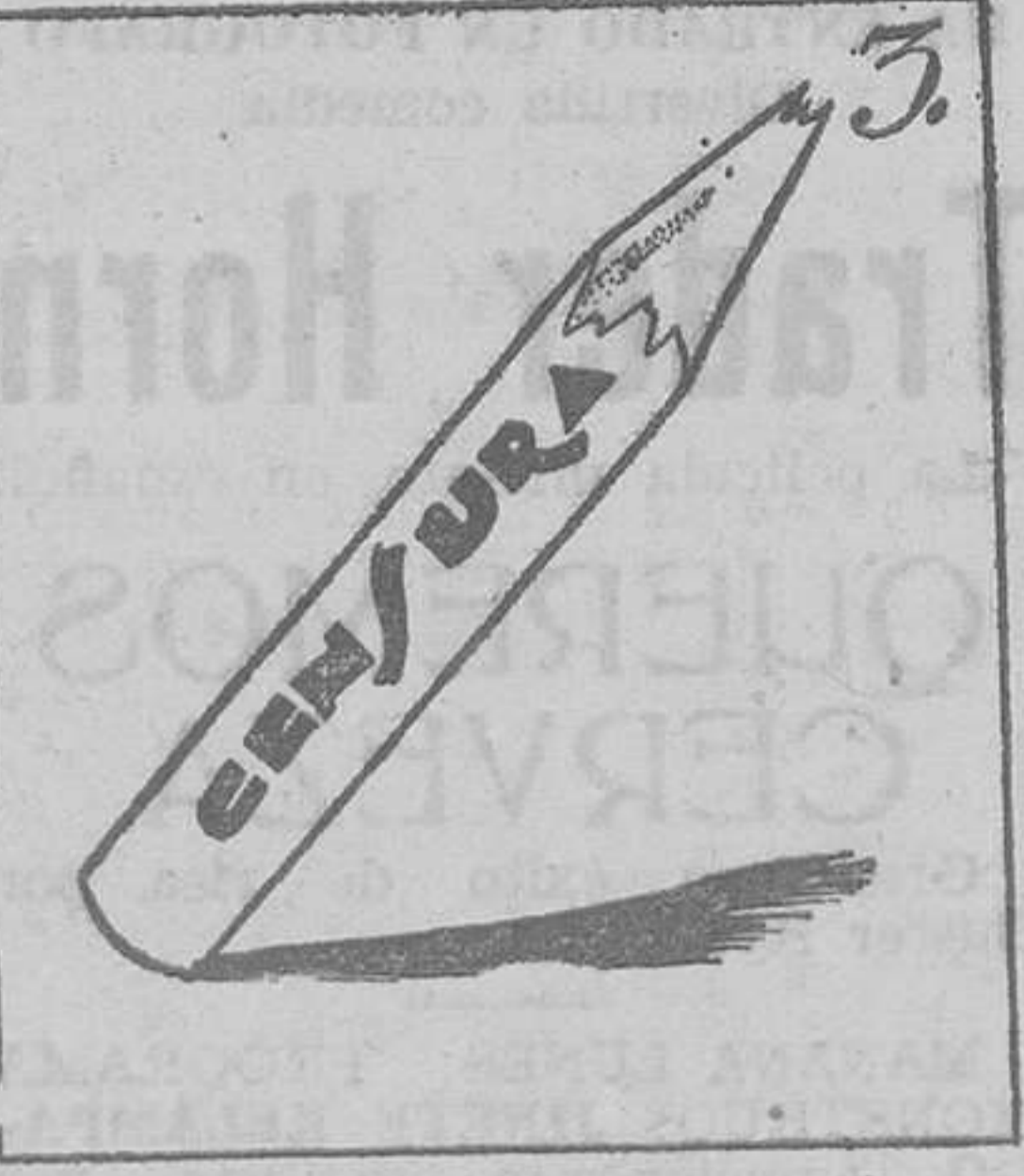
Dice esta caricatura: "Ya no existe la censura".