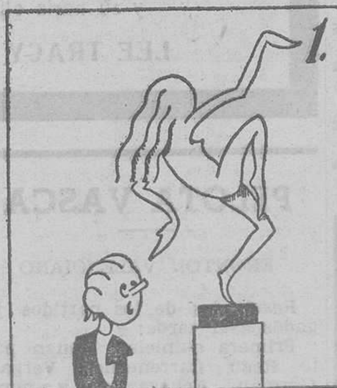
Se celebra la oficial Exposición Nacional.