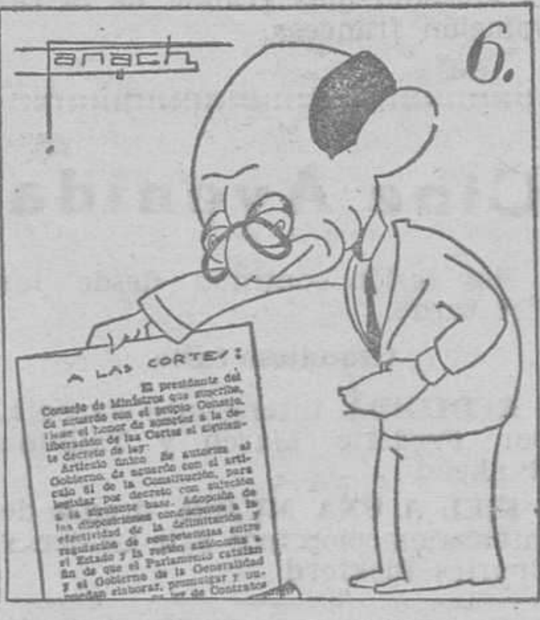
Y solucionando están el problema catalán. (Texto y monos de Panach.)