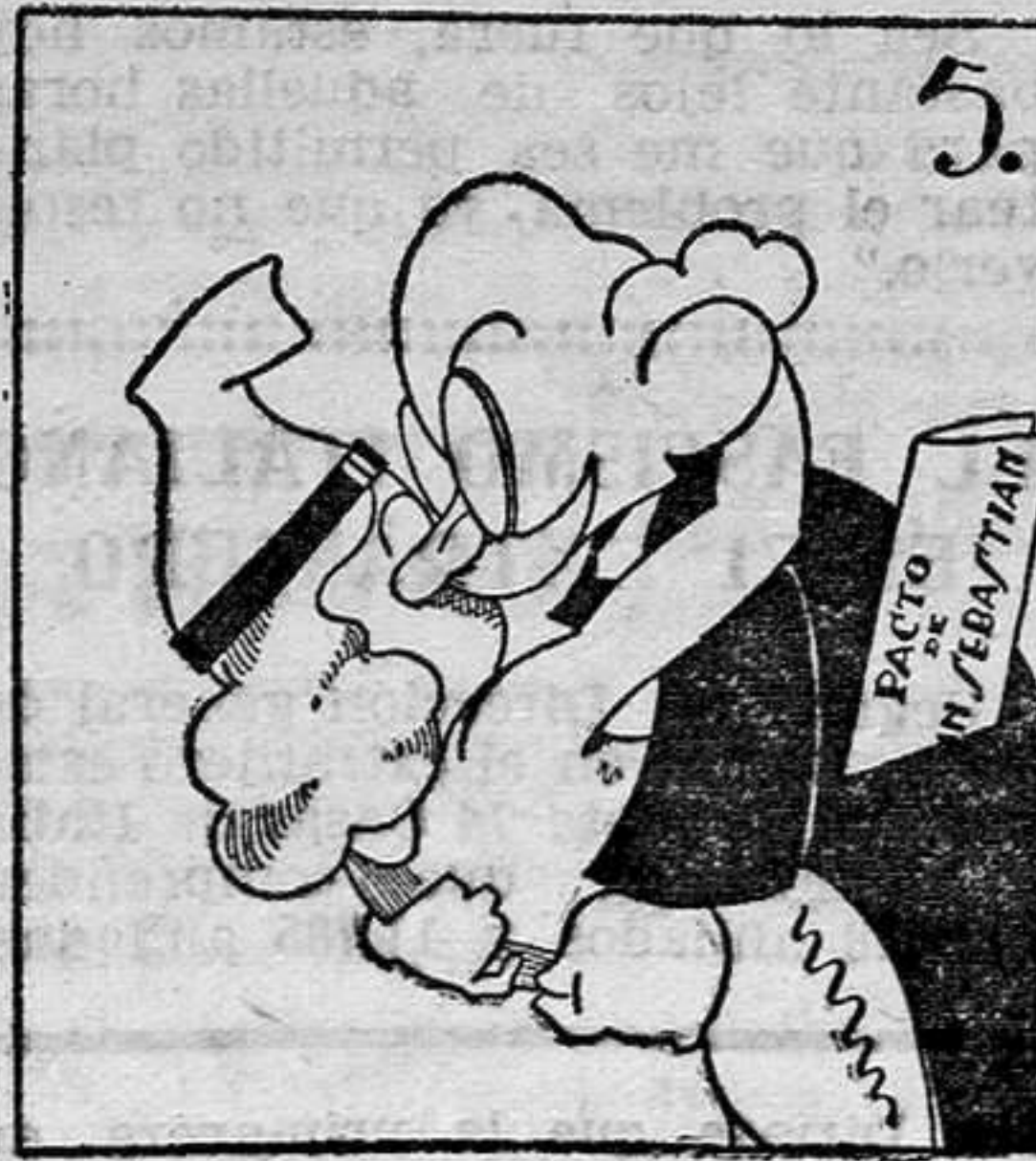
Eslava: "¡Oh, oh, el amor!".