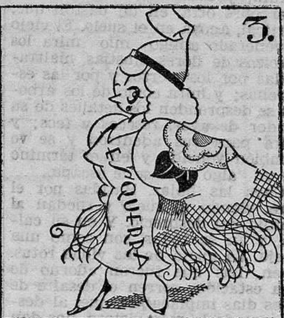
Apolo: "La chulapona".