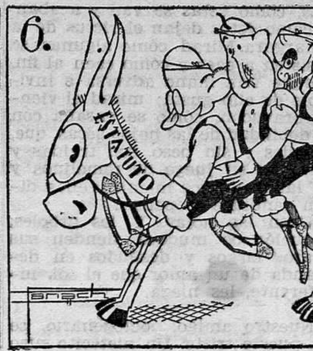
Alkázar: "En un burro, tres baturros". (Monos de Panach.)