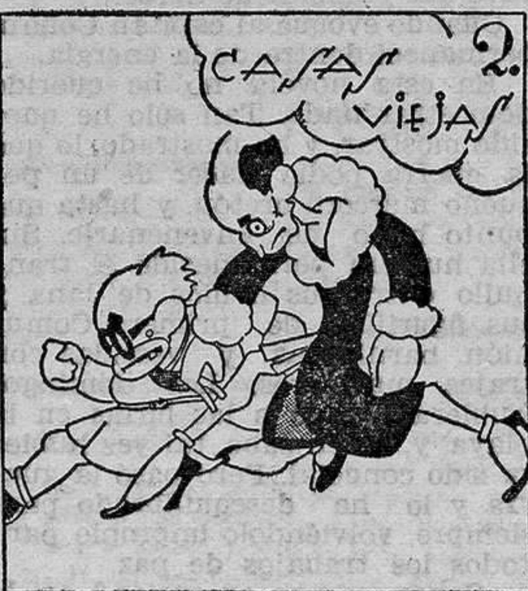
Principal: "Las hijas del diablo".