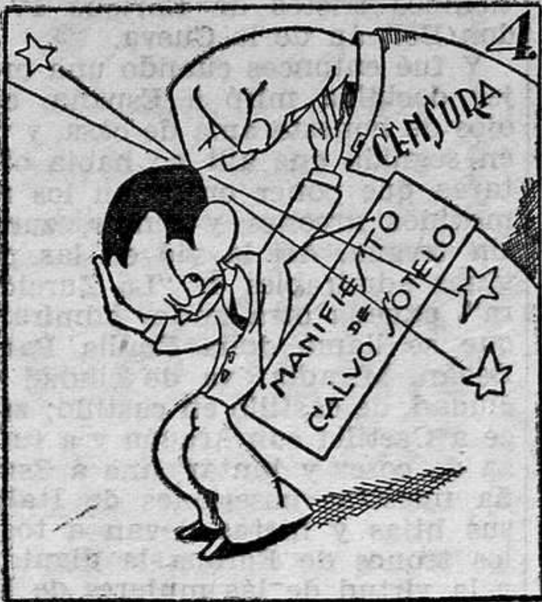
Ruzafa: "Al Capon...e".