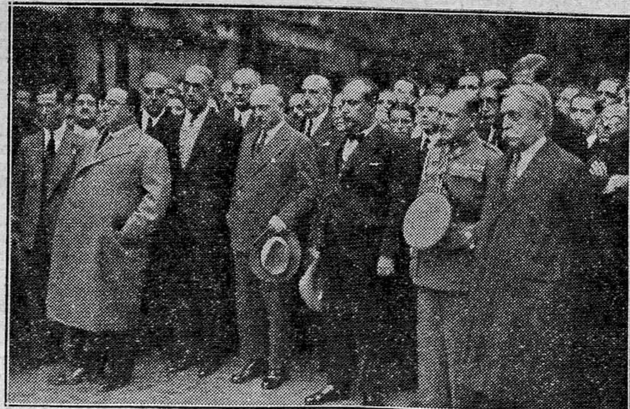
Presidencia del duelo del entierro del ingeniero don Rafael del Riego, asesinado por los revolucionarios en Asturias, en la que figura el ministro de Industria y Comercio, señor Orozco, y otras personalidades.